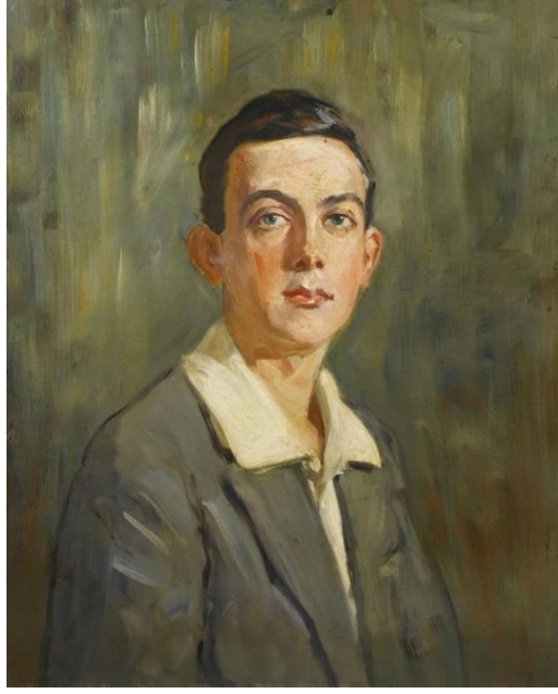
Görsel-3: Mihri Müşfik Hanım, Genç Erkek Portresi, Tüyb, 62,5x50,5 cm, Tarihsiz, SSM İstanbul