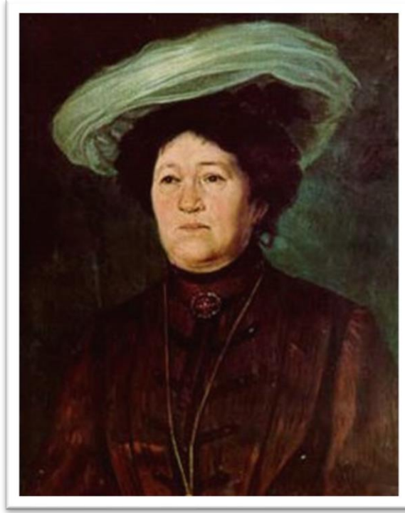
Görsel-1: Hasan Rıza, Bir Kadın Portresi, Tüyb, 62.5 x 50.5 cm, İstanbul Resim ve Heykel Müzesi

Hasan Rıza, oldukça ileri seviyede anatomi bilgisine sahip bir portre ressamıydı. Türk tarihinin önde gelen kişilerini resmetmiştir. Görseldeki kadın portresi tuvale dikey bir şekilde yerleştirilmiştir. Karşımızda modern giyimli orta yaş üstü bir kadın portresi bulunmaktadır. Boynunda ise bir broş ile kolye yer almaktadır. Oldukça donuk ve hüzünlü bir yüz ifadesine sahip olan figür, oldukça gerçekçi bir şekilde resmedilmiştir. Fondaki firuze rengi ile figürün üzerindeki elbiselerin rengi oldukça uyum içerisindedir (Gündüz, 2006: 38-156-157).