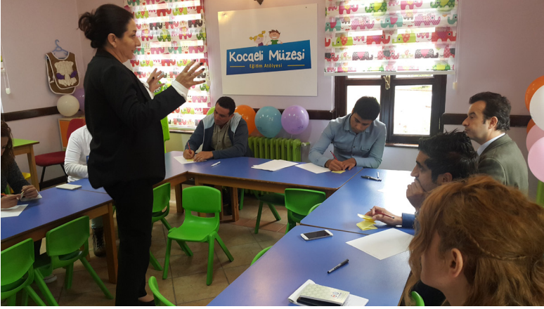
Resim 1. Kocaeli Müzesi uzmanları ile odak grup çalışmaları

Müze uzmanlarının büyük bölümü müze eğitimi alanında 5 – 6 yaş grubuyla Mevsim Heykelleri üzerine, 10 – 11 yaş grubuyla etnografik eserler ve sikkeler üzerine, 8 - 10 yaş grubu ile Yorgun Herakles Heykeli üzerine ve 12 – 14 yaş grubu ile kurtarma kazıları vitrini üzerinde çalışmak istediklerini ifade etmiştir. Bu çalışmalar dışında, 13 yaş ve üzeri öğrencilerle restorasyon ve konservasyona yönelik çalışmalar yapılmak istendiği vurgulanmıştır.