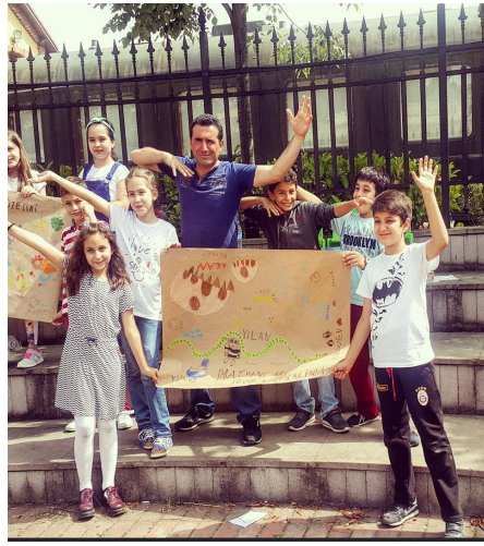
Resim 5. Afiş çalışması

Eğitim Projesi'nin altıncı ve son aşamasında proje ekibi Kocaeli Müzesi koleksiyonundan yola çıkarak okul öncesi dönem çocuklarına, ilkokul 1-5. ve ortaokul 5-8. sınıf öğrencileriyle lise öğrencilerine yönelik müze eğitim etkinliklerinden oluşan bir kitapçık hazırlamıştır. Kitapçıkta müze eğitimi kavramı tanımlanmış, müze ile okul işbirliğinin biçimleri örneklendirilmiş ve müzede gerçekleştirilebilecek müze ziyaretleri, rehberli geziler ve eğitim etkinlikleri ayrıntılı olarak açıklanmıştır. Müze eğitimi etkinliği hazırlanırken dikkat edilmesi gereken konular bağlamında gelişim düzeylerine, sanatsal gelişim aşamalarına ve sınıf düzeylerine göre nasıl eğitim etkinlikleri hazırlanacağına ilişkin ipuçları paylaşılmıştır. Kitapçıkta ayrıca müzede ölçme ve değerlendirmenin nasıl yapılacağına da yer verilmiştir. Kitapçıkta son olarak Müzede mevsimler (okul öncesi), Müzede Hayvanlar (İlkokul 1. sınıf), Müzede Geometri (İlkokul 2. sınıf), Beslenme kültürü (ilkokul 3. sınıf), Kültürel Miras: Değişim ve Süreklilik (İlkokul 4. sınıf), Müzenin Heykelleri (ilkokul 5.-6. sınıf), Kültürel Miras: Gelenek – Görenekler (7.-8. sınıf) ve Herakles'in 12 Görevi (Lise) eğitim örneklerine yer verilmiştir.