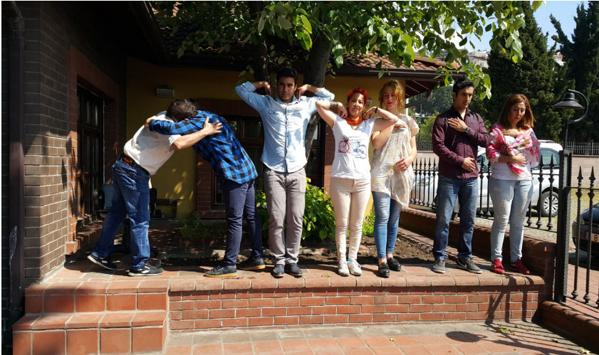
Resim 2. Donuk imge çalışması