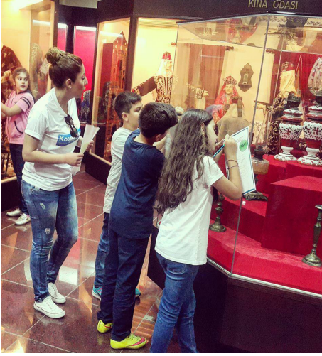
Resim 4. Müzede ara-bul çalışması