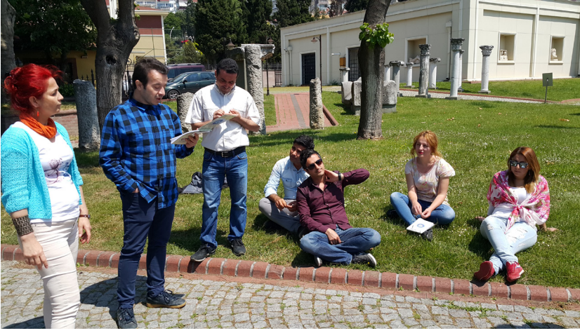
Resim 3. Müzede hayvanlar ve Müzede Kahramanlar temalı öykü çalışmaları