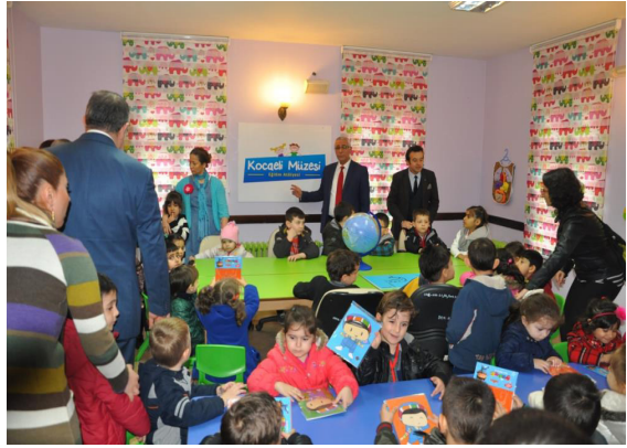
Kocaeli Müzesi çocuk atölyesi

Müze koleksiyonunun farklı yaş ve ilgi gruplarından ziyaretçilerin ilgisini çekecek biçimde eğitim etkinlikleri kapsamına alınması ve müze uzmanlarının müze koleksiyonundaki kültür varlıklarının eğitim amacıyla kullanılabilirliğine ilişkin yöntem ve teknik bilgisi ile müze eğitimi deneyimi sahibi olmasının amaçlandığı Kocaeli Müzesi Eğitim Projesinde müze eğitimcilerinin eğitimi kapsamında, ilk aşamada Kocaeli Müzesi ziyareti gerçekleştirilerek müze koleksiyonu hakkında ayrıntılı bilgi alınmış, müze binası ve çevresinde inceleme yapılmış, tema ve beş haftalık eğitim içeriği ile eğitimcilerin eğitimi sürecinde müze eğitimine katılacak müze personeli belirlenmiştir.