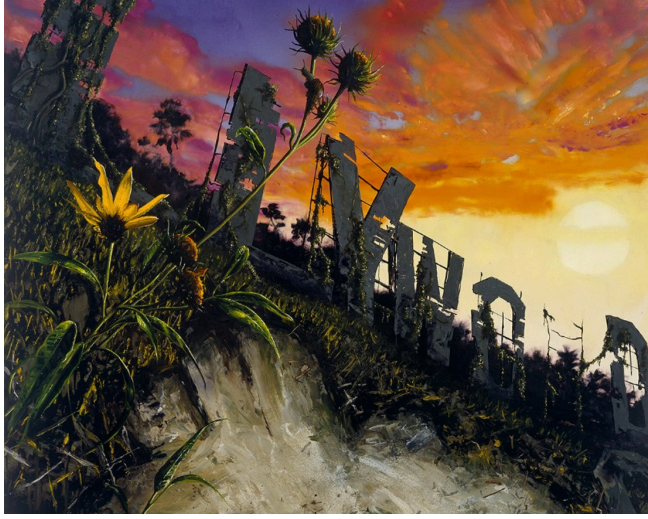
Görsel 5. Alexis Rockman, Hollywood , 2005, Ahşap üzeri yağlı boya, Kum, Saman, 81,3x101,6 cm, Leo Koenig Gallery

sardığı distopik şehirler olarak resmetmektedir. Özellikle Uzakdoğulu günümüz ressamları bu temayı oldukça yoğun kullanmaktadır. Uzakdoğu'da (özellikle Çin'de) artan nüfus ve değişen iklim koşulları sanatçıların bu durumunun sonunu sorgulamalarına neden olmuştur. Amerikalı sanatçı Alexis Rockman, resimlerinde doğayı insanlığın sonu gelmiş bir biçimde resmetmiştir. Bazı resimlerinde bu yeni dünyada sadece vahşi ve avlanan hayvanlar var iken, bazı resimlerde etrafında sadece bitkiler olan terk edilmiş ve harabelere dönmüş şehirler vardır (Görsel 5).