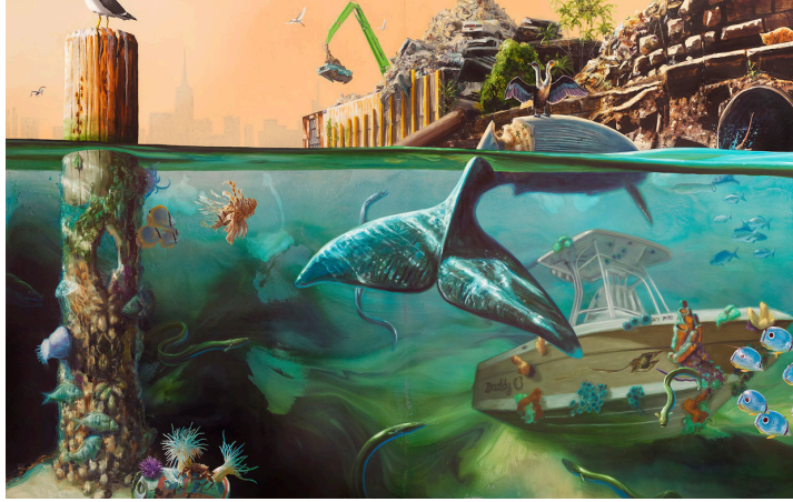
Görsel 9. Alexis Rockman, Newtown Creek , 2014, Ahşap üzerine yağlıboya, 172x42 cm, Kişisel Koleksiyon