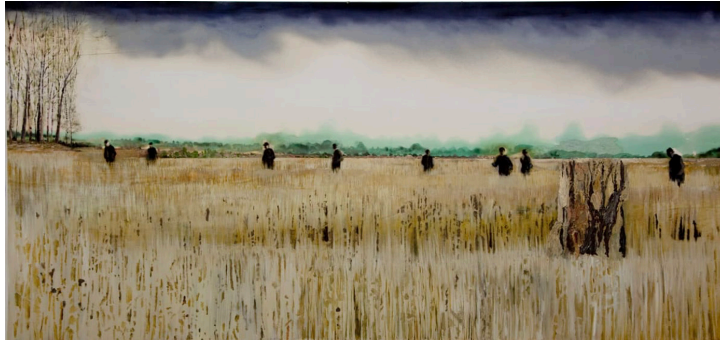
Görsel 4. Mamma Andersson, Ackerland , 2012, Tuval üzeri yağlı ve akrilik boya, 108,5x230,8 cm, Stephen Friedman Gallery

20. yüzyılda gitgide modernleşen insanın dünyadaki kaynakları gitgide tüketmesi "dünyanın sonunun ne zaman geleceği" sorusunu getirmiştir. Doğal kaynakların bir gün tükeneceği olgusu insanlığın da yıkıma uğrayacağı senaryoları aklı getirmiştir. Günümüzde çoğu insan bir gün bu çevresel yıkımın geleceğinin farkındadır ve bu tema özellikle sanatta da işlenmektedir. Özellikle 21. yüzyıl ressamları insanlığın sonu geldikten sonra dünyanın nasıl görüneceğini öngören kurgusal manzara resimleri çalışmıştır. Bu manzara resimlerinde çoğu zaman doğa insansız bir biçimde resmedilmektedir. Kimi ressamlar bu yeni dünyayı insansız sadece hayvanlarla resmederken, kimisi de harabe halinde bitkilerin etrafı