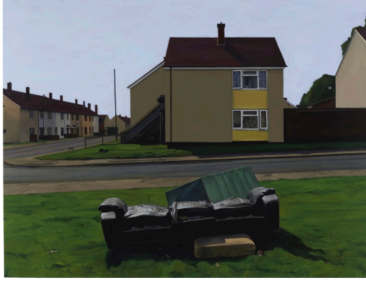
Görsel 1. George Shaw, Love and Death on a Sunny Day , 2018, Tuval üzeri yağlıboya, 92x121x3,2 cm, Anthony Wilkinson Gallery

ressamların doğadaki yücelik kavramını 21. yüzyıla göre uyarlamıştır (Görsel 2). Uzaydaki uydulardan çekilen görüntüleri dijital programlarla düzenleyerek (Photoshop) tuvale aktarmıştır. Sanatçının bu manzaraları adeta film karelerini de anımsatmaktadır. Resimler teknik olarak realist bir biçimde yapılsa da aslında renkler ve biçimler gerçeklikten çok farklıdır. Sanatçının resimleri doğanın bilinmezliğine ve ürkütücülüğüne 21. yüzyıldan bir gönderme yapmaktadır.