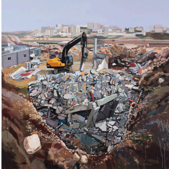
Görsel 7. Noa Charuvi, Hole , 2011, Tuval üzeri yağlı boya, 182,9x182,9 cm, Private Public Gallery

Günümüz resim sanatında doğanın bir diğer ele alınmış biçimi "bitki ressamlığı" dır. Bitki ressamlığının kökeni antik çağlara dayansa da yok olan veya yok olmaya yakın bitki türlerini resmetme olgusu 20.yüzyıla dayanmaktadır. Özel tekniklerle kurutulmuş ve preslenmiş bitki örnekleri sanatçılar tarafından bitkinin anatomisine uygun bilim insanı titizliğinde resmedilmektedir. Günümüzde bu sebeple botanik sanatının asıl amaçlarından biri bitkiyi tanımlama ve soyunun tükenmesine karşı bir nevi korumadır. Bilim insanları günümüzde iklim değişikliği sebebiyle çiçekli bitkilerin beşte birinin yok olduğunu belirtmiştir. Geride kalan bitki türlerinin ise insan ve diğer çevresel faktörlerden günden güne etkilendikleri de rapor edilmiştir (Clarke, 2016: 9). Günümüz sanatçıları bitki türlerinin yok oluşuna dikkat çekme, bu bitkilerin koruması ve gelecek kuşaklara bu bitki türlerini aktarma misyonuyla da bitki resimleri yapmışlardır. Örneğin Güney Afrikalı botanik resim sanatçısı Vicki Thomas, doğada nadir bulunan türleri resmetmektedir. Özellikle bulunduğu coğrafyadaki (Güney Afrika) bitkileri ele alan sanatçı, Afrika'daki soyu tükenen bitkilere de dikkat çekmeyi amaçlamaktadır. Vicki Thomas, Haemanthus nortieri adlı resminde soyu tükenmekte olan soğanlı bir bitkiyi en ince detayıyla resmetmiştir (Görsel 8). Günümüz sanatçılarından biri olan Alexis Rockman'ın resimlerinde doğa imgesi mutant ve genetiği değiştirilmiş türlere dayanmaktadır. Sanatçı resimlerinde özellikle farklı türlerle