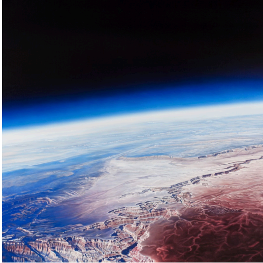
Görsel 2. Damian Loeb, Eminence Break , 2012, Tuval üzeri yağlıboya, 182,9x182,9 cm, Hall Collection

Amerikalı Sanatçı Alex Katz, Andy Warhol'un izinden giderek Pop Art'ın devamı niteliğinde "Post-Pop" akımı tarzında çalışmalar üretmiştir (Görsel 3). Post-Pop akımında günümüz tüketim kültürünün hazır imgeleri gözümüze çarpmaktadır ayrıca bu akımda kullanılan renkler daha canlı ve neon renklere yakındır. Post-Pop akımıyla yapılan resimlerdeki doğa imgeleri oldukça yapay ve gerçek görünümünden renk ve biçim olarak farklıdır. Alex Katz, büyük boyutlu doğa peyzajlarında Post-Pop akımının neon renklerini kullanmıştır. Empresyonistlerin anlık ışığı resmetmesini 21. yüzyıla uyarlayan Alex Katz, doğadaki anlık ışık değişimlerini ve görünümünü resmetmiştir. Alex Katz gibi Post-Pop akımıyla doğayı yorumlayan bir diğer sanatçı da David Hockney'dir. David Hockney, İngiliz bir sanatçıdır. Sanatçının İngiltere'den Kaliforniya'ya taşınması sanatçının renklerinde değişime yol açmıştır (Graf, 2023: 138). Sanatçı sıcak renkler kullanmış ve peyzaj yorumlarında kimi zaman doğayı modern bir yorumla resmederken kimi zaman da insanın yaşadığı mekânı boş bir şekilde (sadece su ve havuz imgesiyle) ele almıştır.