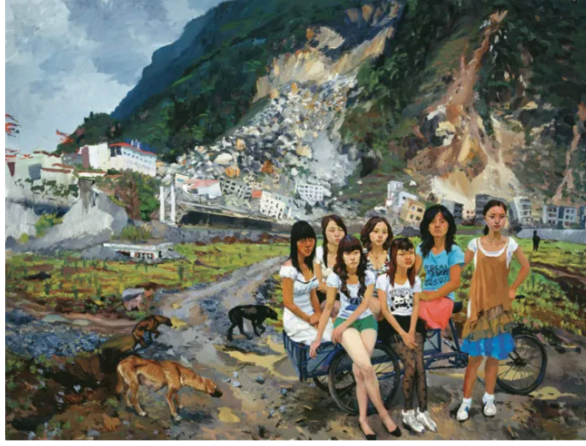
Görsel 6. Liu Xiaodong, Out of Beichuan , 2010, Tuval üzeri yağlı boya, 300x400 cm, Lisson Gallery