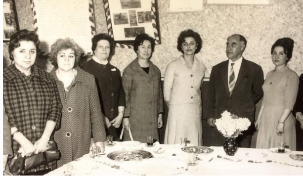
Resim 14: Şişli 19 Mayıs İlkokulu'nda Son Müzik Semineri (2 Mayıs 1962)