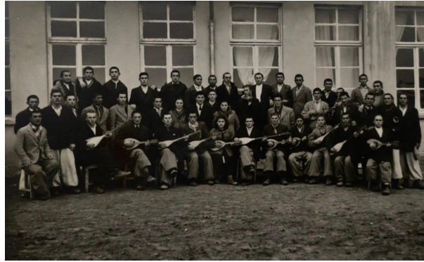
Resim 13: Göl Köy Enstitüsü Öğrencileri Enstrüman Çalarken

“Öğle ve akşam paydoslarında cumartesi ve Pazar tatillerinde müzik salonu uzaklardan yerini belli etmektedir. Müzik salonunda daha ziyade piyano, akordeon, keman çalışmaları yapılmaktadır. Bütün boş zamanlarını müzik salonunda geçiren pek çok öğrenci vardır... Gösteri ve umumî eğlence zamanları saz, mandolin, keman, akordeon v.s. âletler birleşerek orkestrayı meydana getirmekte, bunlara ayrıca yerine göre ritmi canlandırmak için def, darbuka, ziller de katılmaktadır. Davul zurna ekibi (ekibi) de bir yanda oyun havaları için sırasını beklemektedir. Enstitümüzün ayrıca 200 kişilik korusu da vardır. Bu koro kız ve erkek öğrenci arasından seçim yaparak meydana getirilmiştir.”