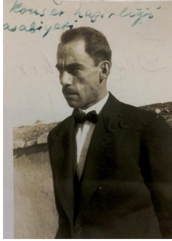
Resim 11: Diyarbakır'da Konser Öncesi (1935)