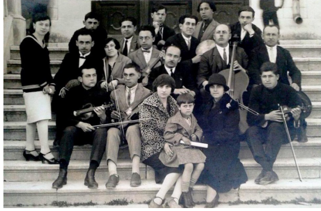
Resim 5: Rusçuk'ta Konser Öncesi

Müziğin yanı sıra resme de ilgi duymuş, Rusçuk Lisesi'nde okurken yapmış olduğu resim Sofya'da bir sergiye gönderilmiştir. Yaptığı yağlıboya tablolar okuduğu lisenin duvarlarını uzun yıllar süslemiştir. 15 Bütün bunlar göz önüne alındığında onun meslek seçiminin esasen kabiliyetlerinden kaynaklandığı anlaşılmaktadır.