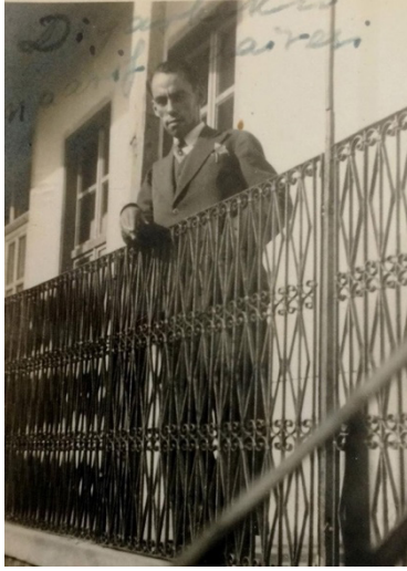
Resim 9: Diyarbakır Maarif Dairesi'nde

Bedri Akalın'ın Diyarbakır'da ilk tedrisat müfettişi olarak başlayan çalışma hayatında ayrıca Maarif Müdürlüğü'ne vekaleten baktığı da bilinmektedir. 20 Öte yandan Diyarbakır Halkevi Ar Kolumun/Şubesinin başkanlığını da yürüterek 21 bir yandan da müzik çalışmalarını sürdürmüştür.