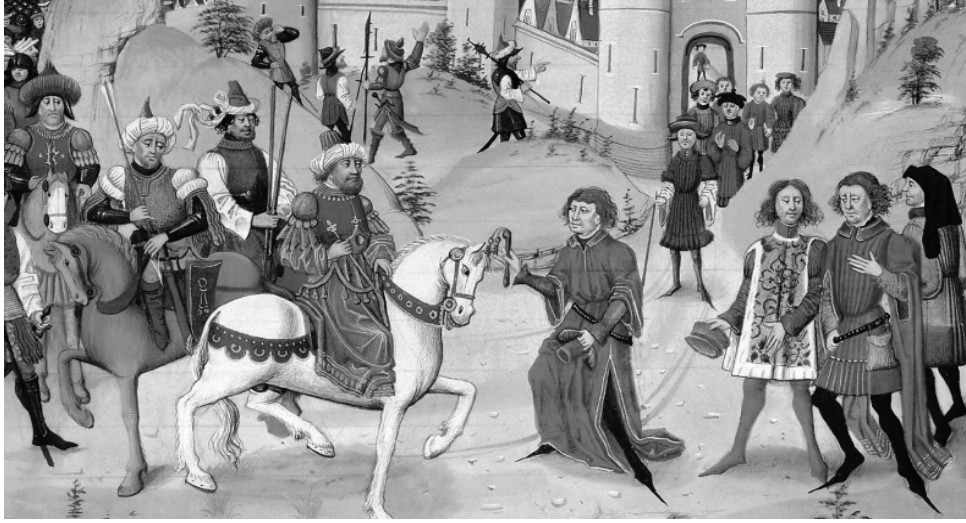
Şekil 5. Selahaddin'in 1187'de Kudüs'e girişini gösteren minyatürü. Beka Chichinadze, Saladinin Sigeli da Kartvelta Uplebebi Kristes Saplavis Tadzarshi, İstoriani, No, 5(126). Tbilisi, 2022.