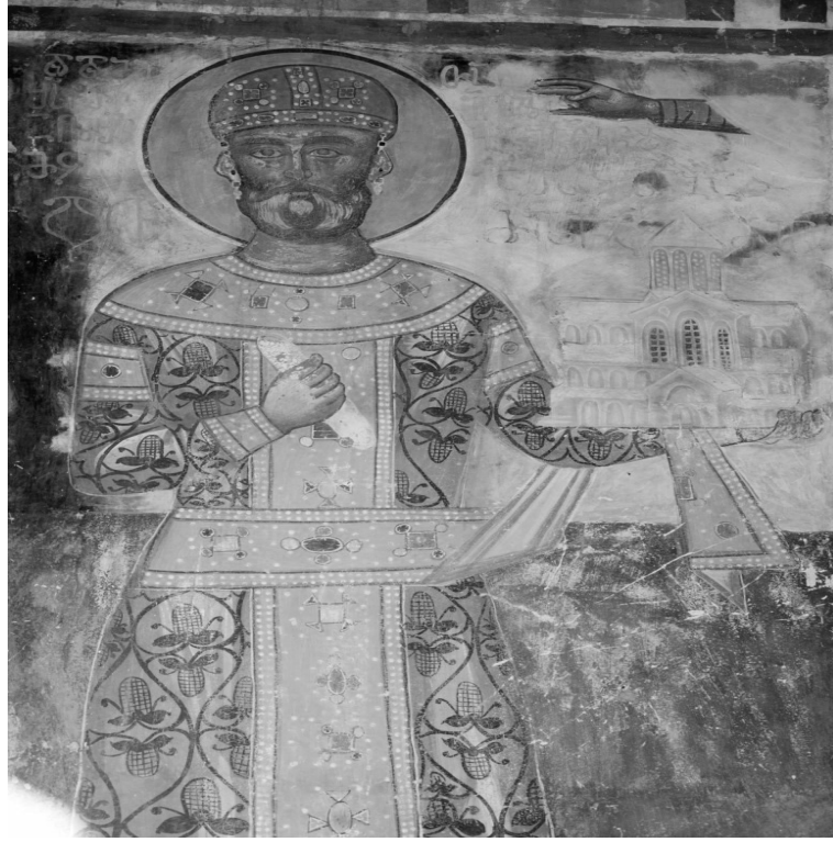
Şekil 4. Kral IV. Davit Kutaisideki, Gelati Manastır duvarındaki Freskte elinde Gelati ile resmedilmiştir.