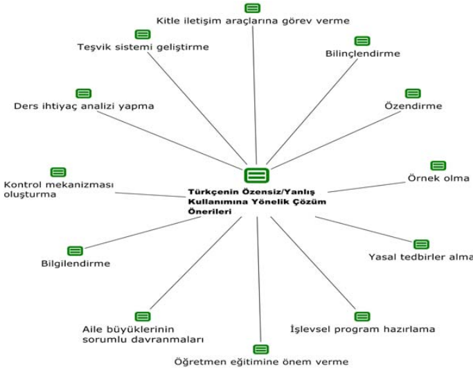
Şekil 1. Öğretmen adaylarının Türkçenin en önemli sorunlarına ilişkin çözüm önerilerinden hareketle MAXQDA 11 programı kullanılarak oluşturulan kod haritası

Görüldüğü gibi öğretmen adayları, Türkçenin en önemli sorunlarının başında 'özensiz ve yanlış kullanım'ı dile getirmişlerdir. Türkçenin en önemli sorunlarının ortadan kaldırılması için birtakım çözüm önerilerinde bulunmuşlardır. Öğretmen adayları Türkçenin en önemli sorunlarının ortadan kaldırılması için 'Türkçenin özensiz ve yanlış kullanımı', 'Yabancı sözcük kullanımı / yabancı dil tutkusu, özentisi' ve 'Öğretmen faktörü ve Türkçe öğrenimi ve öğretimindeki yetersizlik' şeklinde en çok belirtilen sorunlara yönelik olarak ortaya koydukları çözüm önerilerini yansıtmak amacıyla oluşturulan kod haritası Şekil 2'de şematik bir yapıda verilmiştir. Dile getirilen sorunları temsil etmesi açısından en fazla belirtilme sıklığı olan sorun kod haritasının merkezine konulmuştur.