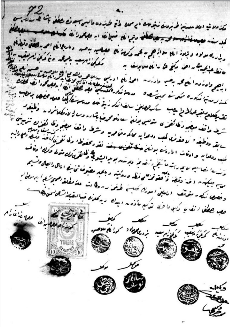
EK-3: Eyübzâde Mehmed Hamdi'nin İlk Vekâlet Hücçeti- 27 Muharrem 1316 (17 Haziran 1898), TIPKIBASIM, TŞS, 2065/251, 72 b .