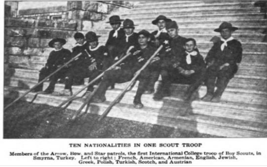
Resim 5’de, İzmir Amerikan Koleji İzci Kulübüne Üye Bir Grup Öğrenci(Missionary Herald, Vol. 110, No. 6, June 1914, s. 271).