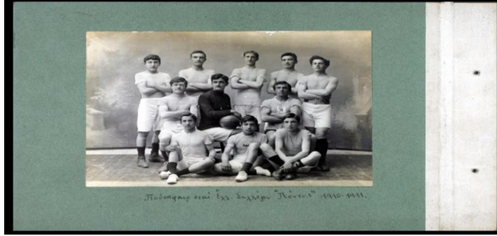
Resim: 3 Merzifon Amerikan Koleji Basketbol Takımı

Resim 3'de, Amerikan Koleji Basketbol Takımı Görülmektedir.