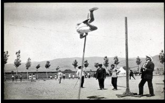
Resim 2' de kolej öğrencisi sınıkla yüksek atlama yapıyor( http://dliir.org/aba-photos-and-albums.html ).