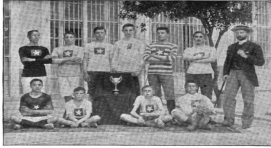
Resim 6’da, Okullar Arası Spor Müsabakaları Sonrası IC Öğrencilerinin Kazandıkları Kupa ve Okul Müdürü Alexander MacLachlan (Missionary Herald, Vol. 90, No. 9, September 1894, s. 365).