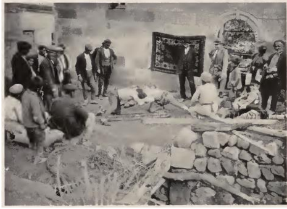
Resim: 1, Amerikan Board üyelerini eğlendirmek için Kayseri de yapılan bir güreş karşılaşması (The story of American Board in Turkey, 1936).

Amerikan Board tarafından kurulan okullarda da spor eğitimi önemli bir yer tutmuştur. Bu okullardan biriside, Merzifon Amerikan Kolejidir. Bu okulun birçok branşta takımları bulunmaktaydı. Bunlardan bazıları aşağıda verilmiştir.