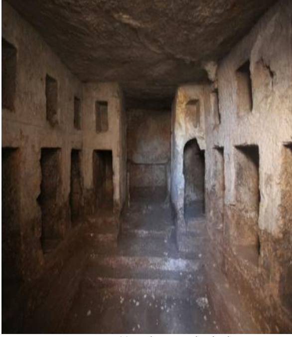
Resim 3: M-43 nolu Loculuslu kaya mezarı.