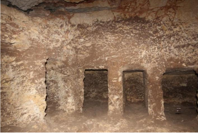
Resim 4: M-59 nolu Loculuslu kaya mezarı.