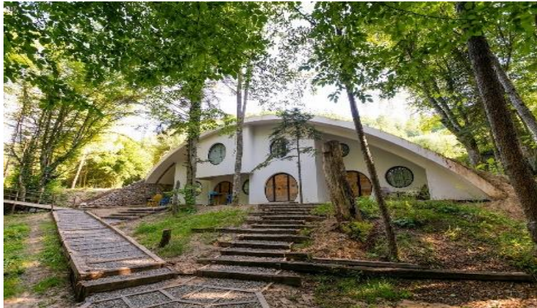
Resim 1. Hindiba Doğa Evi Pansiyon

TaTuTa, Türkiye’deki ekolojik tarımla geçinen çiftçi ailelerine mali destek, gönüllü iş gücü ve bilgi sunarak ekolojik tarımın teşvik edilmesini ve sürdürülebilirliğinin sağlanmasını hedeflemekte, alternatif bir ekolojik yaşam modeli oluşturmayı amaçlamaktadır (Şahbudak ve Şimşek, 2017, s.315). Çevresel koruma ve toplumsal dayanışma açısından önemli olup, katılımcılara doğayla bütünleşik bir deneyim sunarak gönüllülüğü teşvik etmektedir. TaTuTa’ya ev sahipliği yapan Hindiba Doğa Evi, çevre dostu konaklama alternatifi olarak sürdürülebilir turizmin örneklerindedir. Doğal çevre ile uyumlu tasarlanmış yapıları ve yenilenebilir enerji kaynaklarıyla çevresel sürdürülebilirlik ilkelerine bağlı kalmayı amaçlamaktadır.