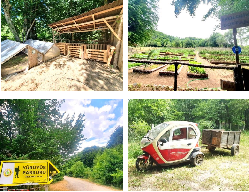
Resim 4. Hindiba Doğa Evi Pansiyon'a Ait Açık Alan Fotoğrafları