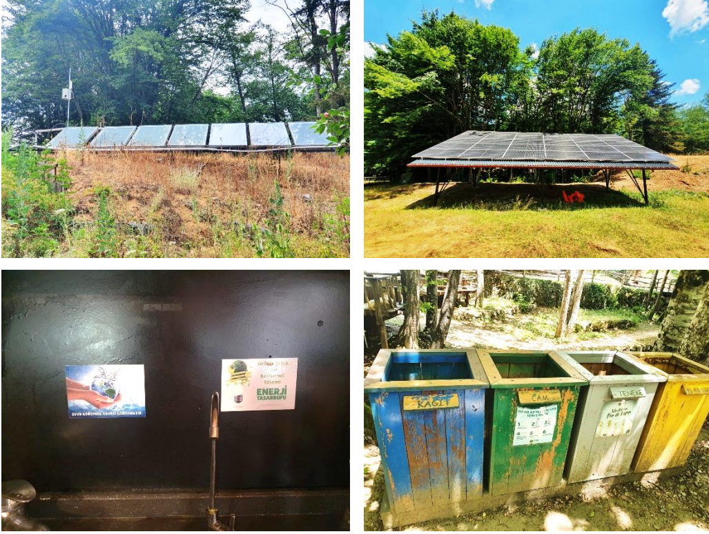
Resim 2. Hindiba Doğa Evi Pansiyon'a Ait Fotoğraflar