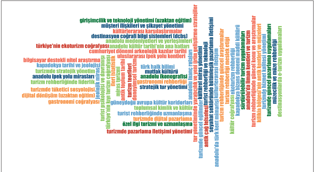
Şekil 4. Turizm Rehberliği Doktora Programı Seçmeli Dersler Kelime Kombinasyonu Analizi