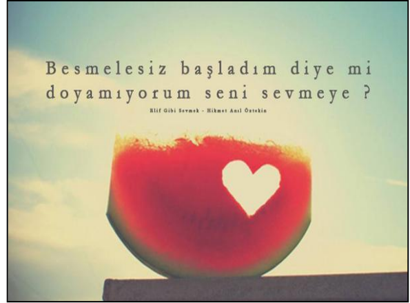
Resim 2: Bir kişisel sosyal medya hesabında paylaşılan görsel ve yazı.

verilebilir (Yavuz, 2001, s. 105) ancak buradaki örneklerin ise profanlaştırma olup olmamasından bağımsız olarak, her hâlükârda dinsel sayılabilecek formların popüler kültürle iç içe geçtiği örnekler olduğu gözlemlenmektedir. Öte yandan bu gibi kitapların ana akım kültürün satış ve dağıtım kanalları olan yerlerde satılması ve imza günleri düzenlenmesi de sıradan bir olay ve etkinlik haline gelmiştir.