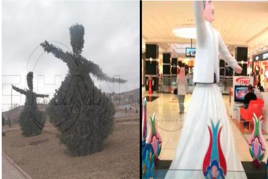
Resim 6: Semazen figürüyle budanmış ağaçlar ve alışveriş merkezinde bir semâzen figürü.

Yazılı kültürdeki bu yoğun etkinin yanı sıra popüler tasavvufçuluk görsel kültürde de yaygın bir şekilde biçimlerle karşımıza çıkmaktadır. Günümüzde adeta bir klişe olarak semâ ayini ve semazen figürü, ney ve neyzen figürü gibi görsel öğeler yukarıda anlatılan yazılı kültür öğeleriyle birbirlerini destekler mahiyette bir etki alanı oluşturmuştur. Bugün Türkiye'nin çeşitli şehirlerinde Mevlana ve Mevlevilik adı etrafında kurulan derneklerin ve vakıfların ya da yerli ve yabancı turistlere yönelik “sema gösterisi” düzenleyen işletmelerin yaptığı sema ayinleri ve benzeri faaliyetler tam anlamıyla dindışı/profan bir performans ve pop kültüre ait bir gösteriden ibarettir. Ancak tam olarak sadece turistik bir seyir faaliyeti veya kısmen dinî bir ritüel olarak algılanıp öyle alımlanması kesin çizgilerle belirlenebilecek bir şey değildir. Kesin olan durum artık tasavvuf ve Mevlevîlik dolayımıyla İslâm'a ait simge ve figürler olarak semâzen, Mevlânâ ve neyzen gibi resimlerin kayda değer bir pop kültür öğesine dönüşürken, İslâm'ın suret yasağı konusundaki keskin tavrını da esnettiğidir. Bu durum aynı anda hem dinin popüler formlar üzerindeki yaygın etkisinin ve hem de popüler kültürün dindarlık ve dinî algılar üzerindeki etkisinin göstergesidir.