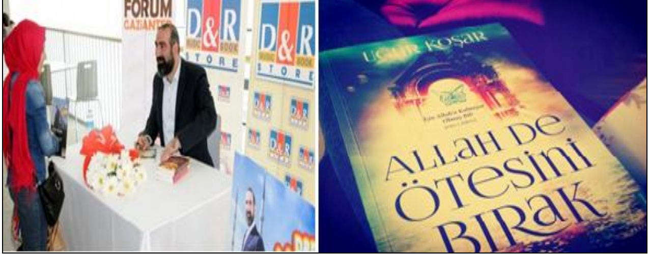
Resim 4: Allah De Ötesini Bırak Kitabı (Koşar, 2013) ve yazarının imza gününden bir fotoğraf.

Yazılı kültürde popüler tasavvufçuluğun bir başka boyutunu kurgusal metinler olan romanlar oluşturmaktadır. Bunlar arasında en çok üne kavuşan ve edebî bir popüler kültür ürünü olarak Türk edebiyatında en kısa zamanda en çok satışı yapma anlamında büyük bir başarı getiren Elif Şafak'ın Aşk adlı romanı olmuştur. Bu roman sadece Türkiye'de değil dünya kitap piyasasında da Forty Rules of Love (Aşkın Kırk Kuralı) başlığıyla satışa çıkmış ve önemli bir popülerlik kazanmıştır.