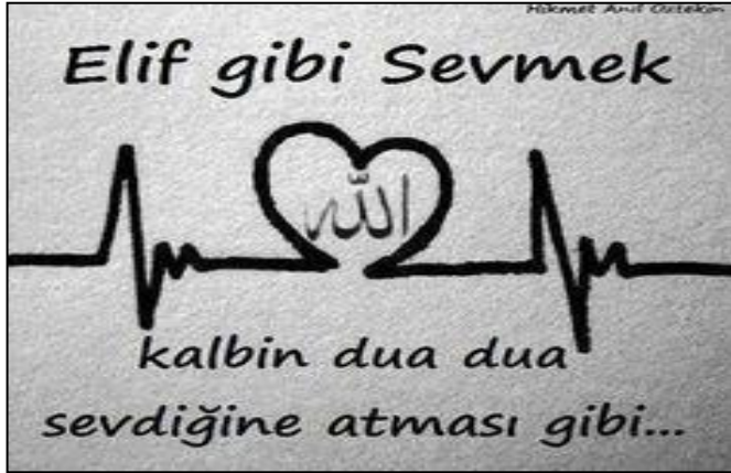
Resim 3: Bir kişisel sosyal medya hesabında paylaşılan görsel ve yazı.

Paylaşımın görselinde de yine dini ve gündelik unsurlar bir arada sunulmuştur. Örneğin Arapça Allah yazısı kalp şekli içerisinde sunulmuştur ve bu da kalp atışı grafiği üzerine yerleştirilmiştir. Bu gibi örnekler kutsalın profanlaştırıldığı veya “desacralization” içeren örnekler olarak görülüp görülmeyeceği tartışma konusudur. Bir profanlaştırma örneği olarak Kur’an ayetlerinin saz ile türkü gibi çalınıp söylenmesi