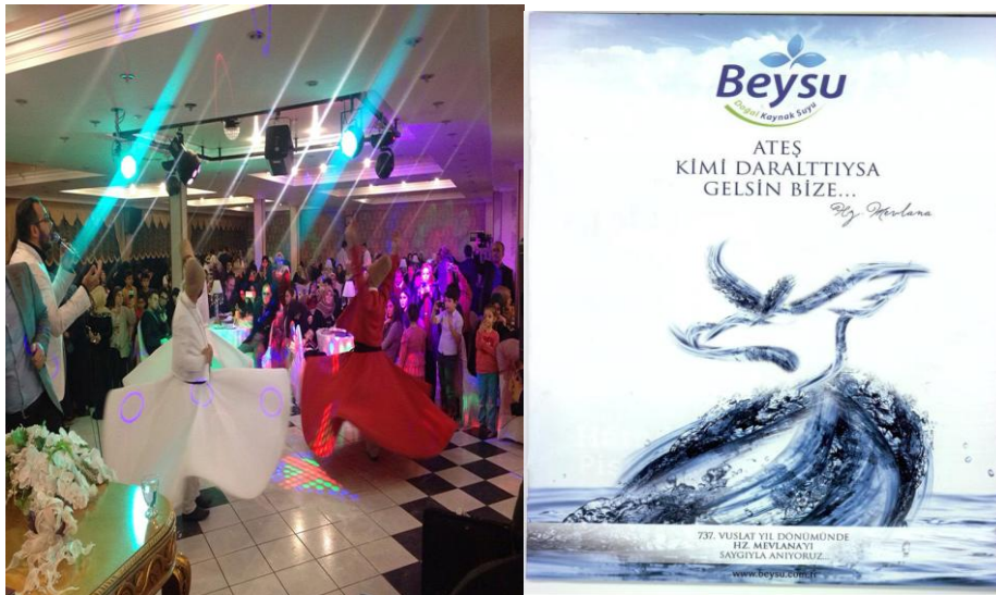
Resim 7: Düğünde semâ eden semâzenler ve bir su firmasının semâzen figürlü reklamı.