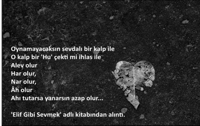
Resim 1: Bir kişisel medya hesabında paylaşılan pasaj.

yerine izleyici kitlesi de diyebiliriz çünkü bu kitaplar yeni medyada görselleştirilmiş metinler oluşturularak paylaşılan, adlarına gruplar veya kişisel bloglar oluşturulan yaygın ve sürekli bir ilginin konusu haline gelmiştir. Dolayısıyla söz konusu kitle sadece okurlardan değil medya kullanıcıları ve izleyicilerinden oluşmaktadır. Bu durum kişilerin medya hesapları aracılığıyla benzer gruplardan diğer kişilerle farklı bir ağ ve adeta yeni bir gemeinschaft oluşturduğu bir etki oluşturmuştur (Lugano, 2010, s. 74).