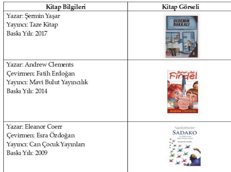
Şekil 2. İnceleme nesnesi

Şekil 2, çocuk edebiyatına ait üç eserin bilgilerini ve görsellerini içermektedir. İlk eser Şermin Yaşar tarafından yazılan Dedemin Bakkalı adlı kitaptır. Taze Kitap tarafından yayımlanmış ve 2017