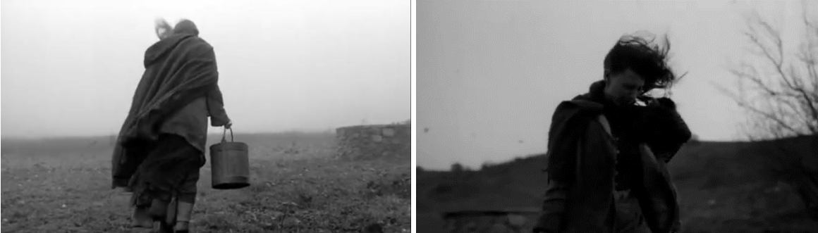
Görsel 6 ve Görsel 7 - Rüzgârın şiddeti.

Film boyunca karakterlerin gündelik yaşamını olumsuz etkileyen en büyük güç rüzgârdır. Tarr, yıkımın inşasını tasvir etmek için rüzgârın yıkıcı gücüne başvurmuştur. Bu yıkıcı güç anlatımı, rüzgâr ve uğultu sesiyle sağlanmaktadır. Rüzgâr sesi bulunulan ortamın kaotikliğini, başka bir deyişle sona yaklaşma halini temsil etmektedir. Köse ve Alanka (2014)'ya göre tükeniş, rüzgârın hiç dinmeyen uğultusunun yarattığı görsel burgaçların canlılığında hissedilir ve bir çaresizliğe dönüşür. Rüzgârın bir anlatı biçimi olarak inşası Görsel 6 ve 7'de görülebilir.