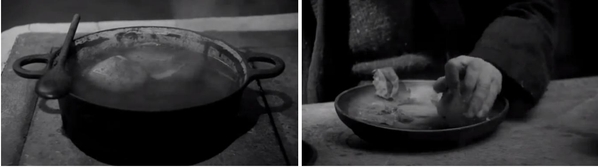
Görsel 2 ve Görsel 3 - Detay plan çekimleri.

yaratmaktadır. Bu anlamda, patatesin dâhil olduğu küme, söz konusu sahnenin değişken parçası olmaktadır.