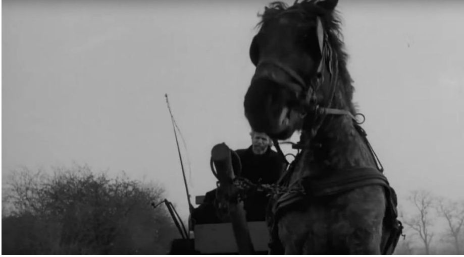
Görsel 8 - Alt açı kullanımı.

konusu plan sekansı izlerken, sahnenin uzunluğunu aşarak kendi içsel zamanında yolculuğa çıkmaktadır, at imgesini kendi belleğine yerleştirmektedir. Dolayısıyla ne tam anlamıyla ampirik ne tam anlamıyla aşkınsal bir deneyimin içinden geçmektedir. Seyirci bir anlamda atın kendinde olan halini sezmektedir. Bela Tarr, bu uzun plan sekansa atın zayıflığını, güçsüzlüğünü yaklaşan sonun habercisi olarak sunmuştur. Alt açı ve yakın plan kullanımı arka plandaki kaotik müzikle ilişkilendirilmiştir. Başka bir deyişle, görsel-işitsel öğeler iç içe geçmiş durumdadır.