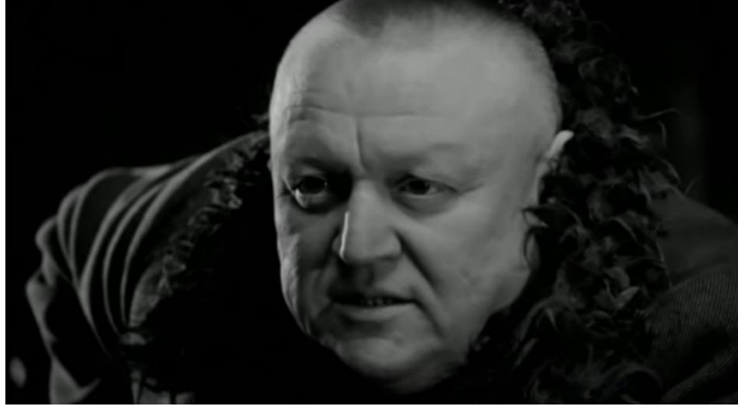
Görsel 14 - Monolog.

Kısacası Tarr, yarattığı zaman-imgeyle bir mesaj verme gayesinden çok bir görme ve duyumsama biçimi yaratmak istemiştir.