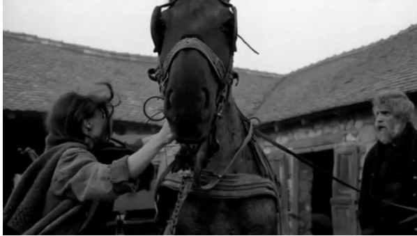
Görsel 11 - Birbirine bağlı üç karakter.

Filmdeki üç karakter (at, baba ve kız) birbirine bağlıdır, biri olmadan diğeri yaşayamamaktadır. Öte yandan at hareketsizliğini korumaktadır. Bu ısrar karşısında baba ve kız atın yularını çözer. Bu noktada izleyici, baba ve kızın yaşamla kurduğu organik bağın zayıfladığını sezmektedir. Bu sahnede filmin dramatik etkisi yükselir. At, hareketsizlik ısrarı ile deneyimin koşulunu kendisi belirlemektedir. Atın inadında ısrarcı olması, kendi imgesini yaratmasına yardımcı olur. Gösterdiği ısrar sonucunda özgürlüğüne kavuşmuştur. Filmde, atın hareketsizlik ısrarı belli bir nedene doğrudan bağlanmamıştır. Seyirci dış ses aracılığıyla öğrendiği hikâyeden yola çıkarak bu ısrarı anlamlandırabilmektedir. Dahası, filmin bitişiyle de kesin bir cevaba ulaşamamaktadır. Dolayısıyla at imgesi filmin başından sonuna kadar, hatta sonundan sonra da seyircinin anlam dünyasında kalmaktadır. Zaman imge bu şekilde pekişmektedir.