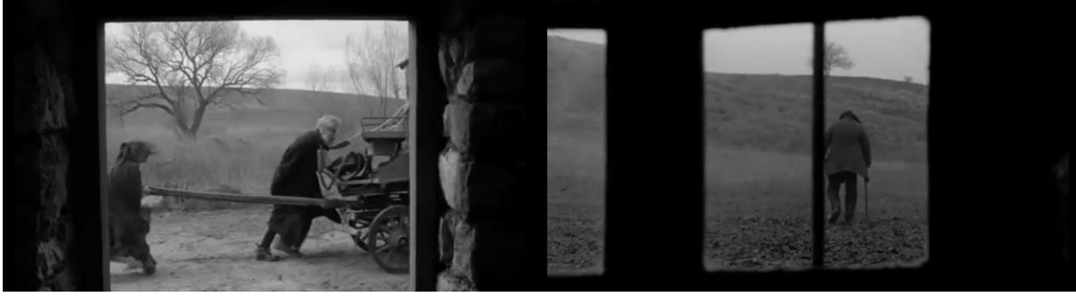
Görsel 4 ve Görsel 5 - Çerçeve içinde çerçeve kullanımı.

Film boyunca karakterlerin gündelik yaşamını olumsuz etkileyen en büyük güç rüzgârdır. Tarr, yıkımın inşasını tasvir etmek için rüzgârın yıkıcı gücüne başvurmuştur. Bu yıkıcı güç anlatımı, rüzgâr ve uğultu sesiyle sağlanmaktadır. Rüzgâr sesi bulunulan ortamın kaotikliğini, başka bir deyişle sona yaklaşma halini temsil etmektedir. Köse ve Alanka (2014)'ya göre tükeniş, rüzgârın hiç dinmeyen uğultusunun yarattığı görsel burgaçların canlılığında hissedilir ve bir çaresizliğe dönüşür. Rüzgârın bir anlatı biçimi olarak inşası Görsel 6 ve 7'de görülebilir.