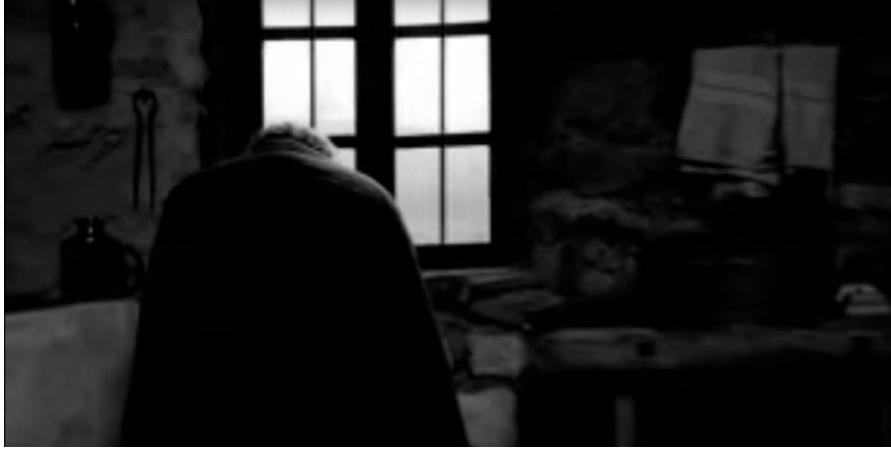
Görsel 9 - Yaklaşan sonun tanığı.

yaşamı besleyen yenileyici ateş sönmüş, ocaktaki son köz parçası tükenmiştir. Yaklaşan sona tanıklık etmek, karakterlerin tek seçenekleridir.