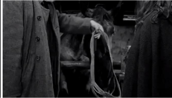
Görsel 12 - Atın yularının çözülmesi.