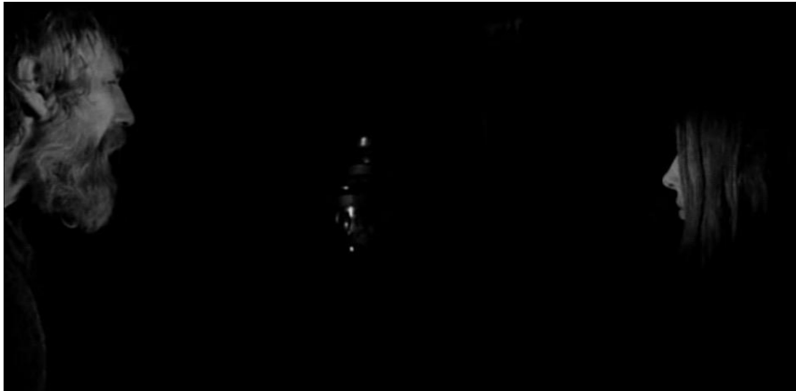
Görsel 10 - “Bu karanlık neden?”

Evrenin mutlak düzensizliğe doğru gidişi, fener imgesi üzerinden de kurulmuştur. Kulübedeki fener, yakıt dolu olmasına rağmen yanmamaktadır. Kızın babasına yönelttiği “bu karanlık neden” sorusu cevapsız olarak kalmıştır. Kısacası filmde yaratılan evren maksimum düzensizliğe doğru gitmektedir. Başka bir deyişle, filmin geçtiği çorak Macar ovasında Entropi artmaktadır. Seyirci, üretilen zaman-imgeler aracılığıyla kaosu sezmektedir.