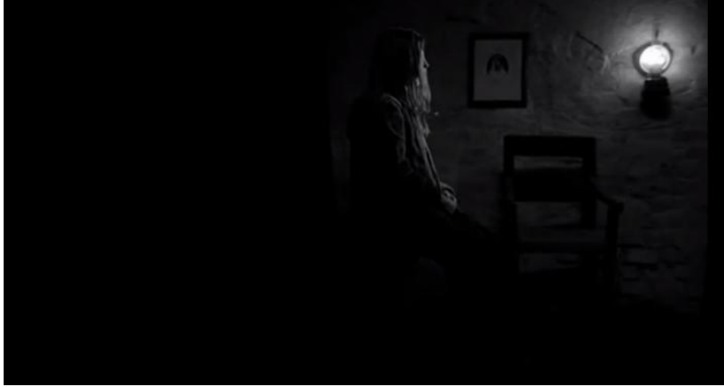
Görsel 13 - Işık kullanımı.

bilincini ve hareket yeteneklerini kısıtlamaktadır. Işığın sönmesi, hareketlerin asgari düzeye çekilmesiyle ve yaşamla kurulan bağın zayıflamasıyla ilişkilendirilmiştir.