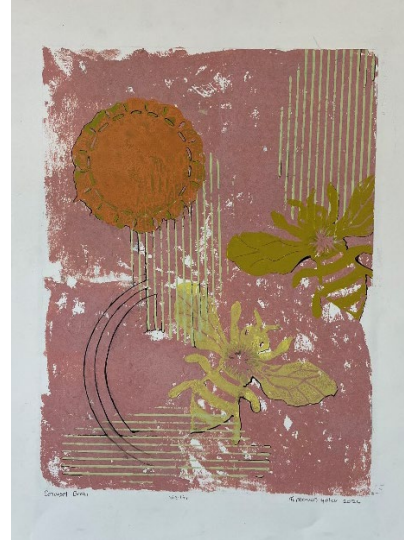
Görsel 12, 13. Öğrenci Deneysel Baskiresim Çalışmaları