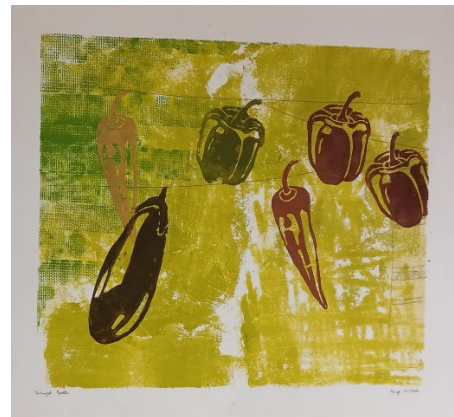
Görsel 16, 17. Öğrenci Deneysel Baskiresim Çalışmaları