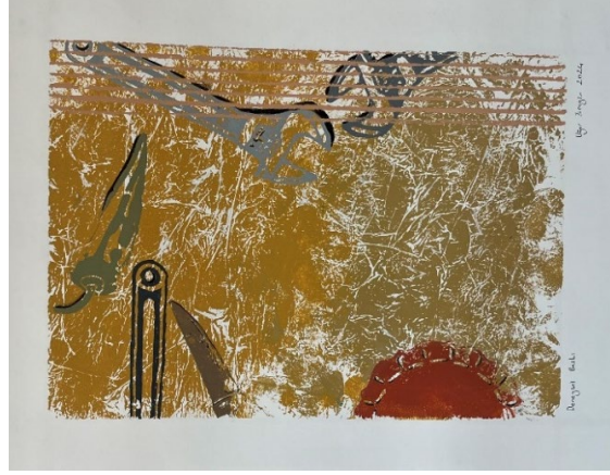
Görsel 8, 9. Öğrenci Deneysel Baskıresim Çalışmaları