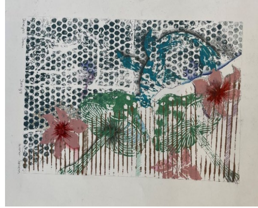
Görsel 14, 15. Öğrenci Deneysel Baskiresim Çalışmaları