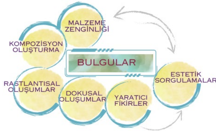
Şekil 2. Bulgular

Araştırmada elde edilen veri analizi neticesinde bazı bulgulara ulaşılmıştır. Bu bulgular, Rastlantısal Oluşumlar, Malzeme Zenginliği, Kompozisyon Oluşturma gibi üç ana başlık ve alt başlıklardan oluşmaktadır.