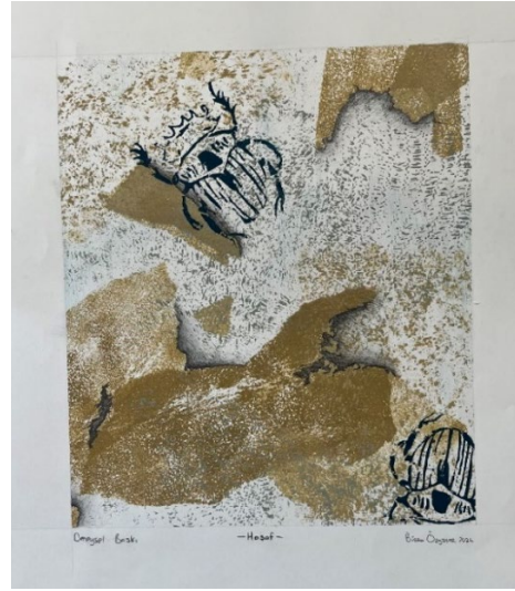
Görsel 10, 11. Öğrenci Deneysel Baskıresim Çalışmaları