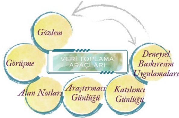
Şekil 1. Veri Toplama Araçları

Nitel araştırma desenlerinden biri olan eylem araştırmasında veri toplama araçları sözel ve uygulamaya yönelik verilerden oluşmaktadır. Bu veri seti; gözlem, görüşme, alan notları, araştırmacı günlüğü, katılımcı günlüğü ve deneysel baskiresim uygulamalarından oluşmaktadır.