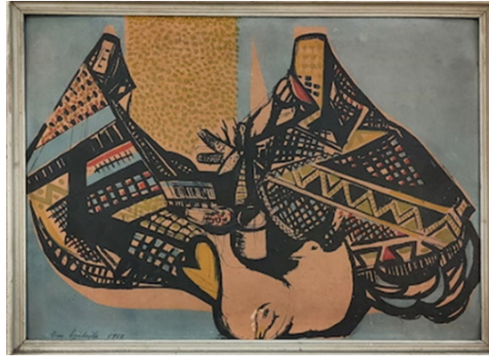
Görsel 5: Eren Eyüboğlu, Figürlü Kompozisyon , Kağıt Üzerine Çini Mürekkebi, 30 x 40 cm, 1953.

kaynak olduğunu vurgulamış ve çağdaş resim ile arasında kurduğu bağı çalışmalarına yansıtmıştır (Aydoğan, 2017: 67). Eyüboğlu "İstanbul" isimli resminde, geleneksel sanatlarda görülebilecek motifler ve bu motiflerle uyumlu diğer unsurlar ile oluşturduğu İstanbul görüntüsünü, minyatür mantığıyla kompoze edip resim yüzeyine aktarmıştır (Görsel 3). Bu kompozisyon düzeni içerisinde, Türk sanatlarında görülebilecek geometrik motifler ve balık gibi hayvan motiflerini kullanmıştır. Sanatçı Görsel 4'te yer alan resminde ise, tekstil işlemleri, halı dokumacılığı, nakışlar, ahşap oymacılığı, mimari süslemeler vb. sanatlarda görülebilecek "hayat ağacı" motifini stilize ederek yansıtmıştır. Bu motifte ağacın gövdesini bir kadın formu oluşturmaktadır. Bu kadın motifinin yanlarından ve üst kısmından, bitki yapısını yansıtan, geometrik olarak stilize edilmiş dal formları resmedilmiştir.