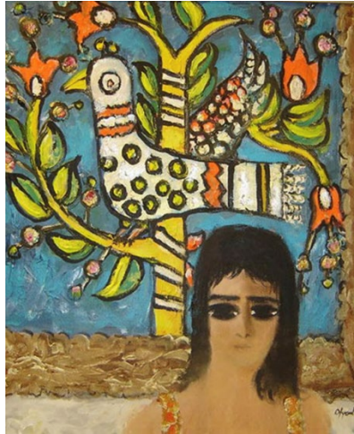
Görsel 1: Fikret Otyam, İsimsiz, Tuval Üzerine Yağlıboya, 60 X 50 cm, Tarih Bilinmiyor.

Fikret Otyam’ın resimlerinde, ağırlıklı olarak kadınların yer aldığı köylüler, yöreyi yansıtan ve beraberinde halk sanatının içinde var olan unsurlar ve bu unsurlara ait motifler görülmektedir. Sanatçı resimlerinde yer alan figürleri, yaşadıkları bölgeyi yansıtan doğa görüntüsü içinde ya da geleneksel unsurların yansıtıldığı iç mekân görüntüsü içinde geleneksel giysiler ile resmetmiştir (Yılmaz, Küçükşahin, 2017:167). Otyam Görsel 1’de yer alan resminde, bir duvar halısı ya da çerçeveli bir resmin önünde izleyiciye doğrudan bakan bir kadın figürü resmetmiştir. Sanatçı bu resimde, diğer resimlerinin aksine kadın figürünü modern bir giysi içinde yansıtmıştır. Kadın figürünün arkasında yer alan pano ya da duvar halısı üzerinde, geleneksel Türk sanatlarında