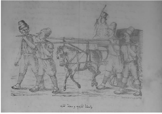
Vasıta-i nakliyeye vasıta-i nakliye

Hayal, gazetecilik ve devletin maliyesindeki aksaklıklar dışında, sokakların temizliği, tramvay arabacılarının aylıklarını alamamaları, vasıtalarındaki aksaklıklar, İstanbul’da atlı tramvay imtiyazı alan yabancı şirketin usulsüzlükleri gibi sorunlardan da bahsederek yönetimi bu yol ile eleştirmekten de geri durmamıştır. Hayal, dönemin en önemli sosyal sorunlarından olan taşımacılıkta yaşanan aksaklıkları çeşitli sayılarında yayımladığı karikatürlere yansıtmış hala nakil vasıtası sıkıntısının çözülmediğini ifade etmeye çalışmıştır. 115