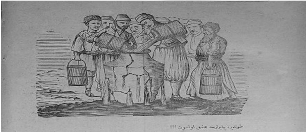
Doldurabilirlerse aşk olsun !!!

Hayal sorgusuz kapatılma cezaları karşısında uğradığı haksızlıkların giderilmesi, matbuatla ilgili kanun beklentisi, pul zorunluluğunun ve Âli Kararname'nin kaldırılması gibi taleplerini Matbuat İdaresi'ne iletmiştir. Ancak bu kez eleştirinin şiddetini biraz daha arttırarak, bir daha kapatılma ile alakalı bir yazı gönderilmesini istemediğini ve gerekirse açıkça mahkeme edilmek istediğini dile getirmiştir. 121 Hayal bu taleplerinin karşılığını bulamadan 7. kez 301. sayısında yayımladığı "devletin şanına dokunur bir karikatür" sebebiyle 3 ay süre ile kapatılır. 122