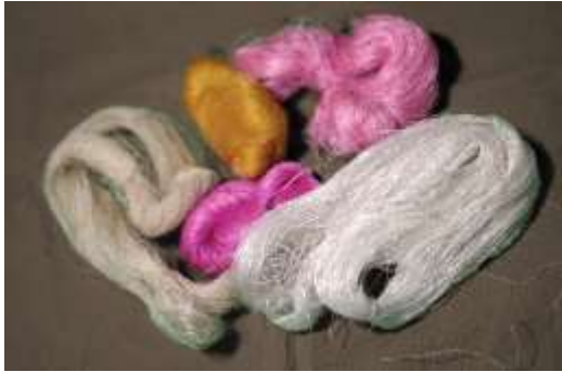
Şekil 28. İpek iplik örnekleri

Kirman: Anadolu’da yaygın olarak kirmen/kirman adıyla bilinen, ip eğirmek için kullanılan bir araçtır (Temur 2020, s.29). Eskiden Mudurnu’da yün çoraplar yaygın bir şekilde üretilmekte ve yün eğirmek için bu araç kullanılmaktaydı (Mudurnu Belediyesi, 2023). Katılımcıların yaparak yaşayarak öğrenmelerini sağlayacak bir eğitim etkinliği olan “kirmen ve yün eğirme” uygulamasında kullanılmak üzere, gezici bavul müze koleksiyonuna bir adet kirmen eklenmiştir (bkz. şekil 30).