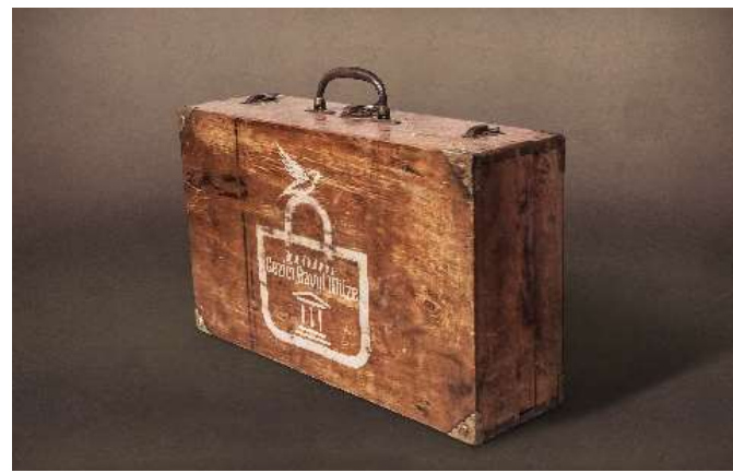
Şekil 31. ve 32. Gezici Bavul Müze'nin amblemi