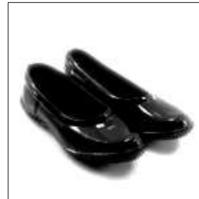
Şekil 27. Kara lastik