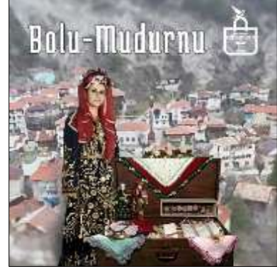
Şekil 6. Branda afişi

Tanıtım bandı: İki adet, 85cmx200cm ebatlarında, alüminyum malzemeden üretilmiş, portatif taşıma çantalı tanıtım bandı bulunmaktadır. Tanıtım bantları, “Bolu Müzesi” ve “Mudurnu’nun geleneksel kadın giyim kültürü” hakkında bilgi ve fotoğraflar içerir. Eğitim etkinlikleri sırasında katılımcılara bu konular hakkında genel bilgi sunmak amacıyla hazırlanmıştır (bkz. şekil 7).