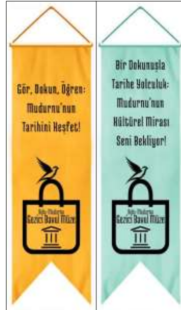
Şekil 8. Kırlangıç afişi

Kırlangıç afişi: 50cm x 150cm ebatlarındaki kırlangıç afiş, Gezici Bavul Müze’nin taşındığı mekanların kapısına asılmak üzere tasarlanmıştır. Afiş, “Bir Dokunuşla Tarihe Yolculuk: Mudurnu’nun Mirasını Seni Bekliyor!” ve “Gör, Dokun, Öğren, Mudurnu’nun Tarihini Keşfet!” sloganlarını içerir. Hem etkinlik katılımcılarını bilgilendirmek hem de müzenin tanıtımını yapmak amacıyla kullanılır (bkz. şekil 8).