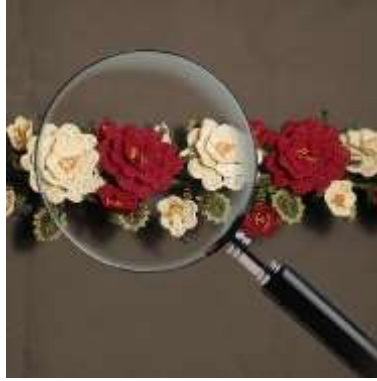
Şekil 10. Büyüteç