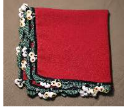
Şekil 19. Oyalyı krep örtü

İğne oyasından gelin tacı: Mudurnu’da kına gecelerinde bindallı ve üç etek giymiş kadınlar, iğne oyasından yapılmış gelin tacı takarlar. Gül dalı şeklinde tasarlanan bu taç, gerçek yaban güllerinden esinlenerek yapılmıştır ve çeşitli renklerdeki ipek ipliklerle süslenmiştir (Özdemir vd., 2011, s.133; Mudurnu Belediyesi, 2023). Gezici Bavul Müze koleksiyonuna iki adet iğne oyasından gelin tacı dahil edilmiştir (bkz. şekil 20, 21).