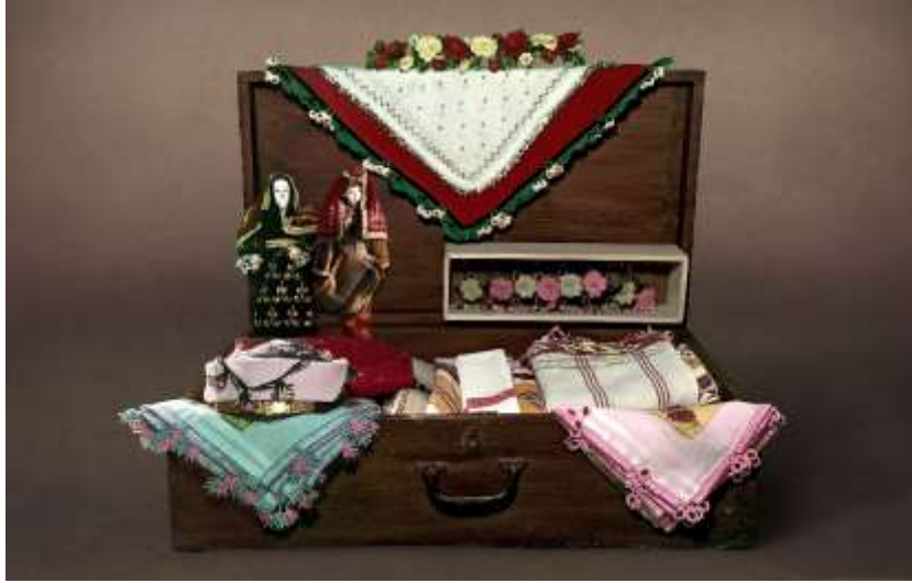
Şekil 33. Gezici Bavul Müze

Yönetim Kurallarının Belirlenmesi: Gezici Bavul Müze'nin tasarım ve uygulama süreci; koleksiyon nesnelerinin seçimi, eğitim etkinliklerinin planlanması, bavul seçimi, görsel ve işitsel materyallerin tasarımı, yasal işlemlerin sağlanması, ulaşım organizasyonu ve mali kaynak temini gibi aşamaları kapsar. Bu süreçlerin yönetimi küratörün sorumluluğundadır.