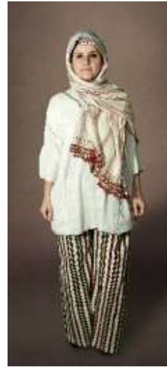
Şekil 25. Don ve göynek

Yün çorap: Bolu’nun ilçe ve köylerinde, kış aylarında kullanılan yün ve tiftik ipliklerden beş şiş ile örülen çoraplar, çeşitli renk ve motiflerle süslenmektedir (Özdemir vd., 2011, s.141). Gezici Bavul Müze koleksiyonuna iki çift “yün çorap” dahil edilmiştir (bkz. şekil 26).