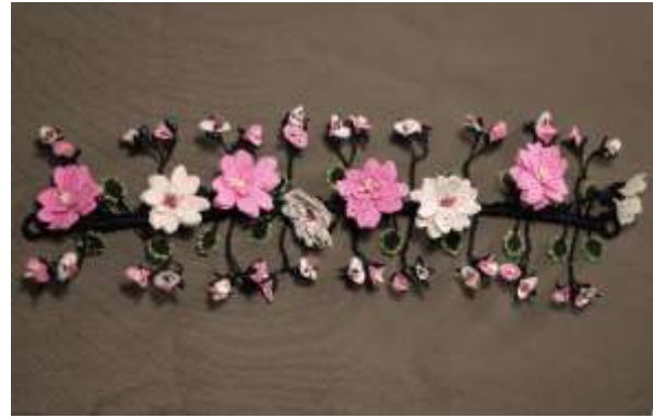
Şekil 20. ve 21. İğne oyasından gelin tacı

Fes: Mudurnu’da kırmızı keçe kumaşlardan yapılan fes, geleneksel üçetek ve bindallı elbiselerle birlikte kullanılır. Fesin tepe kısmı floş iplikle kaplanmış olup, arka kısmı başa uyum sağlar. Alın kısmında küçük sarı altınlar yer alır ve içi kartonla sertleştirilmiştir (Özdemir vd., 2011, s.131). Gezici Bavul Müze koleksiyonuna iki adet “fes” dahil edilmiştir (bkz. şekil 22, 23).