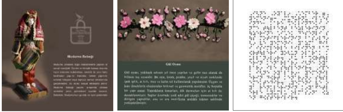
Şekil 1., 2. ve 3. Bilgi kartı örnekleri

Bilgi kartları: Eğitim etkinliklerinde kullanılmak üzere üç farklı grupta bilgi kartları hazırlanmıştır. Birinci grupta, Gezici Bavul Müze’de yer alan kültürel nesnelere ilişkin on yedi adet bilgi kartı bulunmaktadır (bkz. şekil 1). İkinci grupta, Mudurnu iğne oyalarının motiflerine ilişkin on bir bilgi kartı yer almaktadır (bkz. şekil 2). Üçüncü grupta ise, diğer iki grupta yer alan kartların, görme engelli katılımcılar için hazırlanmış Braille alfabesi ile oluşturulmuş yirmi sekiz adet versiyonu vardır (bkz. şekil 3). Bu kartlarda kültürel nesnelere hakkında önemli bilgiler ve fotoğraflar yer almakta olup, okunabilirliği artırmak adına kaynak gösterimi belirtilmemiştir. Kartlar 15cmx15cm boyutlarında ve PVC kaplamalıdır.”