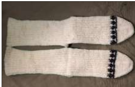
Şekil 26. Yün çorap

Kara lastik: Kara lastik ayakkabılar, eski zamanlarda çarık ve yemeni yerine kullanılmaya başlanmış ve özellikle kırsal bölgelerde, tarım ve hayvancılıkla uğraşanlar tarafından tercih edilmiştir. Basit bir tasarıma sahip olup, bağcık ve dikiş içermezler; üzerlerinde bazen kabartmalar bulunabilir (Özdemir vd., 2011, s.30). Gezici Bavul Müze koleksiyonuna bir çift “kara lastik ayakkabı” dahil edilmiştir (bkz. şekil 27).