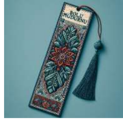
Şekil 11. Anmalık ayraç

Karekod uygulaması ile video içerikleri: Gezici Bavul Müze'nin içinde yer alan karekod uygulaması, ziyaretçilere Bolu ilinin Mudurnu ilçesi ve Bolu Müzesi hakkında videolar izleme imkânı sunar. Karekod, hızlı ve kolay bilgi erişimi sağlayan bir teknolojidir. Ziyaretçiler, akıllı telefonlarıyla karekodu tarayarak ilgili videolara anında ulaşabilirler. Bu uygulamanın kullanılmasıyla Gezici Bavul Müze eğitim etkinliklerine katkı sağlamak hedeflenmiştir. Çünkü görsel ve işitsel dijital içerikler, ziyaretçilerin ilgisini çekerek öğrenme sürecini daha etkili hale getirebilir. Böylece, katılımcılar Bolu'nun kültürel mirasını daha derinlemesine keşfetme fırsatı bulurlar. Gezici Bavul Müze'ye dahil edilen karekod uygulamaları, iki video içermektedir: biri Mudurnu ilçesini tanıtan, diğeri ise Bolu Müzesi'ni tanıtan videodur (bkz. şekil 12, 13).