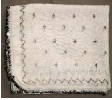
Şekil 17. Hamam örtüsü