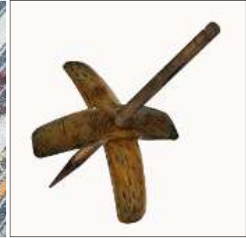
Şekil 30. Kirman

Bavul, Kutu ya da Çantaların Seçimi ve Tasarımı: Gezici Bavul Müze'nin tasarımında, koleksiyon ve eğitim etkinliklerinde kullanılacak nesnelere korunması amacıyla antika ahşap bavullar tercih edilmiştir. Bu bavullar, estetik ve işlevsel ihtiyaçları karşılayacak şekilde dikkatle seçilmiş ve nesnelere güvenli taşınması için gerekli önlemler alınmıştır. İçlerine köpük plakalar yerleştirilmiş ve düzenlemeyi kolaylaştırmak için iç düzen fotoğrafı eklenmiştir. Bavulların üzerine Gezici Bavul Müze'nin amblemi basılmıştır (bkz. şekil 31, 32, 33).