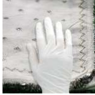
Şekil 34. Tek Kullanımlık Eldiven.