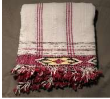
Şekil 18. Tokalı örtü