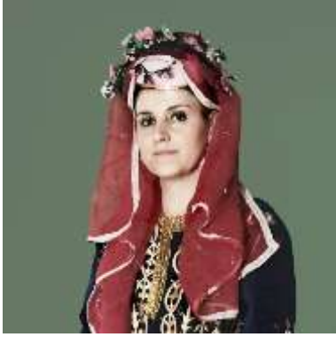
Şekil 9. Kostüm

Anmalık: Gezici Bavul Müze eğitim etkinlikleri bitiminde katılımcılara hediye edilmek üzere, Mudurnu yöresi geleneksel kadın giyim kültürünü yansıtan ve günün anısını taşıyan kitap ayraçları hazırlanmıştır (bkz. şekil 11).