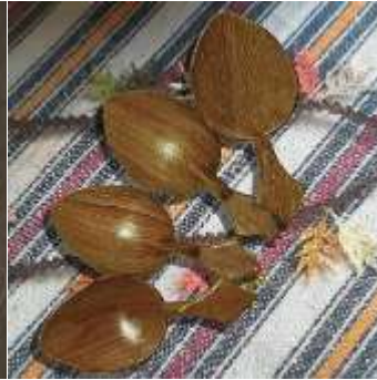
Şekil 29. Tahta kaşık