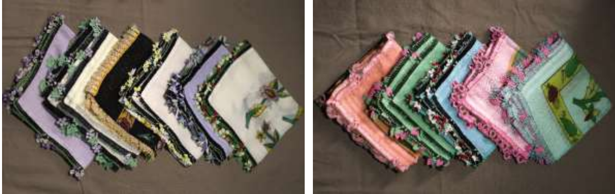
Şekil 15. ve 16. İğne oyalı çember

İğne oyalı çember (yemeni): Mudurnu’da kare şeklindeki ince tülbeht bezleri, çiçek desenli süs motifleriyle “yemeni, yazma” olarak bilinir ve kenarları iğne oyalarıyla süslenir. Renkler, kıyafetlerle uyumlu olacak şekilde seçilir. Kadınların çeyizlerinde bulunan bu başörtüleri, gelecek nesillere hatıra olarak aktarılır ve her kadın bunları oğluna veya kızına devreder. Mudurnu’da hemen her kadının sandığında eski çemberler bulunur. Bu el emeği ürünler, Mudurnu kültüründe önemli bir yere sahiptir ve özenle korunur (Özdemir vd., 2011, s.135; Mudurnu Belediyesi, 2023). Gezici Bavul Müze koleksiyonunda on bir adet “iğne oyalı çember” bulunmaktadır (bkz. şekil 15, 16).