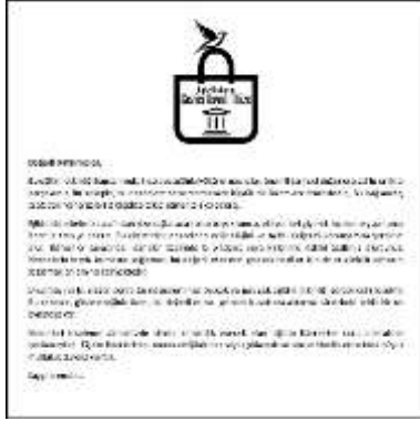
Şekil 4. Yönerge