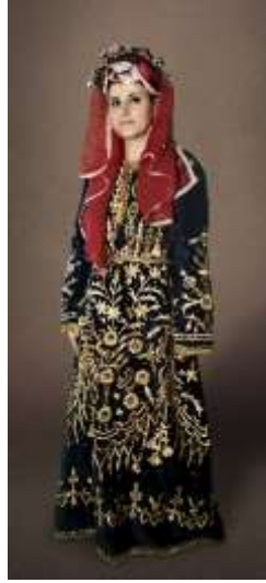
Şekil 24. Pullu al ve bindallı

Göynek: Mudurnu yöresinde, üç etek ve bindallı gibi kıyafetlerin altında ince ipek göynekler kullanılırdı. Günlük yaşamda ise pamuklu kumaşlardan yapılmış, beyaz veya renkli çizgili göynekler tercih edilmiştir. Bu göyneklerin yaka ve kol kenarları iğne oyalarıyla süslenmiştir (Yıldız vd., 2018, s.524; Özdemir vd., 2011, s.136). Gezici Bavul Müze koleksiyonuna bir adet el dokuması “göynek” dahil edilmiştir (bkz. şekil 25).