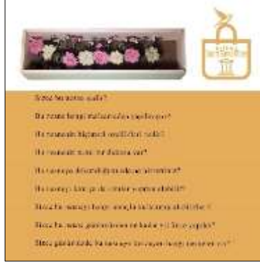
Şekil 5. Etkinlik sayfası