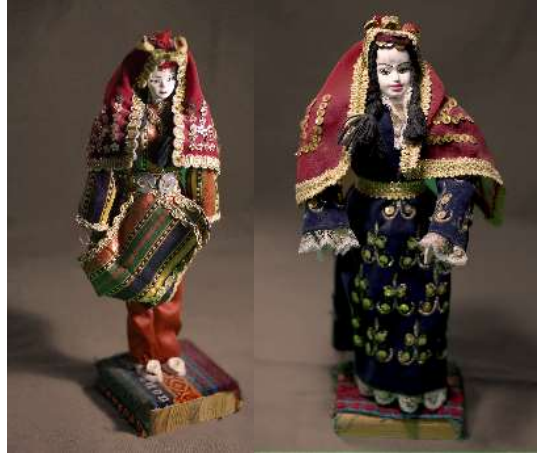
Şekil 14. Mudurnu bebeği örnekleri

İğne oyalı çember (yemeni): Mudurnu’da kare şeklindeki ince tülbeht bezleri, çiçek desenli süs motifleriyle “yemeni, yazma” olarak bilinir ve kenarları iğne oyalarıyla süslenir. Renkler, kıyafetlerle uyumlu olacak şekilde seçilir. Kadınların çeyizlerinde bulunan bu başörtüleri, gelecek nesillere hatıra olarak aktarılır ve her kadın bunları oğluna veya kızına devreder. Mudurnu’da hemen her kadının sandığında eski çemberler bulunur. Bu el emeği ürünler, Mudurnu kültüründe önemli bir yere sahiptir ve özenle korunur (Özdemir vd., 2011, s.135; Mudurnu Belediyesi, 2023). Gezici Bavul Müze koleksiyonunda on bir adet “iğne oyalı çember” bulunmaktadır (bkz. şekil 15, 16).