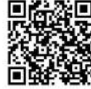
Şekil 13. Mudurnu tanıtım filmi (Bolu Kültür ve Turizm Müdürlüğü, 2019).

Gezici Bavul Müze'de Yer Alan Kültürel Nesnelere: Mudurnu yöresinin zengin kültürel mirasını ve giyim tarzını tanıtmak amacıyla, “iki adet Mudurnu bebeği, on bir adet iğne oyalı çember, bir adet hamam örtüsü, bir adet tokalı örtü, bir adet oyalı krep örtü, iki adet iğne oyasından gelin tacı, iki adet fes, iki adet fes oyası, bir adet pullu al (çatki), bir adet bindallı, bir adet don (şalvar), bir adet göynek, iki çift yün çorap, bir çift kara lastik, ipek iplik örnekleri ve dört adet tahta kaşık ve bir adet kirman” olarak bağlam içinde belirlenmiş ve Gezici Bavul Müze koleksiyonuna dahil edilmiştir.