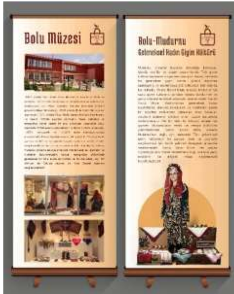
Şekil 7. Tanıtım bandı

Tanıtım bandı: İki adet, 85cmx200cm ebatlarında, alüminyum malzemeden üretilmiş, portatif taşıma çantalı tanıtım bandı bulunmaktadır. Tanıtım bantları, “Bolu Müzesi” ve “Mudurnu’nun geleneksel kadın giyim kültürü” hakkında bilgi ve fotoğraflar içerir. Eğitim etkinlikleri sırasında katılımcılara bu konular hakkında genel bilgi sunmak amacıyla hazırlanmıştır (bkz. şekil 7).