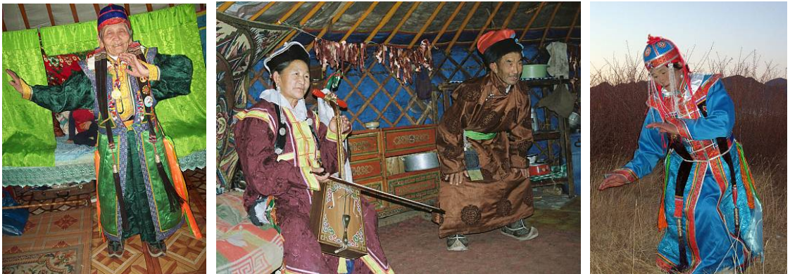
Fotoğraf 1. 2. 3. Moğol Biyelgee – Moğol Geleneksel Halk Dansları ( https://ich.unesco.org/en/lists )

2014, 2018 ve 2022 yıllarına ait Periyodik Raporlar incelendiğinde unsurun koruma eylem çalışmalarının devam ettirildiği, Bii Biyelgee danslarının mevcut durumu,