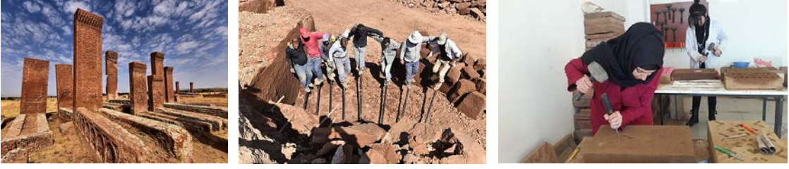
Fotoğraf 13. 14. 15. Geleneksel Ahlat Taş İşçiliği