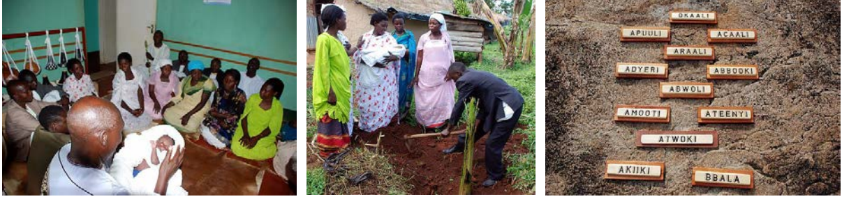
Fotoęraf 4. 5. 6. Batı Uganda'daki Empaako geleneęi ( https://ich.unesco.org/en/lists )

akrabaların katılımıyla gerekleřtirilir. Mevcut akrabalarla olan benzerlik isim seiminin temelini oluřturur. Daha sonra klan lideri ocuęa ismi aıklar. Bunu özel olarak hazırlanan ve ortaklařa yenilen bir yemek takip eder, bebeęe hediyeler sunulur ve onuruna bir aęa dikilir. Empaako'nun adlandırma ritüelleri yoluyla aktarımı, geleneksel kùltürün deęer kaybediři ve bu unsurla iliřkili dilin kullanımının azalması nedeniyle bu uygulama pratiklerinde dramatik bir azalma görùlmektedir.