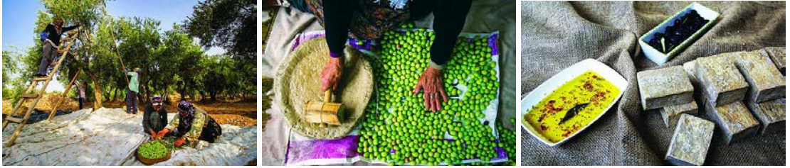
Fotoğraf 16. 17. 18. Zeytin Yetiştiriciliği ile İlgili Geleneksel Bilgi, Yöntem ve Uygulamalar ( https://ich.unesco.org/en/lists )

Unsurun korunması için ulusal düzeyde gerçekleştirilen toplantılara katılan ilgili STK’lar, belediyeler, muhtarlıklar ve miras taşıyıcılarının katkılarıyla bir “Acil Koruma Eylem Planı” hazırlanmıştır.