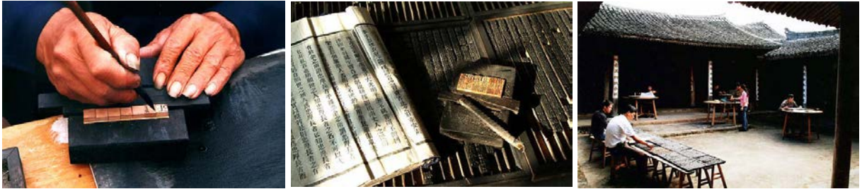
Fotođraf 7. 8. 9. Çin Ahşap Hareketli Baskı Tekniđi ( https://ich.unesco.org/en/lists )

Yazı sayfası söküldükten sonra hareketli karakterler tekrar tekrar kullanılabilir. Zanaatkârlar yıl boyunca ahşap karakter setlerini ve baskı araç-gereçlerini yerel topluluklardaki ata salonlarına taşır, orada klan soyađacını elle derleyerek basarlar. Sonrasında soyađacının tamamlanması bir törenle kutlanır ve matbaacılar soyađacını saklanmak üzere kilitli bir kutuya koyarlar. Ahşap hareketli baskı teknik ve bilgileri aileler arasında nesiller boyunca aktarılmaktadır. Ancak, gereken yođun eđitim, elde edilen düşük gelir, bilgisayar baskı teknolojisinin popölerleşmesi ve soyađacı derlemeye olan azalan ilgi, zanaatkâr sayısındaki hızlı düşüře neden olmuřtur. řu anda, tüm teknik setinde ustalařmış 50 yař üstü yalnızca on bir usta kalmıřtır. Bu geleneksel zanaat ve bu geleneksel bilgi korunmazsa, bu geleneksel uygulamanın ortadan kalkacađından tedirginlik duyulmaktadır.