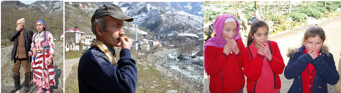
Fotoğraf 10. 11. 12. Islık Dili ( https://ich.unesco.org/en/lists )