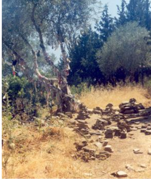
Fotoğraf 12. İzmir ili Ödemiş ilçesi Birgi mevkiinde adak adanan zeytin ağacı. Yatır ve mezarlarının olduğu bölgede her türlü isteği (bebek, araba ve sevgili) figüre eden taşlar bırakılmaktadır. Örneğin bebek isteyenler bebek bağlıyor.

Bu anlamda Yozgat ili Sorgun ilçesinde Duralidayılı ve Halilfakılı Köyü arazilerindeki Durali Baba ve Pir Dede Ziyareti meşelikleri ve Tokat ili, Niksar ilçesi Ormancık Köyü arazisindeki Bolat Gazi türbesi menengiç ağaçları en dikkat çekici örneklerdir. Ayrıca ülkemizin her köyü, kasabası ve şehir yerleşmelerinde binlerce hatta milyonlarca