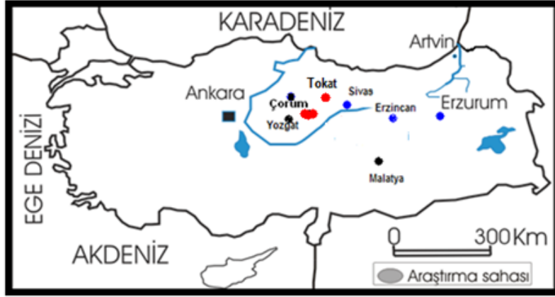
Şekil 1. Araştırma Alanlarının Konum Haritası

Orman işletme müdürlüğünce dikenli tellerle çevrilmiş olan koru alanı bu güne kadar inanışlar ve efsaneler sonucu kendi kendini korumuştur. Korumaya alınan alan tamamen meşeyle örtülü olmayıp müdürlükçe karaçam(Pinus nigra) ve mahlep(Cerasus mahalleb) dikilen ağaçlandırma alanları halindedir. Meşe yetiştirme alanı olmasına rağmen meşe dikilmemesinin sebebi ise meşenin bu bölgede kendiliğinden gençleşebilmesidir. Olgunlaşan palamutlar koruma alanında kuşlar ve koyunlar tarafından yakın çevreye taşınmakta ve çimlenmektedir (Şekil 1, Fotoğraf 1,2,3,4).