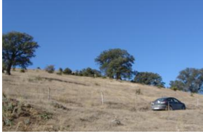
Fotoğraf 4. Ziyaret Tepe tel örgüyle korumaya alınmış olup, ağaçlandırma başlatılmıştır.

Ancak yine de meşe mesceresinde fazla bir yoğunlaşma görülmemekte, daha çok koru alanı yaşlı ağaçlardan oluşmaktadır. Bölge sakinleri yörede eskiden görülen delice ve kızlar kuşu gibi türlerin görülmediğini belirtmektedir.