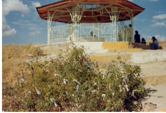
Fotoğraf 11. Sivas Soğuk çermik yakınındaki Ahmed-i Turan mezarı, ön tarafta kuşburnu çalısı dallarına bağlanmış adak bezler. Düğün ve sünnet konvoyları bu ziyareti gezdirilerek adak adanır ve dilek tutulur.