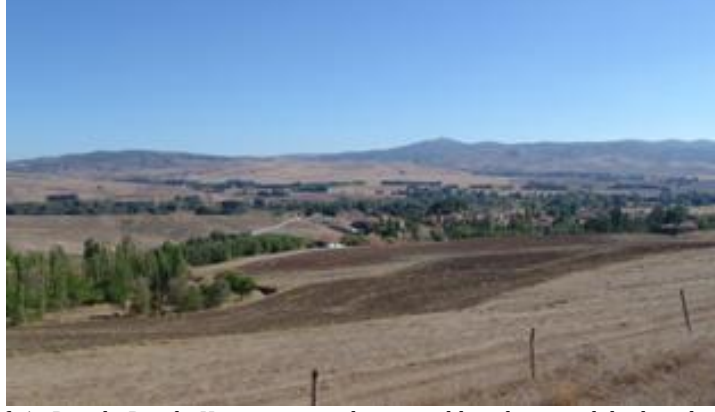
Fotoğraf 1. Durali Dayılı Köyü arazisi dere yatakları kenarındaki kavak ve söğüt ağaçları hariç, tamamen ağaçtan yoksun bir bitki örtüsüne sahiptir.