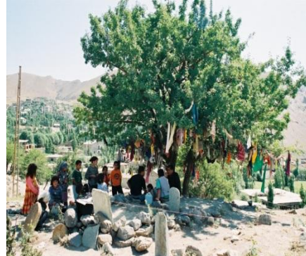
Fotoğraf 9. Anadolu'nun her yöresinde adak ağaçları yerel nüfustan yoğun ilgi görmektedir.