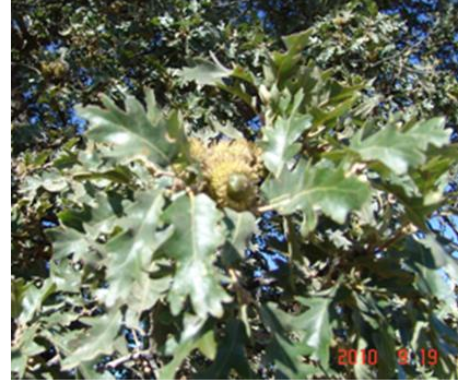
Fotoğraf 3. Ziyaret Tepedeki meşeler 30-35 m.ye kadar boylanabilmiş gövde çevresi 3-4 m.yi bulmuş anıt ağaç görünümündedir. Meşeler palamut meşesi olup, çok yoğun meyve vermektedir.