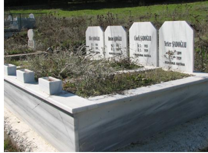
Fotoğraf 7. Türbe Ormancık(Şadoğlu) Köyü mezarlığı ile iç içedir. 1939 Erzincan Depreminde bölgede de ağır hasar olmuştur. Pek çok mezar bu tarihe aittir.