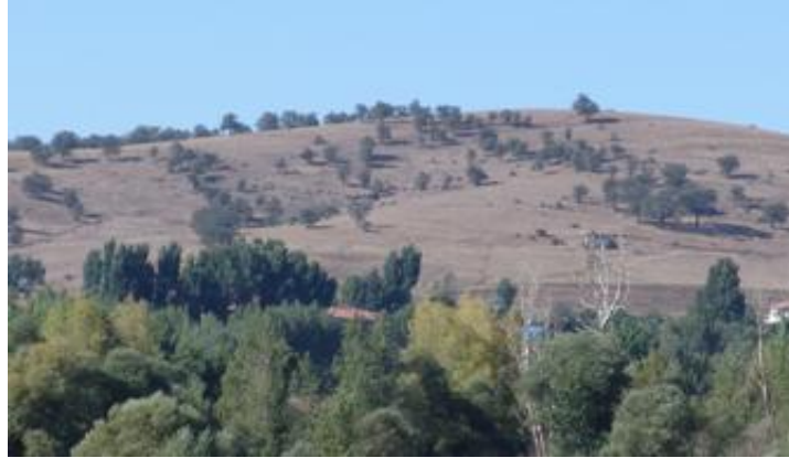
Fotoğraf 2. Durali dayılı Köyü ziyaret tepesi doğal olarak yetişen meşe ağaçlarına sahip tek konumdur.