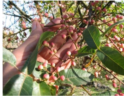
Fotoğraf 8. Bolat Gazi türbesi çevresinde korunmuş delice(pistacia terebinthus) ağaçları vardır.