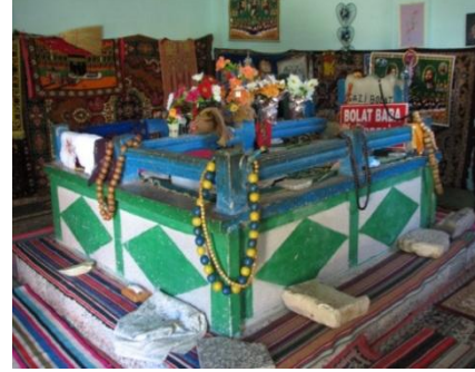
Fotoğraf 6. Bolat Gazi türbesi binası Ali Tarakçı tarafından 1982 yılında yaptırılmıştır. Türbe içerisinde Bolat Gazi'nin mezarı özenle korunmaktadır.