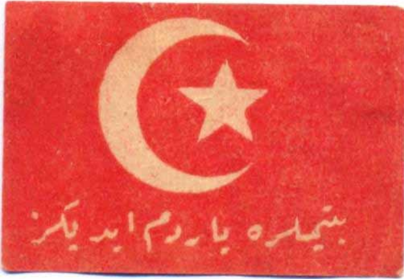
Yetimlere yardım ediniz.