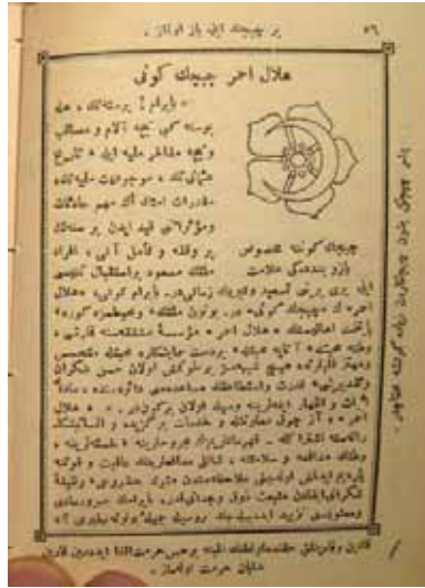
Takvim, II, s. 56.