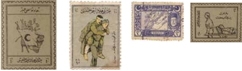
Ek 3: Hilal-i Ahmer Cemiyeti'nin bastırđı pul örnekleri.