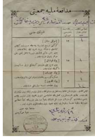
Ek 1: Tıp Fakültesi öğrencisi veya muallimi Kenan Efendi'nin dolaştırdığı 159 nolu yardım sandığından toplanmış 180 kuruşluk aynı yardımın 5 Ağustos 1331 [18 Ağustos 1915] tarihinde teslim edildiğine dair Müdafaa-i Milliye Cemiyeti'nin tanzim ettiği makbuz.