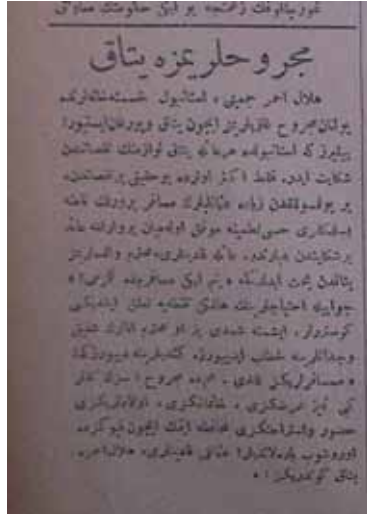
Mecruhlarımıza yatak. Sabah , 8 Mayıs 1915.