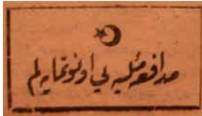
Ek 5: Müdafaa-i Milliye Cemiyeti'ni unutmayalım.