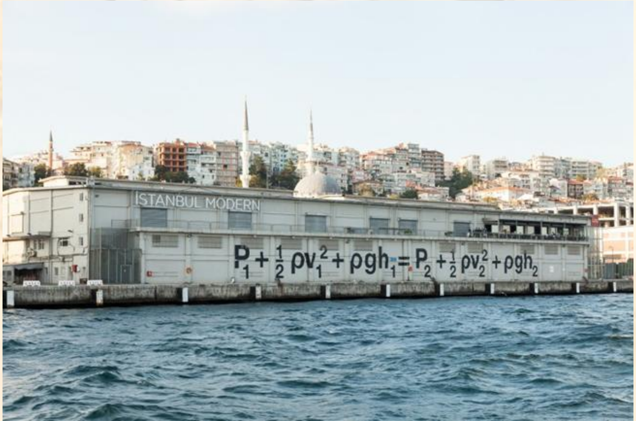
Resim 3. Liam Gillick 14. İstanbul Bienali “Uygulamalı Hidrodinamika” Duvar Üzerine Bernoulli Denklemi

Sanatsal bilgi içinde yer alan kapsamın gelişerek içeriğinin karmaşıklaşması ile birlikte yeni bilgi politikalarından doğan bir sanat dili oluşmaya başlar. Bu karmaşık dilin anlaşılabilirliği noktasında ise öncül bazı enformasyonel altyapıya ihtiyaç vardır. Hatta bu bilgiyi çözümlemede görsel bir belleğin dışında sosyolojik, felsefi, hatta pozitif bilime öykünen ve bilgi işlemeye kadar uzanan karmaşık bir hal aldığı aklı gelebilmektedir.