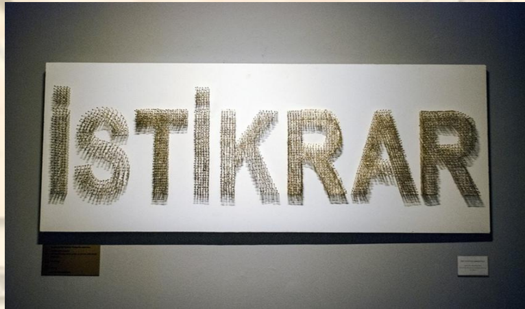
Resim 2. “İstikrarlı Ölüm” 2015 Ahşap Üzerine Çivi

Bu durum kapitalist ekonominin işleyiş ve düzenine uyum temelinde geliştirilen, sürdürülebilir büyüme hedefleri etrafında sürekli çalışarak, durmadan üretme ve tüketmeye endekslili yaşam formlarının verilerini aktaran bir kodlamaya dönüşmektedir. Bu işleyişin devamı sürekliliği arzulayan iktidar için son derece önemlidir. Konu özelinden bakıldığında sanat ve eğitimin üretmeye endekslili hali, ekonomik modeller özelinde sanatı bu amaç dışında tutmayacaktır. Çağdaş sanatla birlikte eğitim merkezli modeller sürdürülebilirlik merkezinde konuya önem verdikleri düşünülebilir. (kimin? Bu cümlenin anlamı anlaşılmıyor!) Bu işleve yönelik bilgiyi üretme ve bilgiyi yaymada sanat ve eğitimin önemli görüldüğü düşünülebilir. Emrah Altındış istikrar ve büyüme gibi söylemlerin temelde toplumsal eşitsizliğin devamını sağlamak adına önemsendiğini ifade etmektedir. Bu durumu ülkemiz genelinde örneklerken, son on yıllık süreçte büyüme ve istikrar gibi söylemlerin sıklıkla dile getirildiğini aktarmaktadır. Türkiye için %1’lik zengin dilimin servetlerinin daha da arttığına altını çizerken emek üreten %99’luk kesim için ise bunun tam aksinin yaşandığını öne sürmektedir. (Altındış, 2015). Benzer bir söylevi çalışmalarına konu edinen Neriman Polat ise yine sürdürülebilir bir istikrar için sistemin mağdurlarını kendi anlatı dili ile konu edinmiştir.