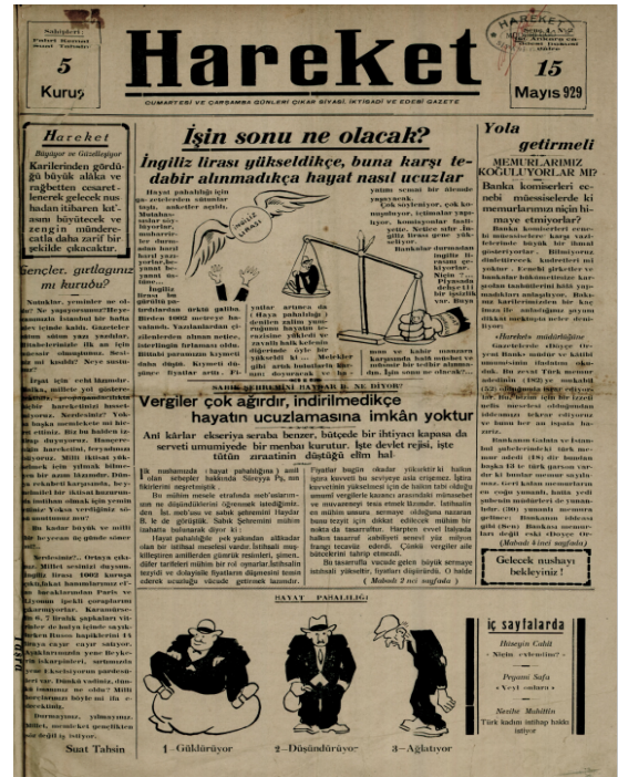
Hareket Gazetesi 2. Sayı Kapak Sayfası

Bu anlayış doğrultusunda yazılarına devam eden yazar, gazetenin 3. sayısındaki “Bugünkü Nesil Kimlerdir?” yazısında bugünkü nesli modası geçmiş batılı ve doğulu edebî cereyanları