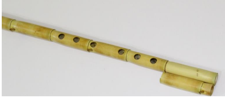
Görsel 1. Ek Boğum ve Kesilen Parça