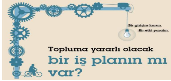
Şekil 1. Sosyal Girişimcilikte Temel Nokta

Bu kapsamda bakıldığında sosyal girişimcilikte en önemli konu girişimin toplumda önemli bir kesime fayda sağlayabilecek konular içinden seçilmesi ve bunun üzerine kar amaçlı veya kaç amaçsız bir yapı ile girişimin gerçekleştirilmesi ve iç (satış, sponsorluk gelirleri vb) ve dış finansman kaynakları (hibe, fon, teşvik vb) ile sürdürülebilirliğin sağlanmasıdır. Bu durumda da yine iyi bir iş planı ve planlama ile işe başlanmanın organizasyonun devamlılığı açısından önemi ortaya çıkmaktadır.