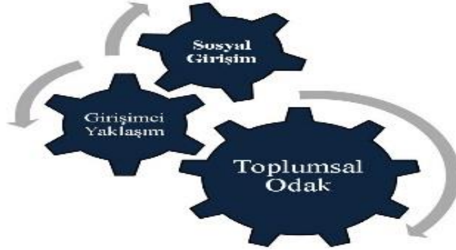
Şekil 2. Sosyal Girişimlerin Ortak Noktaları

Sosyal girişimler, sosyal sorunların çözümünde sistematik değişimi hedefleyerek girişimcilik esaslı veya serbest piyasa temelli yöntemler benimseyen kuruluşlar ya da başka ifadeyle alanlarındaki benzer vakalar üzerine vaka bazlı çalışmaktansa tüm bu konuyla ilgili taraflar üzerinde olumlu etkiler yaratabilme etkisine sahip sistematik bir değişim oluşturmayı ve çözümlerini yaygınlaştırarak uzun vadede toplumun desteğini kazanmayı ve bu yolla sorunların ortadan kaldırılmasını hedefleyen kuruluşlardır 9 .