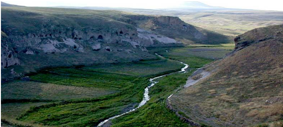
Resim 2: Ani Harabeleri (Mağaralar ve Bostanlar Deresi)

Ani harabelerinin turizm yönlü çekiciliğini arttırmak ve çevresini düzenlemek amacıyla bölgesel yönetim olarak ‘Kars Koruma Kurulu’ 2015 yılında ‘Çevre Düzenleme Projesi’ni onaylamıştır. Ani harabelerini ve Ocaklı Köyünü içine alan arkeolojik sit alanında kültür varlıklarının sürdürülebilirlik ilkesi doğrultusunda korunması ve ören yeri ziyaretçilerinin ihtiyaçlarının karşılanması amaçlarıyla hazırlanan koruma amaçlı imar planı ve çevre düzenleme projesi kapsamlı hazırlanmış bir proje olarak dikkat çekmektedir. Bu proje ile geniş bir alana yayılan Ani harabelerinin turistik gezimi esnasında ihtiyaç duyulan gişe, turnike, tuvalet, mescit, satış mağazası ve yöresel halk için satış üniteleri, kafeterya, sinevizyon odası, PTT-Döviz Bürosu vb. ziyaretçi donatı faaliyetlerinin yapımı yanında bilgilendirme-yönlendirme levhalarının yenilenmesi, yürüyüş yollarının iyileştirilmesi vb. uygulamaların yapılması ile birlikte alanda mevcut kullanım ve dolaşımdan kaynaklanan birçok sorunun çözümleneceği ve ayrıca çağdaş, teknolojik gelişmelerin gerektirdiği donatılarla alanın ihtiyaçlarının büyük ölçüde giderilmesi planlanmıştır. Ayrıca Ani Harabeleri, 2012 yılında UNESCO Dünya Kültürel Mirası geçici listesine, Türkiye merkezi ve bölgesel yönetimin çalışmalarıyla alınmış, 2016 yılında ise UNESCO Dünya Kültürel Miras Listesine girmiştir.