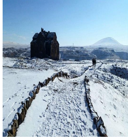
Resim 4: Ani Harabeleri- Ebul Menuçehr Camii/ Büyük Katedral- Kış