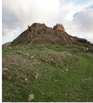
Resim 6: Ani Harabeleri Surlarından Bir Görünüm/ Gürcü Kilisesi (Surpn Stephanos)