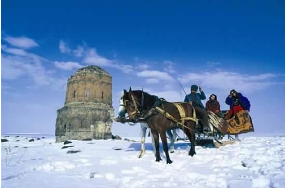
Resim 5: Ani Harabeleri (Halaskar Kilisesi)