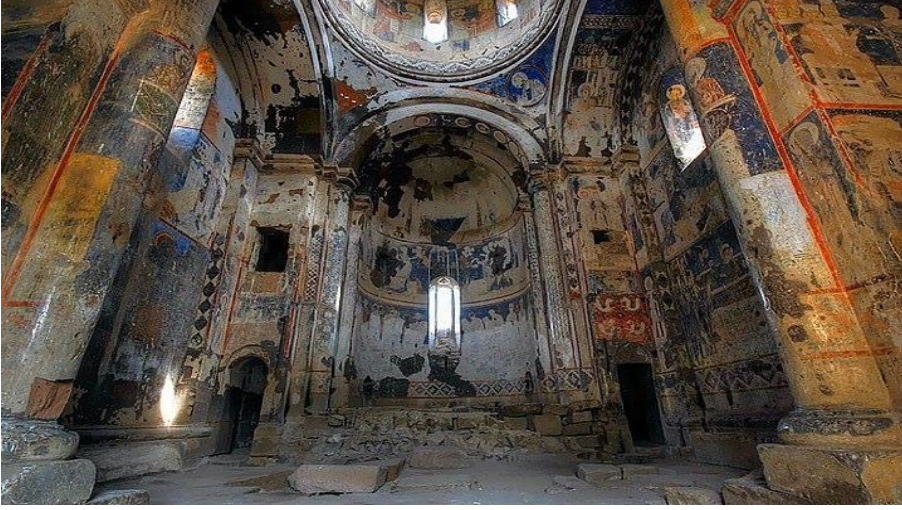
Resim 7: Ani Harabeleri (Büyük Katedral-İçten)