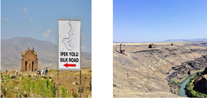
Resim 3: Ani Harabeleri- İpek Yolu Köprüsü