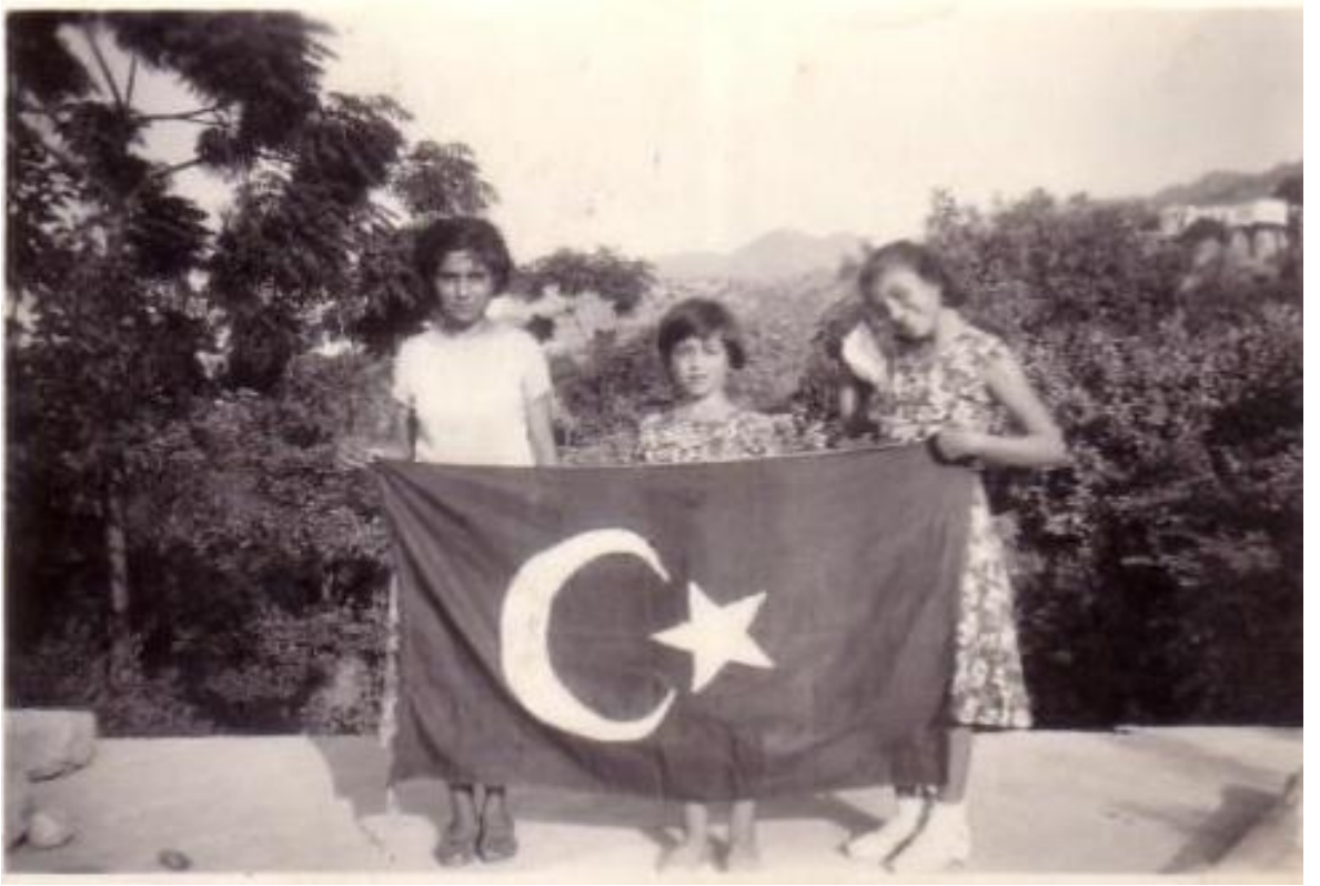
Resim 2: Kıbrıs Türk Çocukları