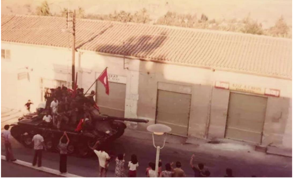
Resim 6: Tank, asker ve siviller.