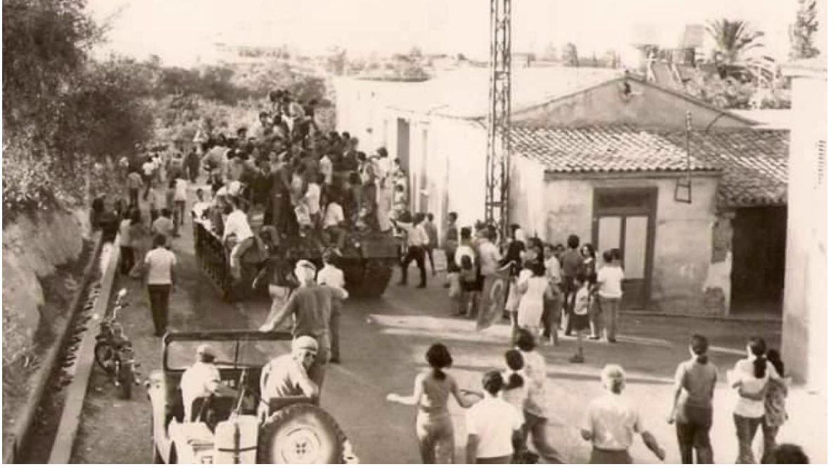
Resim 5: Tank ve üstünde insanlar.