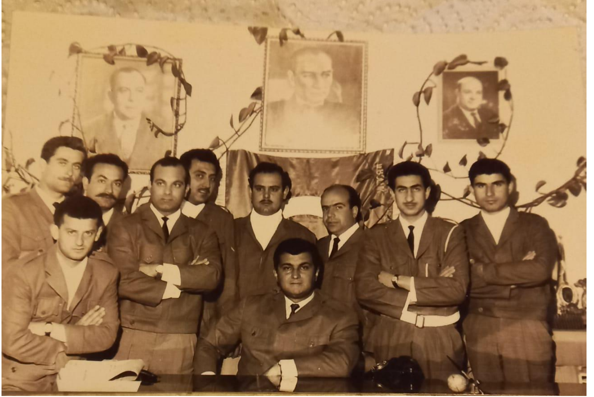
Resim 1: Kıbrıs Türk Mücahitleri