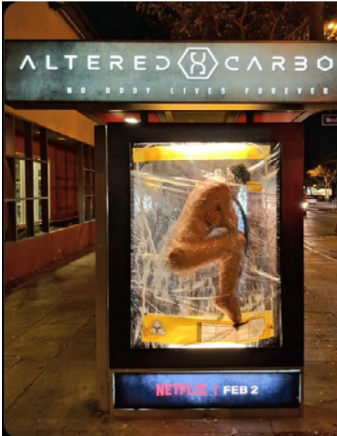
Şekil 3: Altered Carbon Dizisinin Ambient Reklam Görseli

Distopik, bilim kurgu türündeki Altered Carbon dizisi, ölümsüzlük teması üzerine kurgulanmış bir dizidir. Dizi insanların bilinçlerini yeni bedenlere transfer edebildikleri alternatif bir dünyada geçmektedir. Bir isyan sonrası hayatta kalmayı başaran tek asker Takeshi'nin zihni “buz içerisinde” 250 yıl boyunca hapsedilmiştir. Yüzyıllar sonra Laurens Bancroft adında varlıklı bir adam ortaya çıkana kadar bu dondurulma işlemi devam etmektedir. Laurens, Takeshi'den tekrar hayata dönebilmesi karşılığında zorlu bir cinayeti çözmesini istemektedir. Dizi yeniden hayata dönen karakterin bu yeni yolculuğunu konu edinmektedir.