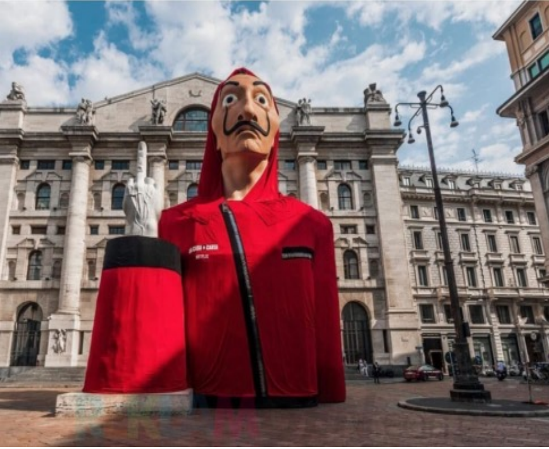
Şekil 1. La Case De Papel Dizisinin Ambient Reklam Görseli

Netflix, La Case de Papel gerilla pazarlama çalışmasında diziyi sembolleşmiş devasa büyüklükte bir heykel kullanmıştır. Kampanya kapsamında; Milano'nun iş merkezi Plaza degli Affari' borsa binasının önünde yer alan L.O.V.E. olarak adlandırılan beyaz mermer el heykeline, dizideki soyguncu ekibin giydiği ve dizi ile özdeşleşmiş olan Salvador Dali maskeli ve kırmızı tulumlu figür (Düzanlam) yerleştirilmiştir.