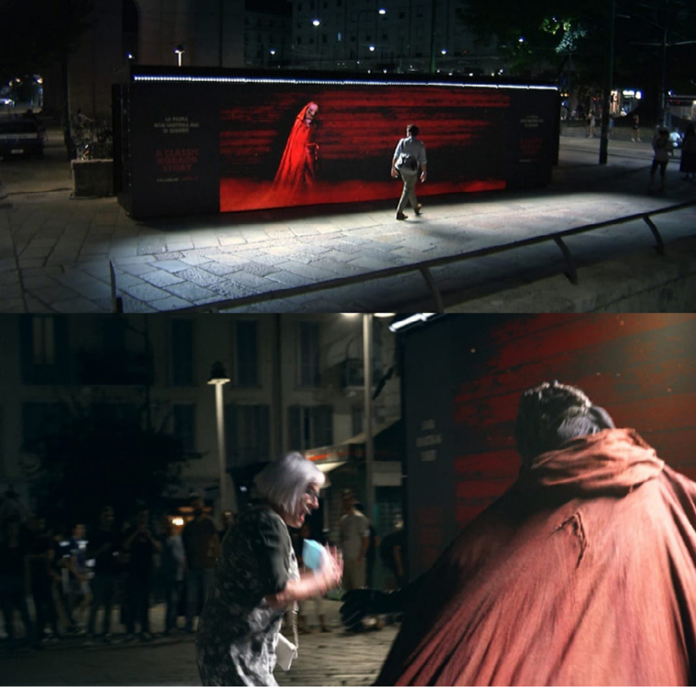
Şekil 4: A Classic Horror Story Dizisinin Ambient Reklam Görseli

Korku türündeki A Classic Horror Story filmi, ortak bir karavanla seyahat eden ve birbirini tanımayan beş kişinin geçirdikleri kaza sonucunda kendilerini içinde garip varlıkların yaşadığı bir ormanda bulmalarını ve bu ormanda yaşadıkları korkutucu olayları konu edinmektedir.