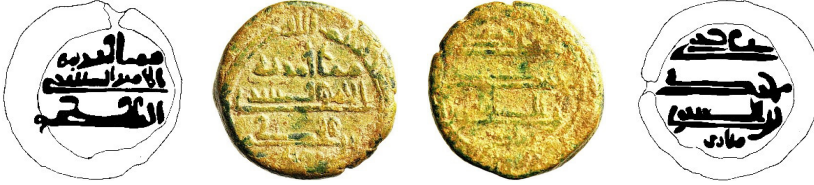
Resim 4. Ç.:14.9 mm, A.:2.55 gr. AE. Ünük. Fels

مما أمر به الأمير الصاری بن الحكم یزید علی يد محمد بن الصاری زیاد بسم الله ضرب هذالفلوس بمصر