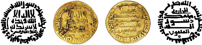
Resim 11. Ç.:18 mm, A.:4.22 gr. AU. S. Dinar

لااله الاالله وحده لا شريك له عبدالله بن الصاري محمد رسول الله ارسله بالهدى ودين الحق ليظهره على الدين كله للخليفة محمد رسول الله المامون بسم الله ضرب هذا الدينار سنة تسعة ومانتان