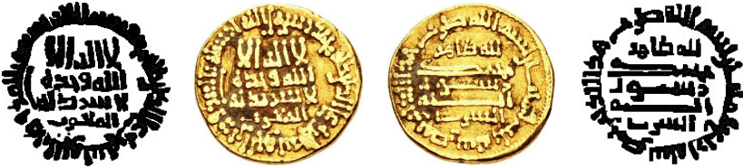
Resim 7. Ç.: 17.5x18 mm, A.:4.26 gr. AU. C. Dinar (Zeno:35575/262264/CNG:527-504/ANS:1971.49.217)

لااله الاالله وحده لا شريك له المغرب محمد رسول الله ارسله بالهدى ودين الحق ليظهره على الدين كله لله طاهر محمد رسول الله الصارى بسم الله ضرب هذا الدينار سنة ثلاثة و مائتان