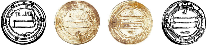
Resim 1. Ç.:22.1x22 mm, A.:2.827 gr. AR. RR. Dirhem

لااله الاالله وحده لا شريك له بسم الله ضرب هذا الدرهم بمدينة اصبهان سنة ستة وتسعون ومائة الله محمد رسول الله ارسله بالهدى ودين الحق ليظهره على الدين كله ولو كره المشركون هرثمة