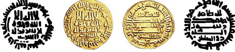
Resim 6. Ç.:18 mm, A.:4.23 gr. AU. S. Dinar (Zeno:77694/45505/ LN:16-4401)

لااله الاالله وحده لا شريك له الصارى محمد رسول الله ارسله بالهدى ودين الحق ليظهره على الدين كله لله طاهر محمد رسول الله ذوالرناستين بسم الله ضرب هذا الدينار سنة مائتان وواحد