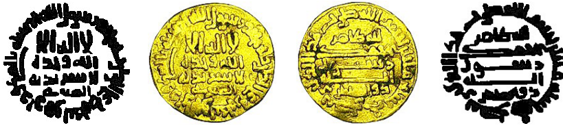
Resim 5. Ç.:17x18 mm, A.:4.21 gr. AU. C. Dinar

لااله الاالله وحده لا شريك له الصارى محمد رسول الله ارسله بالهدى ودين الحق ليظهره على الدين كله الله ظاهر محمد رسول الله ذوالرناستين بسم الله ضرب هذا الدينار سنة مانتان