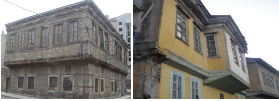
Fotoğraf 89. Çok az sayıda tarihi Erzurum evi günümüze kadar gelebilmiştir.

Bunlara ilave olarak şehre yakın mevkide bulunan tarihi köprüler de bu bakımdan ilgi çekmektedir. Bu eserlerden biri 17. yüzyıla ait olan, Tivnik Köyü ile Erzurum arasında, Erzurum'a 7 km kadar uzaklıkta, Karasu Nehri'nin kollarından birinin üzerinde yaptırılmış, Altınbulak (Tivnik) Köprüsü 'dür. Köprü, kuzey-güney doğrultusunda, 55 m uzunluğunda ve 2,5 m genişliğindedir. Bir diğeri, yine Karasu Nehri üzerine kurulmuş, Erzurum'a 22 km uzaklıkta, Erzurum-Karaz yolu üzerinde, Karaz Köyü yakınlarındaki Karaz (Öznü) Köprüsü 'dür. Yapı, Osmanlı üslubunda 16. yüzyıl sonlarında yapılmış ve en son 1980-1984 yılları arasında onarılmıştır. Köprü doğu-batı doğrultusunda 135 m uzunluğunda ve 6,25 m. genişliğindedir. Bunların dışında bir başkasını ise, Eski Erzurum-Pasinler yolunun 8. km'sinde, Deveboynunda, Toparlık Köyü yakınlarında, vadi içerisinde, Toparlık Suyu üzerinde, 18. yüzyılda inşa edilen Nebi Hanı Köprüsü oluşturur. Dokuz gözlü olan köprü, 43 m uzunlukta, 6 m genişliğindedir (Gündoğdu ve Özkan, 1995: 25-28).