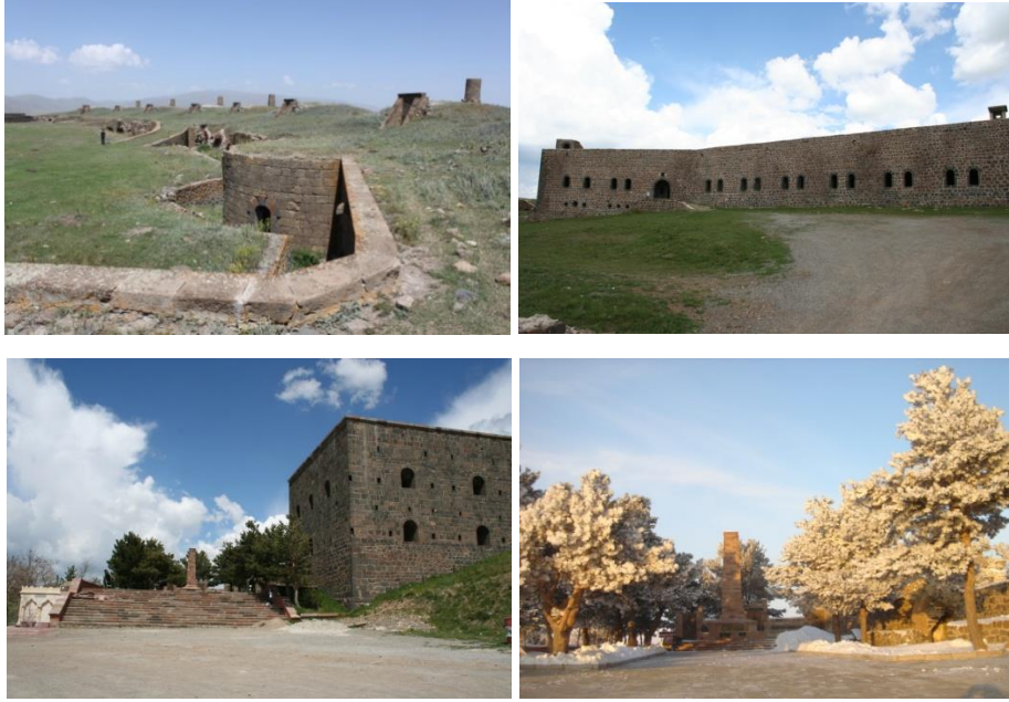
Fotoğraf 2. Askerler tarafından inşa edilen Tabyalar ile şehre çeşitli yönlerden gelen yolların kontrol altında tutulması amaçlanmıştır.