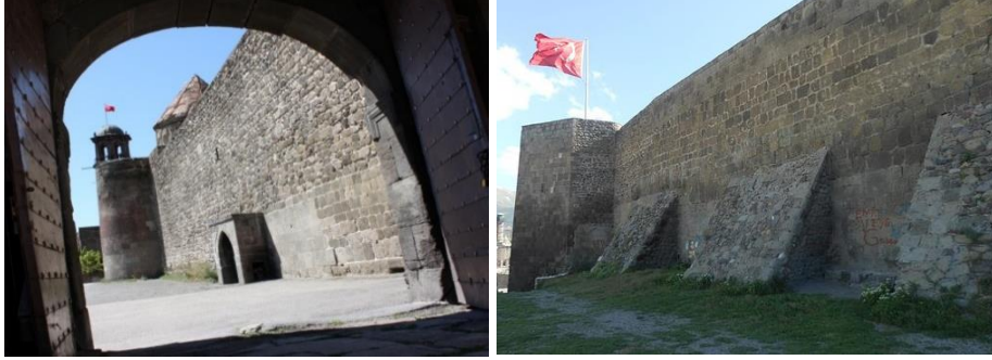
Fotoğraf 1. Erzurum Kalesi , Erzurum şehrindeki tarihi eserler arasında en eski olanıdır.

Doğu batı doğrultusunda şehre hâkim bir tepe üzerine kurulan iç kale dikdörtgen bir plana sahiptir. 1960 yılına kadar, sonradan eklenmiş bir takım yapılar kaldırılmış, günümüzde sadece Kale Mescidi ve Tepsi Minare kalmıştır. Kalede küçük hamamlar bulunmaktadır. Dışarıdan on dört dayanak kulesiyle ile desteklenen kalenin, güney cephesinde bir de çeşmesi bulunmaktadır (Yurttaş vd., 2011: 91).