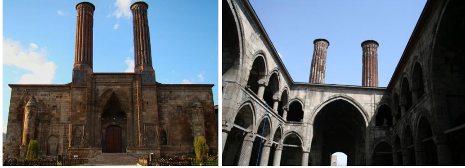
Fotoğraf 4. Çifte Minareli Medrese İlhanlı dönemi eserlerindedir.

Ahmediye medreseleri), 3'ü de Osmanlı dönemine (Kurşunlu/Fevziye, Pervizoğlu ve Şeyhler medreseleri) aittir. Erzurum'daki İlhanlı dönemi medreseleri bağımsız anıtsal görünümlü medreseler olarak inşa edilirken, Osmanlı dönemi medreseleri ise daha küçük ölçülerde olup, bir külliye parçası olarak düzenlenmişlerdir. İlhanlı Dönemi medreselerinden Çifte Minareli Medrese (Hatuniye Medresesi), açık avlulu, Yakutiye ve Ahmediye Medreseleri ise kapalı avlulu olarak Anadolu Selçuklu medrese geleneğinde (yapımcılarının İlhanlı olmasına rağmen) inşa edilmişlerdir. Çifte Minareli Medrese boyutları bakımından Anadolu'nun en büyük açık avlulu medresesidir. Bu medrese, Tebrizkapı semtinde bulunmaktadır (Fotoğraf 4). Şehri çevreleyen dış surların doğu kısmına bitişik olarak inşa edilen medresenin girişi, Tebrizkapı kesimine açılmaktadır. Medresenin 13. yüzyılın sonu 14. yüzyılın başlarında inşa edilmiş olacağı düşünülmektedir. Anadolu'nun en büyük açık avlulu medresesi olan Çifte Minareli medrese dikdörtgen bir alan üzerine kurulmuş, açık avlulu, dört eyvanlı, revaklı ve iki katlıdır. Medresenin batı cephesinde yedi öğrenci odası, bir mescit ve bir büyük oda yer almaktadır (Yurttaş vd., 2011: 128-131). Yine İlhanlı dönemi medreselerinden biri diğeri olan Ahmediye Medresesi ise, Murat Paşa Mahallesi'nde, Murat Paşa Camii'nin doğusundadır. Gani Ahmed bin Ali bin Yusuf tarafından inşa ettirilmiştir (Yurttaş vd., 2008: 108-110).