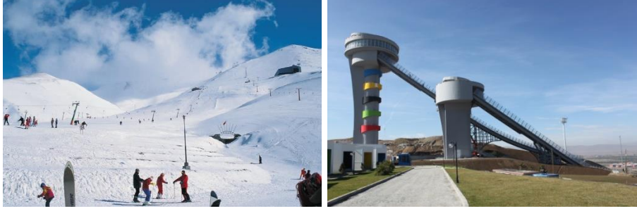
Fotoğraf 10. Şehir, kış turizmi bakımından ülkemizin en önemli tesislerine sahiptir.

oluşturulan futbola yönelik yüksek irtifa spor merkezleri, çeşitli branşlara yönelik spor salonları, ata sporlarımız olan cirit ve güreş, şehirde spor turizminin geliştirilmesine katkı sağlayacak etmenlerdir. Anlaşılacağı üzere şehirde, bu turizm çeşidinin gerçekleştirilebileceği gerek sportif gerekse de fiziki alt yapı mevcuttur.