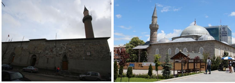
Fotoğraf 3. Ulu Camii ve Lala Paşa Camii turistik bakımdan öneme sahiptir.

Şehre gelenlerin en fazla ziyaret ettikleri camilerden bir diğerini de yine Cumhuriyet Caddesi üzerinde yer alan Lala Paşa Camii oluşturur. Bu cami, Kanuni Sultan Süleyman'ın komutanı Sadrazam Lala Mustafa Paşa; tarafından Erzurum Beylerbeyi görevini yürüttüğü dönemde (1562-63 yılında) yaptırılmıştır. Aynı zamanda külliyenin ana yapısını oluşturan cami, Erzurum'da Osmanlı döneminde yapılan ilk cami olma özelliğini taşımakta olup, daha sonra şehirde inşa edilen diğer Osmanlı camilerine de model olmuştur (Gündoğdu, H., 1992: 13; Yurtaş vd., 2011: 108). Bu cami de Ulu Camii gibi, Cumhuriyet döneminde birçok onarım geçirmiştir (Vakıflar Bölge Müdürlüğü tarafından 1995, 2005 ve 2016 tarafından onartılmıştır).