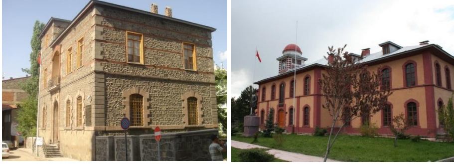
Fotoğraf 8. Şehirdeki turistik öneme sahip yapılardan Atatürk evi ve Kongre binası.

Bakanlığı'nın Erzurum Erzak Deposu olarak işlevini sürdüren Taş Ambarlar (Ambar-ı Kebir) da yer alır (Yurttaş vd., 2011: 180).