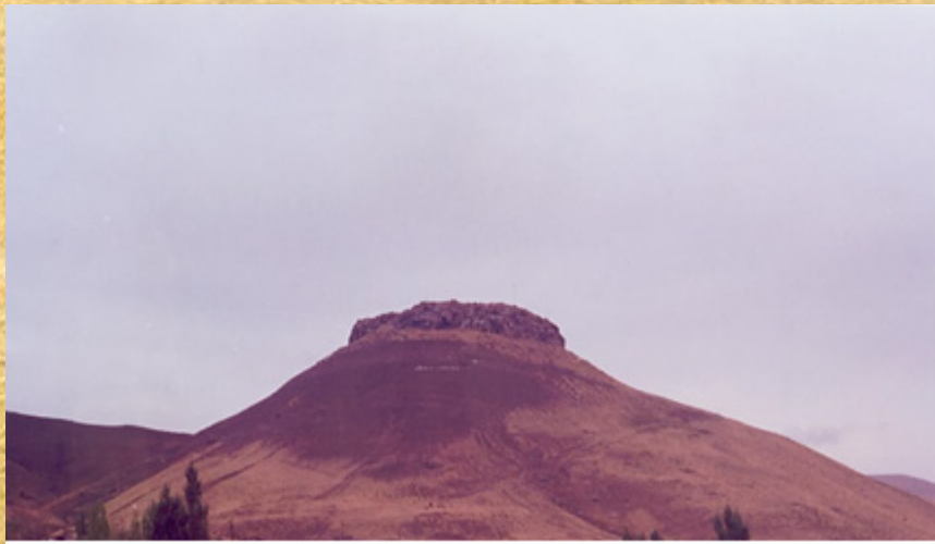
Resim 2: Kelereş Kale (Karakale)