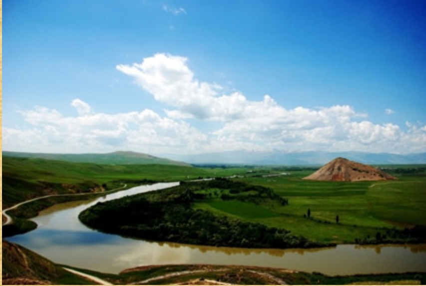
Resim 1: Mercimek Kale

Diğer taraftan Malazgirt Beyi Nuh adlı şakinin üzerine de asker gönderilmiştir. Ancak Nuh da bir yolunu bularak kaçmayı başarmıştır. Bölgede Nuh'a ait olan iki kale yıkılarak kullanılmaz hale getirilmiştir. Öte taraftan Mahmudi ahalisinden olan Mihrab ve Tatar Han'ın üzerine de asker sevk edilmiştir. Mihrab yakalanarak cezalandırılmıştır. Fakat Tatar Han göçer taifesinden olduğu için askerın üzerine geldiğini önceden haber alınca Hakkari dağlarına sığınmıştır. Zira Hakkari dağları belgede ifade edildiği üzere kış mevsiminde saklanmak ve barınmak için uygun bir yerdi 38 . Öte taraftan şakilerden olan Bitlis hanı Burhan da kaçmayı başarmıştır.