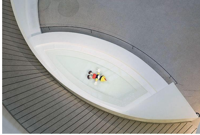
Görsel 3. Guggenheim, Daddy Daddy adlı eserin sergi görüntüsü (Cattelan, 2008)

Benzer şekilde, Daddy Daddy (2008) eserinde ise, Pinokyo karakterini bir havuzun içinde yüzüstü bırakılmış şekilde betimleyerek, masumiyet ve çocukluk temalarını beklenmedik bir bağlamda yeniden ele almaktadır. L.O.V.E. (2010) ise toplumsal ve politik düzene yönelik doğrudan bir karşı duruş niteliğindedir, tüm parmakları kesilmiş ve yalnızca orta parmağı kalmış dev bir el heykeli, sanatçının otorite ve güç figürleriyle alay eden tutumunun bir yansıması olarak izleyiciye sunulmaktadır.