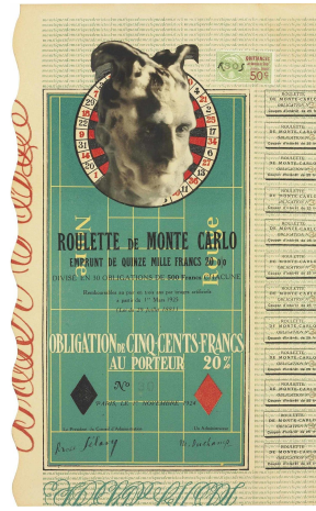
Görsel 7. Duchamp'ın Monte Carlo Bond No. 12 adlı eseri (Duchamp, 1924)

Duchamp, imza ile sanatın bireysel üretimle olan ilişkisinin sorgulandığı ve sanatın finansal değerinin belirlenmesinde önemli bir faktör haline geldiği bir ilişkiyi ortaya koymuştur. Peter Bürger, Duchamp'ın imzasının, sanatın bireysel üretime dayalı olduğu anlayışını sorguladığını belirtmektedir: "Duchamp [...] seri üretim nesnelere [...] imzalayıp sanat sergilerine gönderdiğinde, bireysel üretim kategorisini tartışmaya açmıştır" (Bürger, 2012, s. 55). Duchamp'ın eserlerindeki imza, aynı zamanda sanat dünyasında değer yaratma süreçlerinin ironik bir eleştirisi olarak işlev görmektedir.