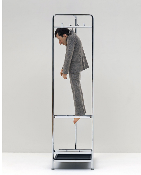
Görsel 1. Guggenheim, La Rivoluzione siamo noi adlı enstalasyon görüntüsü (Cattelan, 2000)

Cattelan çağdaş sanatın en sıra dışı ve provokatif figürlerinden biri olarak kabul edilmektedir. Sanat eğitimi almamış olmasına rağmen, eserleriyle uluslararası çapta büyük yankı uyandırmış ve sanat dünyasının yerleşik normlarını sorgulayan bir sanat pratiği geliştirmiştir. Sanatçı, kendisini bir "sanat işçisi" olarak tanımlayarak mizah, hiciv ve absürdü eserlerinin merkezine yerleştirmekte ve geleneksel sanatçı kavramına mesafeli yaklaşmaktadır. Cattelan'ın erken dönem işleri, sanat dünyasının temsilcilerine yönelik hicivsel yaklaşımlar içeren performanslar ve enstalasyonlar üzerine kurulmaktadır. Sanat piyasasının mekanizmalarını ve sanatçının konumunu ironik bir bakış açısıyla ele alan sanatçı hem bireyleri hem de sistemleri eleştiren eserler üretmiştir. Örneğin, sanat galerisi yöneticileri ve sanatçılar arasındaki güç ilişkilerine dair bir eleştiri niteliğindeki projelerinde, sanat dünyasının otorite figürlerini karikatürize ederek bir tür parodi yaratmaktadır. Bunun yanı sıra, Cattelan oto-ironiyi de sanatsal üretiminin merkezine koymakta ve kendisini de eleştirel sürecin bir nesnesi hâline getirmektedir. Mini-me (1999), La Rivoluzione Siamo Noi (2000) ve We (2010) gibi eserlerinde kendi figürünü kullanarak sanatçı rolünü sorgulamakta ve sanatçının imajına yönelik geleneksel algıyı altüst etmektedir.