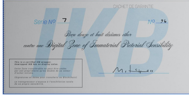
Görsel 9. Digital Zones of Immaterial Pictorial Sensibility adlı eser (Chan, 2017)

belirttiği gibi, "NFT"ler hem bir yatırım aracı hem de sanat piyasasında özgünlük ve mülkiyet kavramlarının yeniden tanımlandığı bir alan olarak önemli bir dönüşüm süreci başlatmaktadır" (Judovitz, 1993, s. 216).