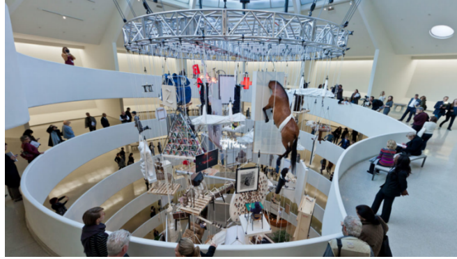
Görsel 5. Guggenheim, All adlı sergiden görüntü (Cattelan, 2012)

eleştirisinin bir uzantısıdır. Farago , Komedyen 'i sanatçının 1999 yılında gerçekleştirdiği A Perfect Day adlı çalışmasıyla ilişkilendirmekte ve Cattelan'ın galericisi Massimo De Carlo'yu galeri duvarına bantladığı bu performansın, sanat piyasasının ekonomik ve kültürel dinamiklerine yönelik ironik bir eleştiri sunduğunu öne sürmektedir. Farago , Cattelan'ın eserlerinde belirli bir yöntemsel süreklilik olduğunu öne sürerek, Komedyen 'in sanatçının önceki işlerinden kopuk olmadığını vurgulamaktadır. Örneğin, sanatçının 1997 yılında ürettiği Novecento adlı eserinde, tavan avizesi gibi asılmış tahnit edilmiş bir at figürü aracılığıyla faşist ihtişamı grotesk bir şekilde alaya aldığı; 2000 yılında gerçekleştirdiği La Rivoluzione Siamo Noi (Devrim Biziz) adlı çalışmasında ise kendisini küçük bir figür olarak bir portmanto askısına astığı düşünüldüğünde, Cattelan'ın otorite, iktidar ve bireysel temsil gibi kavramlara yönelik eleştirel stratejilerini tutarlı bir şekilde sürdürdüğü görülmektedir. Sanatçının bu yaklaşımı, kişisel tarihsel arka planı ile toplumsal eleştiriyi bir araya getirerek; özeleştiri ve kamusal eleştiriyi aynı anda işleten parodik bir söylem biçimini ortaya koymaktadır.