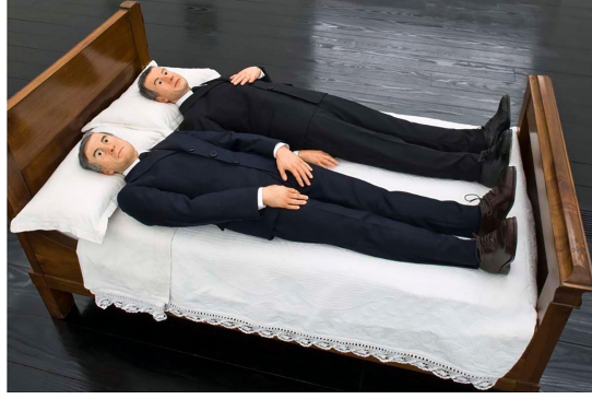
Görsel 2. Perrotin Galeri, We adlı eserin yerleşim görüntüsü (Cattelan, 2010)

Cattelan, sanatın yalnızca görünürlük, tanıtım ve halkla ilişkilerden ibaret olmadığına dikkat çekmektedir. Bir röportajında, "Sanat, bir galeriyi aramak, bir koleksiyoncuya telefon etmek ve Tribeca'da havalı bir restoranda rezervasyon yaptırmak arasında kalan bir şeydir" ifadesiyle, sanatın farklı sistemlerin ve gerçeklik düzeylerinin kesişiminde biçimlendiği vurgulamaktadır (Di Pietrantonio, 2003, s. 142). Cattelan'a göre sanatın anlamı yalnızca fiziksel esere indirgenemez; sanat aynı zamanda piyasa dinamikleri, küratöryel tercihler ve kültürel etkileşimler tarafından da şekillenir. Sanatçının eserlerinde mizah, çoğunlukla derin bir trajikomik unsurla iç içe geçmiştir.