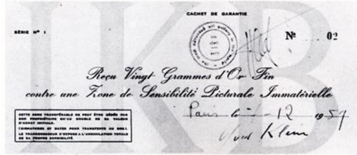
Görsel 8. Yves Klein'in Zone de Sensibilité Picturale Immatérielle adlı eserinin satın alımını belgeleyen bir makbuz (Klein, 1959)

eleştiriyi de içermektedir. Sanat piyasasında eser fiyatlarının yükselmesi, aynı zamanda ekonomik yapıyı ve statü yarışını da gözler önüne sermektedir. Duchamp, alım-satım işlemlerinde kullanılan belgeleri dönüştürerek, sanat ve ekonomi arasındaki geleneksel sınırları sorgulamaktadır.