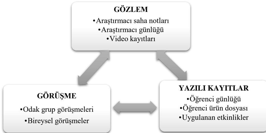
Diyagram 2. Veri Toplama Araçları

Müze ve tarihi mekânlardaki öğrenme süreci, daha çok yaşantıya dayalı ve duyuşsal alanı hedeflediği için standartlaştırılmış nicel ölçme araçları kullanılmayarak araştırmanın bütüncül yapısına uygun olduğu öngörülen nitel veri toplama araçları kullanılmıştır. Araştırma sürecinin bütün aşamalarında kullanılan veri toplama araçları Diyagram 2'de gösterilmiştir.