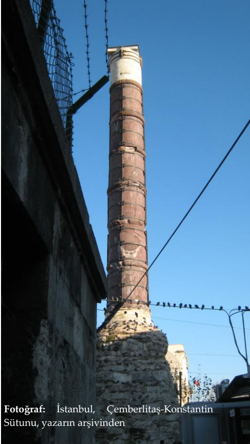
Fotoğraf: İstanbul, Çemberlitaş-Konstantin Sütunu, yazarın arşivinden

da geçer. Bu betimleme, Roma kentlerinin kuruluşuna ilişkin anlatılarla örtüşmektedir. Bu noktada Konstantinopolis'in Roma İmparatorluğu'nun yeni başkenti, Yeni Roma olarak kurulmuş olması önem kazanır. Bu kuruluşta, haliyle Pagan gelenekler belirleyici olmuştur. “Planlamacılar bir şehrin umbilicus'unu gökyüzünü inceleyerek de belirliyorlardı. Güneşin izlediği yol gökyüzünü ikiye bölüyordu; geceleyin yıldızlar üzerinde yapılan bazı ölçümlerle bu ayırım çizgisi de dik açıyla bölünüyor ve böylece gökler dört parçaya ayrılmış oluyordu. Bir şehir kurmak için adeta gökyüzünün haritası yeryüzüne yansıtılmış gibi, yerde, göğün dört parçasının bulunduğu noktanın hemen altına düşen bölüm aranılıyordu... müstakbel şehir ahalişi umbilicus'da