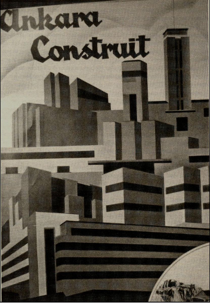
Resim 3: La Turquie Kemaliste dergisinde "İnşa Halindeki Ankara" Albümünden Ankara'nın "boş kent" imgesi ile tasarımını gösteren bir imaj (Nisan, 1935)