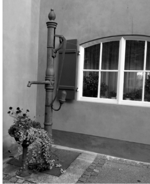
Figür 12. Su Tulumbası