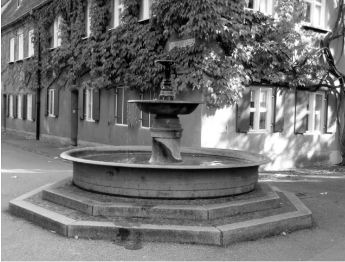
Figür 11. Çeşme