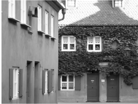
Figür 7. Konut Birimleri

Mumford, "The City in History" adlı eserinde 16. yüzyılda kentsel izdihamı hizaya sokma çabalarının kentin her bölümünü etkilediğini, en çok da yoksul konutu üzerinde bu etkinin gözlemlendiğini belirtir. Mumford, sürekli bakımsızlaşan ve küçülen işçi sınıfının yaşadığı konut alanlarına karşılık Fuggerei yerleşimini mimari olarak başarılı bulur. Buna karşılık, yine de yeterli miktarda açık alanlara sahip olmamasını ve bu küçülmenin etkilerinin o dönemdeki hayır işlerinde bile gözlemleniyor olmasını eleştirir (Mumford 1991, s.493). Bugünün yoksulluk şartları açısından değerlendirildiğinde ise yerleşim hiç de azımsanmayacak büyüklükte yaşam birimlerini, konutlara özel bahçeleri, herkesin kullanımına açık meydancıkları barındırır (Figür 7), (Figür 8). Yalın ve gösterişsiz bir mimari üslup alana bütünüyle hakimdir. Yapıların yerleşimdeki iç sokaklara bakan ön cepheleri yalın mimarisi ve birbirini tekrar eden giriş kapıları ve pencereleri ile, yan cepheleri ise dik çatılara eşlik eden ve kademelerle yükselen kalkan duvarlar ile karakterize olur. Yer yer cephelerde tekrar eden sarmaşıklar dolu yüzeylerle bütünleşmiş ve yapının mimari karakterinin bir parçası haline gelmiştir.