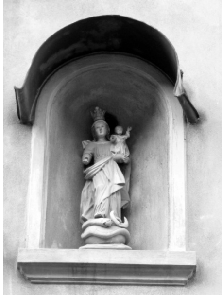
Figür 6. Dini Temsil