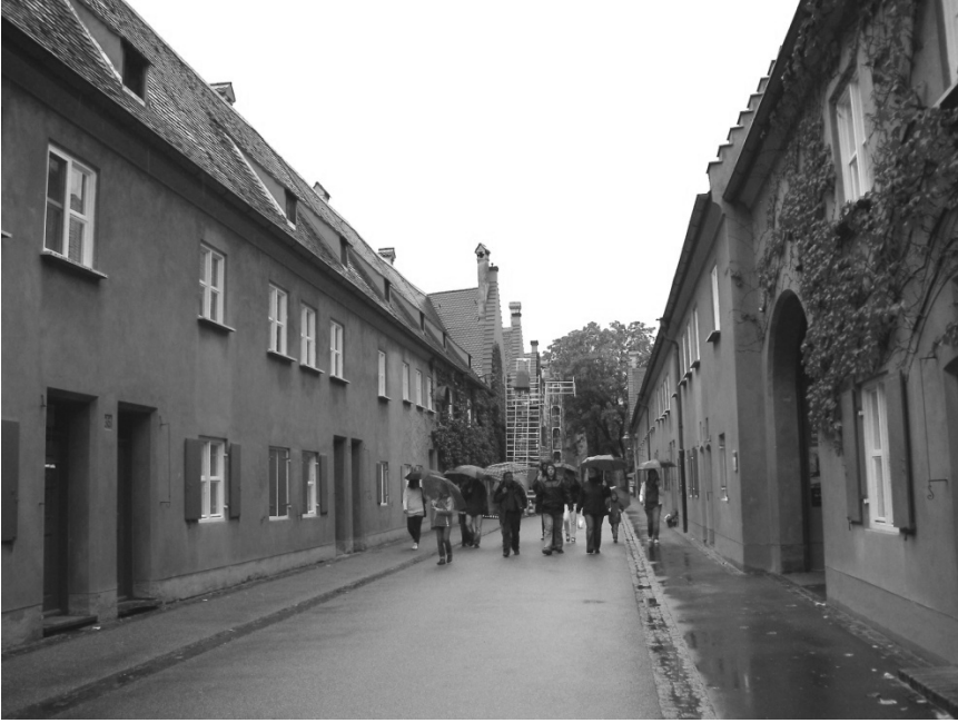
Figür 3. Yerleşim İçindeki Sokaklar

‘Kent içinde kent’ olarak da değerlendirilebilecek olan ve yoksulların barınmasını amaçlayan Fuggerei yerleşimi, çevresi yüksek duvarlarla çevrenmiş, üç giriş kapısı olan, korunaklı, içinde kendi yaşam kurallarını barındıran bir yerdir. Giriş kapıları üzerinde yer alan plakalarda Fuggerei Ailesi’nin sahip oldukları herşey için Tanrı’ya duydukları şükranları belirten yazılar bulunur. Hem mekansal hem de sosyal anlamda çevresinden kendini farklılaştıran bu yer, kurallarına uyulduğu sürece, içinde yaşanmasına izin verir. Bir yerleşim biriminin yıllık kirası, ilk kurulduğu yıldaki ile aynı olarak bugün de 0.88 Euro’dur. Yerleşimde mevcutta 150 kişinin yaşadığı, 140 apartman biriminin bulunduğu belirtiliyor (The Fuggerei 2010). Fugger Ailesine ve bu yerleşiminin kurucusuna günde üç kere kilisede dua etmek, Katolik olmak, yoksul ama borçlu olmamak, son iki yıldır Ausburg’da yaşamak bu yerleşimde ikamet