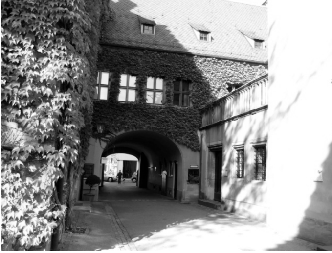
Figür 9. Komite ve İdare Binaları

bir memur atanmıştır (Figür 12). Yerleşim yerinde 1520’de kurulan küçük bir kütüphane ve tedavi mekanı içeren bir birim de bulunmaktadır.