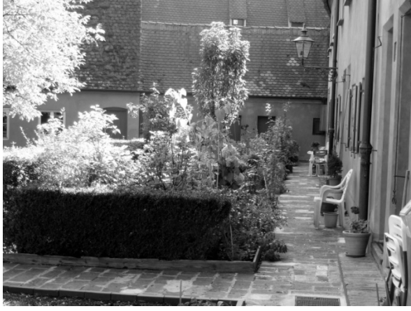
Figür 8. Konutların Arka Bahçeleri