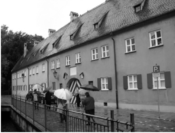
Figür 1. Fuggerei Yerleşimi

kısmını karşılayan bu kiralara ek olarak Fugger'ın kuruluş sermayesi olarak ayırdığı para üzerinden elde edilen kâr ile yerleşimin tüm bakımı karşılanmaktadır (Adam 2009: s.51).