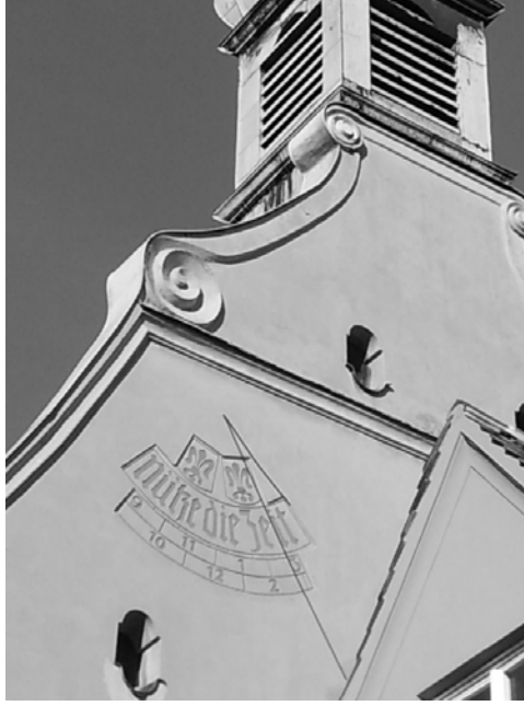
Figür 10. Güneş Saati