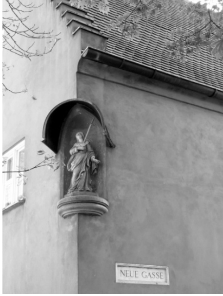
Figür.5. Neue G. köşesinde Dini Temsil