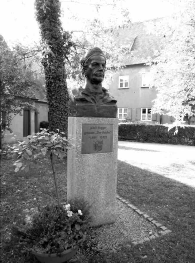
Figür 4. Jacob Fugger Büstü

Bu yerleşim, sekiz dar sokak ve bu sokaklara bakan bitişik düzende yanyana yerleştirilmiş iki katlı konut birimlerinden oluşmaktadır. Üç ana giriş kapısı üzerinde kurucu ailenin işaretini taşıyan armalar bulunur ve Fugger Ailesini hatırlatan pek çok sembol (Figür 4) yerleşimin duvarlarında, girişlerinde, meydanlarında yer alır. Benzer biçimde, bu alanın bir Katolik yerleşimi olduğunu anımsatan pek çok dini temsil de alan içinde yer alır (Figür 5), (Figür 6).