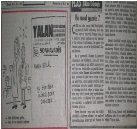
Resim 7: Havadis'in, Son Havadis gazetesini tenkit eden karikatürü, 9 Ocak 1961, s. 1.