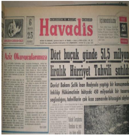
Resim 5: Havadis'in yayım politikasını değiştirmesinin gerekçelerinin izahı, Havadis, 21 Temmuz 1960. s. 1.