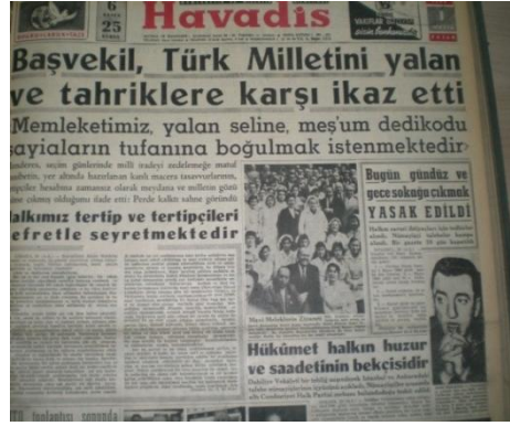
Resim 2: Başbakan Adnan Menderes'in yaptığı açıklamalar, Havadis, 1 Mayıs 1960, s. 1