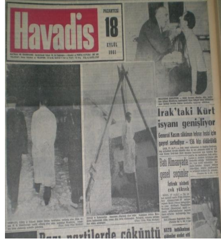
Resim 10: Adnan Menderes'in idamını gösteren haber, 18 Eylül 1961, s. 1.