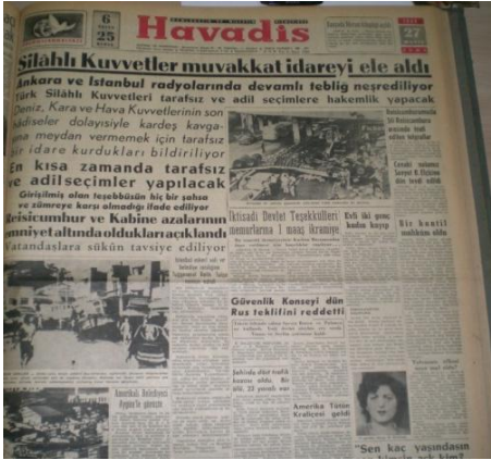
Resim 3: Silahlı Kuvvetlerin Yönetime El Koymasını Veren Haber, Havadis, 27 Mayıs 1960, s. 1.