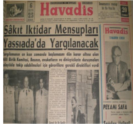
Resim 4: Demokrat Partililerin Yassıada'da yargılanacağını duyuran haber, Havadis, 20 Temmuz 1960, s.1