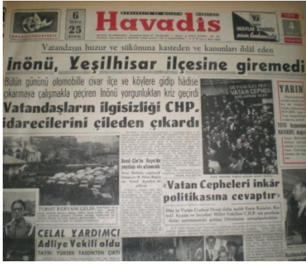
Resim 1: İsmet İnönü'nün Yeşilhisar ilçesine girememesini duyuran haber, Havadis, 4 Nisan 1960, s. 1.