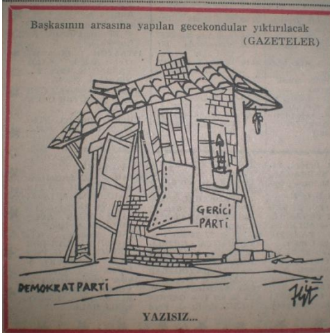
Resim 9: Demokrat Parti sonrası kurulan partilerin akıbetini gösteren karikatür, 26 Haziran 1961, s. 1.