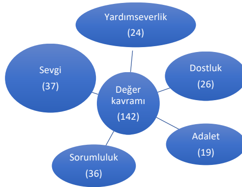
Şekil 1. ÇİF uygulaması öncesi değer algısı

Öğrencilerin cevaplarına bakıldığında saygı, sevgi, arkadaşlık ve adaletsizlik kavramları dışına çıkamadıkları görülmektedir. Öğrencilerin sınırlı kelime hazinesine sahip olmaları veya derinlemesine düşünme alışkanlığı elde edememiş olmalarının bu durumun sebeplerinden olabileceği düşünülmektedir. Aşağıdaki şekilde öğrencilerin ÇİF uygulamaları öncesindeki değer algıları görülmektedir.