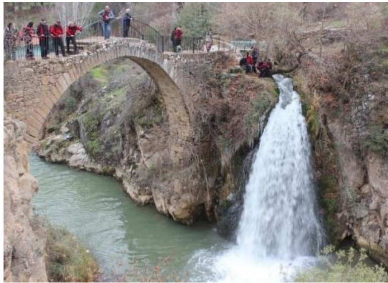
Resim 3: Tymion Antik Kenti

Uşak Karayakuplu'da William Tabbernee ve ekibi tarafından üç yıl süren kazılarda elde edilen buluntularda, Hristiyanlığın ilk mezheplerinden biri olan Montanizm'in Pepuza'da ortaya çıktığı ve komşu şehir olan Tymion'dan bahsedildiği belirtilmiştir. Uşak Müzesi'nde sergilenen, mermer üzerine yazılmış yazıtlardan birinde, imparatorun yüksek vergilere itiraz eden Tymion halkına "Vergilerinizi ödemek zorundasınız, bu vergiler yüksek değildir" şeklinde hitap ettiği aktarılmaktadır. Bu yazıttan yola çıkılarak yapılan yüzey araştırmaları sonucunda, daha önce Anadolu'nun farklı bölgelerinde aranan ancak yeri kesin olarak tespit edilemeyen Pepuza antik kentinin Karayakuplu köyü sınırlarında olabileceği basına yansımıştır. Aynı kazı çalışmaları sırasında tepe üzerinde derinliği nedeniyle kimsenin girmeye cesaret edemediği bir kral mezarı ile tapınak kalıntıları ve bu alanı birbirine bağlayan tüneller ortaya çıkarılmıştır. Bu tünellerde bulunan haç motifleri, bölgenin Hristiyanlar için kutsal bir mekân olabileceği olasılığını gündeme getirmiştir (Şişman, 2001: 5).