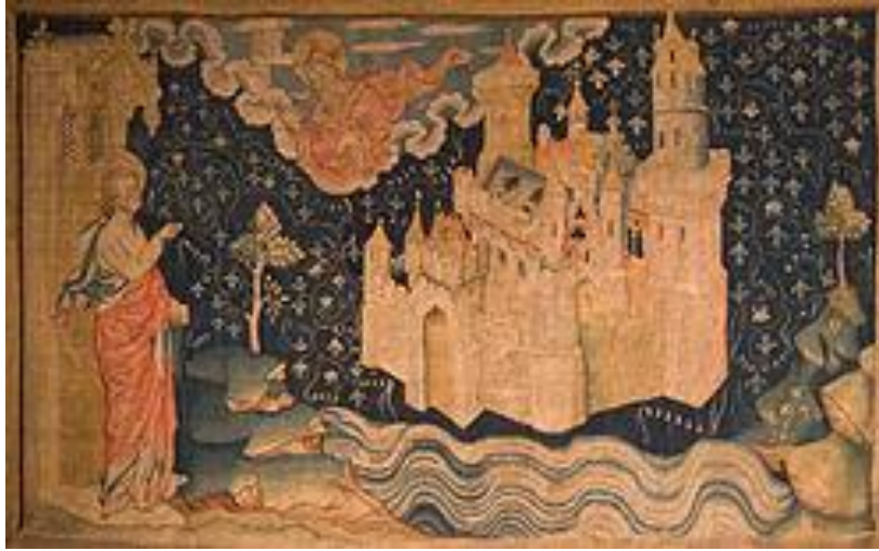
Resim 1. 14. yüzyıl Kanaviçesi üzerinde Yeni Kudüs