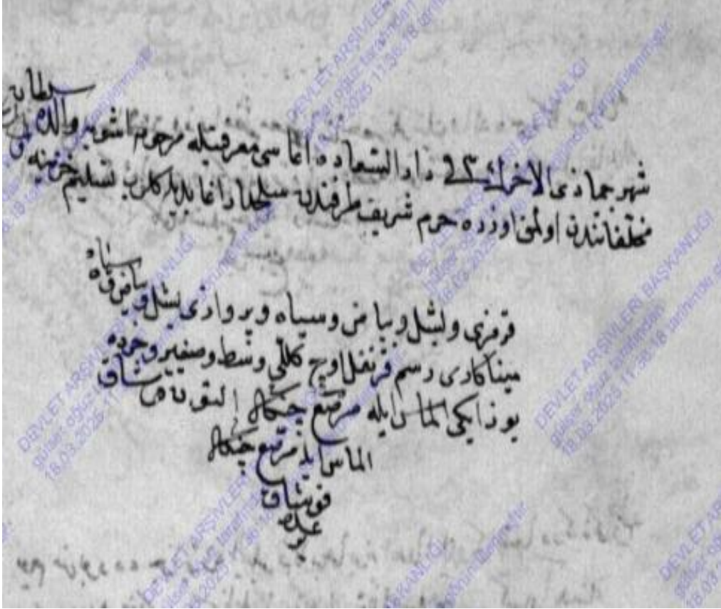
Görsel 3: 11a Sayfası

- Kırmızı ve yeşil ve beyaz siyah ve pervazları yeşil ve beyaz ve siyah minekari resm-i Firengil üç güllü vasat ve sagîr hurda 102 elmas ile murassa çengal altun kuşak aded bir