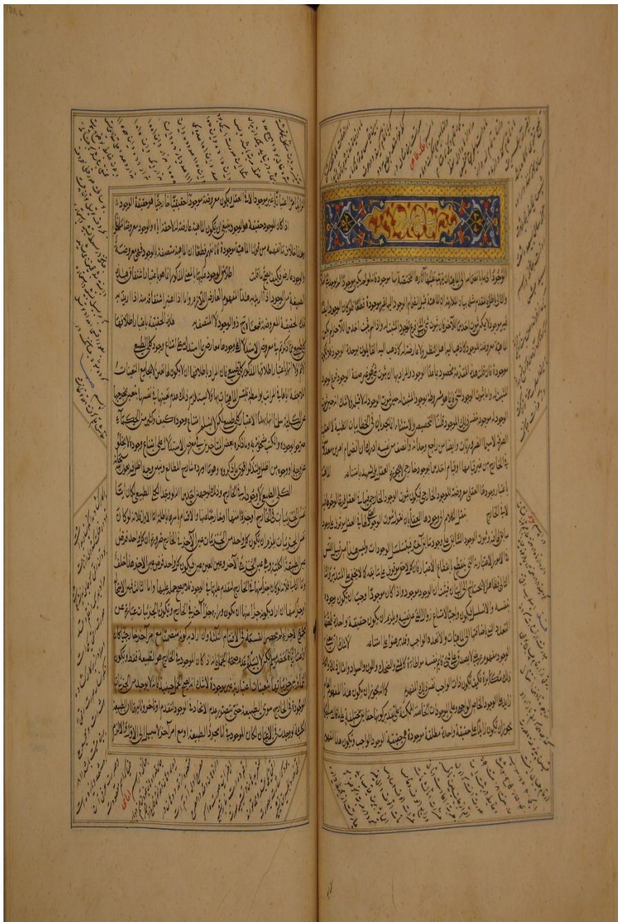
الصفحة الأولى من النسخة (ن)