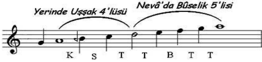
Şekil 1. Uşşak Makamı Dizisi