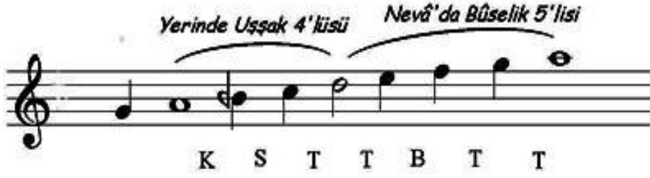
Şekil 2. Bayâti Makamı Dizisi