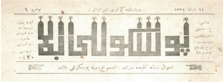
Görsel 1: Püsküllü Belâ'nın ilk sayısında dergi bilgilerinin ve serlevhanın bulunduğu kısım

Dergide "Ahvâl-i zamâne tenkîde sezâdır: İsmim o sebeble püsküllü belâdır" 13 serlevhası kullanılmaktadır. Bu anlamda derginin yayın amacının II. Meşrutiyetle ortaya çıkan basın özgürlüğünden faydalanarak gündeme taşıyacağı konularla ilgili eleştiride bulunmak olduğu anlaşılmaktadır. Derginin ilk sayfasında serlevhanın üzerinde kûfi yazı stiline benzer şekilde Püsküllü Belâ yazmaktadır. 14 Derginin imtiyaz sahibi olarak Hüseyin Hüsnü gösterilmektedir. 15 İdare adresine "Dersaadet, Ferah Bey Han, Numro 25" yazmaktadır. Derginin abone bedeli "Dersaadet 45 guruş, taşra 50 guruş" şeklinde belirlenmiştir. Nüshası ise ilk sayıda "30 para" iken sonraki sayılarda güncellenerek "20 para" olmuştur. İlk sayısı Matbaa-i Hayriye, 2 ve 3 numaralı sayısı Mahmud Bey Matbaası, sonraki sayıları ise A. Servişen Matbaası'nda basılmıştır.