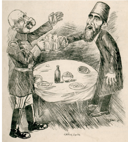
Görsel 6: "Yaşasın Protokol"

Osmanlı Devleti için olumsuz uluslararası konjonktüre karşı Avusturya-Macaristan'ın Bosna-Hersek'i işgali üzerine Osmanlı toplumunda tepki meydana gelerek Avusturya mallarına karşı boykot protestoları başlamıştır. Ekim 1908'de Tanin gazetesinde Hüseyin Cahid'in çağrısıyla başlayan boykotta özellikle de Avusturya'dan ithal edilen fes öne çıkmıştır. İlerleyen süreçte boykot uygulanan malların sayısı artmıştır. Avusturya menşeli ürünlerin alımının durmasıyla Avusturya-Macaristan İmparatorluğu boykotun sona erdirilmesi için girişimlerde bulunmuşsa da Osmanlı toplumunda boykot çağrıları ve uygulaması devam etmiştir. 46 Boykot meselesi de Püsküllü Belâ'nın dikkat çektiği konular arasında yer almaktadır. 47 Ancak 26 Şubat 1909'da İstanbul'da Osmanlı ile Avusturya-Macaristan yetkilileri arasında bir protokol imzalanmış ve Bosna-Hersek'in işgal edildiği ekim ayından bu yana devam eden boykot sona ermiştir. Püsküllü Belâ ise taraflar arasında imzalanan protokolü ve boykotun sona ermesini eleştirmiştir. Konuyla alakalı örneklem aşağıdaki karikatürdür: