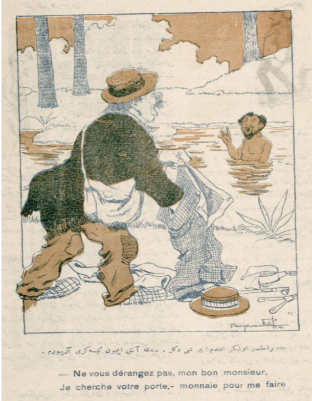
Görsel 2: “Rahatsız olmayınız efendim! Bir şey değil. Sadaka almak için kesenizi arıyorum.”

Püsküllü Belâ'nın önemli bir özelliği her sayısında birçok karikatürün yer almasıdır. Dergide toplam otuz dört karikatür bulunmaktadır. Bu karikatürlerin bazıları dergi içeriğindeki makale ve haberlerle ilgiliken bazıları ise bağımsız konulardadır. Karikatürler derginin 1, 4, 5 ve 8 numaralı sayfalarında bulunmaktadır. 5. sayıdan itibaren renkli karikatürler de yayımlanmaya başlamıştır. 16 Bu karikatürlerin otuz bir tanesi imzalı olarak Mehmed Fazlı tarafından çizilmiştir. Püsküllü Belâ'da dikkat çeken bir diğer unsur ise 5, 6 ve 7 numaralı sayılarında Mehmed Fazlı dışında Fransız mizah dergisi Le Rire gibi popüler dergilerde çizimleri yayımlanan Benjamin Rabier'in karikatürlerine de yer verilmesidir. Dergide üç tane Rabier imzalı karikatür bulunmaktadır. Bunlardan biri aşağıdaki karikatürdür. 17