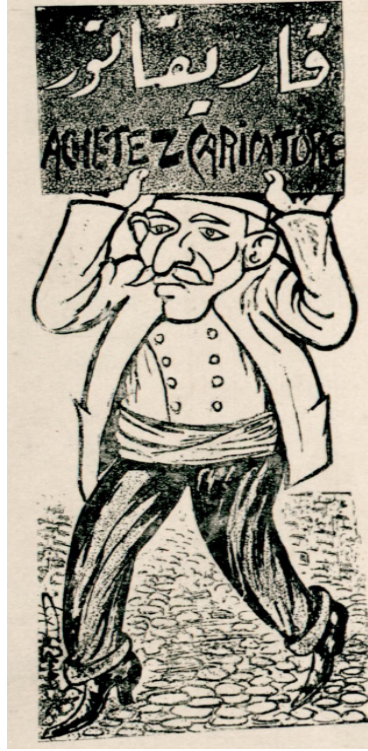
Görsel 3 : Karikatür kitabının tanıtım reklamı

(Püsküllü Belâ, S. 5, 11 Mart 1325, s. 7.)