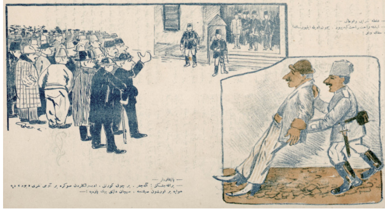
Görsel 7: “-Galatasaray Vukati-

-İşte rahat rahat gidiyor. Niçün öyle itiyorsun? Ne hakkın var!