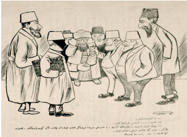
Görsel 4: “(Adada gazeteci)

Bu başlıkla ilgili seçilen amaçlı örneklem aşağıdaki karikatürdür: