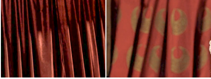
Resim 3. Divan Odasındaki Perdelerden Detaylar (Aksoy, 2012).

Osmanlı dönemini simgeleyen en önemli unsurlardan biri ipekli kumaşlardır. Fiziki bir örnek üzerinden inceleme yapılmadan kesin bir yargıya varmak mümkün olmasa da perdelerde ve tahtın döşemeliğinde kullanılan kumaşların parlaklığı, Osmanlı devlet törenlerinde ve yüksek sınıf kültüründe sembolik değeri olan ipekli kumaşları andırmaktadır (Görsel 2, 3).