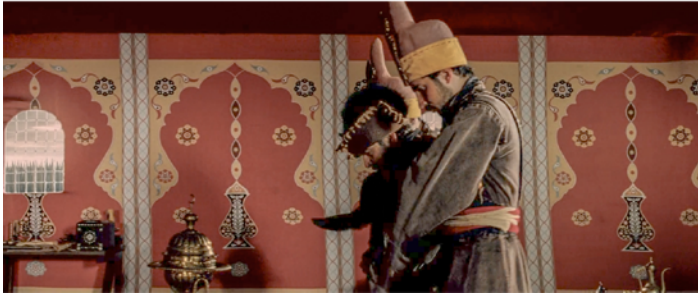
Resim 9. Savaş Zamanlarında Ordugaha Kurulan Çadırların İç Mekanları (Aksoy, 2012).

Mekanda bulunan tekstiller çadır duvarlarını örten zokaklar, perdeler, duvar örtüsü, yastıklar ve kostümlerdir. Sahnede en dikkat çekici tekstil ürünü zokaklardır. Zokakların yüzey tasarımlarına bakıldığında mimari özellikler göze çarpmaktadır. Kompozisyonun üst kısmında kıvrımlı kemer yer almakta, kemerin en üst noktasından bir kandil sarkmaktadır. Kandilin iç yüzeyi simetrik bir kompozisyonla stilize çiçekler ve yapraklar ile doldurulmuştur. Kandilin sağında ve solunda sekiz yapraklı stilize çiçekler ve rumiler görülmektedir. Zokaklarda ise kırmızı ve sarı renk baskındır.