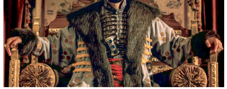
Resim 4. Kaftandan Detay Görüntüsü (Aksoy, 2012).

Birol ve Derman, 2022, s. 169) düşünüldüğünde karakterin otoritesini ve hükümdarlığının meşruiyetini sembolize ettiği söylenebilir.