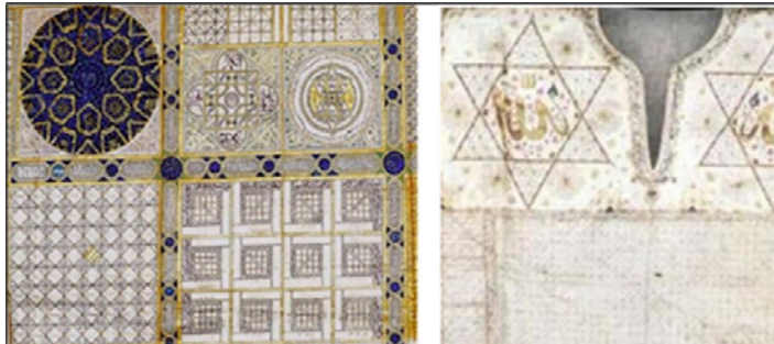
Resim 7. (a) Cem Sultan'a Ait Tılsımlı Gömlek (Tezcan, 2011). (b) 16. ve 17. Yüzyıla Tarihlenen Tılsımlı Gömlek (Tezcan, 2011). (c) 16. Yüzyıla Ait Tılsımlı Gömlek (aktaran Üneş, 2019).

Tılsımlı gömleğin tasarımındaki yaklaşım hem Fetih 1453 filmdeki tekstillerin tasarım süreci hem de daha geniş bir perspektifte bir tarihsel filmdeki sanat yönetimi hakkında fikir vermektedir. Filmdeki gömleğin yüzey tasarımının, 15. yüzyılda Cem Sultan için hazırlandığı bilinen (Görsel 7-a), 16. ve 17. yüzyıllarda üretilen (Görsel 7-b, c) 3 tılsımlı gömleğin yüzey tasarımlarının desen özellikleri kullanılarak oluşturulduğu görülmektedir.