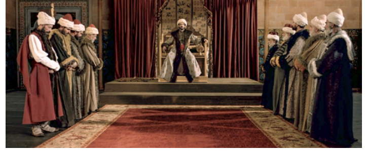
Resim 1. Divan Toplantısı Sahnesi (Aksoy, 2012).

İncelenen ilk örnekte Mehmet karakterinin padişah oluşundan sonra Divan-ı Hümayun üyeleri ile yaptığı ilk divan toplantısının temsil edildiği sahne görülmektedir (Görsel 1).