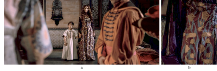
Resim 8. (a) Gülbahar Hatun Karakterinin Kostümü. (b) Kostümün Yüzeyindeki Motiflerin Detayı (Aksoy, 2012).

Aynı sahnede, Gülbahar Hatun karakterinin giydiği kostüm detaylarının (Görsel 8-a) bazı anakronizmler içerdiği gözlemlense de işlevsel yönünün olduğu söylenebilir. Kostümün kumaşında koyu renk zemin üzerinde kontrast oluşturan, altın sarısı renklerde yaprak ve taç motifleri görülmektedir (Görsel 8-b). 15. yüzyılda görülmeyen taç motiflerinin kullanımı, karakterin statüsünü ve asaletini sembolize etmesi amacıyla bilinçli olarak tercih edilmiş olabilir.