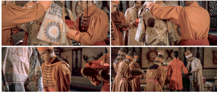
Resim 6. Padişaha Savaş Kıyafetlerinin Giydirildiği Sahne (Aksoy, 2012).

padişaha savaş kıyafetlerinin giydirildiği bir ritüel temsil edilmektedir (Görsel 6). Sahnede dönemle ilişki kurulması açısından öne çıkan tekstil ürünü film için tasarlanan tılsımlı (şifalı) gömlektir. Tılsımlı gömlekler, Osmanlı kültüründe hükümdarlar ve yöneticiler tarafından koruma ve savaş zaferi sağlamak inancıyla kullanılmıştır (Üneş, 2019, s. 10). Sahnede gömleğin kullanımı, koruma ve güç sembolü, görsel odak noktası ve anlatının tarihsel ve kültürel bağlamını pekiştiren bir öge olarak çok katmanlı bir rol oynamaktadır.