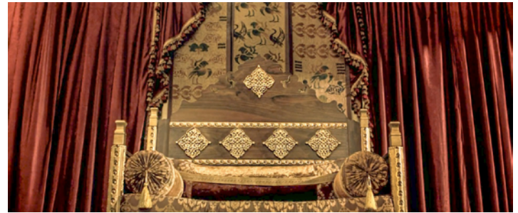
Resim 2. Divan Odasındaki Tahtın Döşemeliklerinden Detaylar (Aksoy, 2012).

Sahnede, kumaş yüzeyleri görülen tekstil ürünleri; perdeler, döşemelikler, yastıklar, duvar örtüsü ve karakterlerin kostümleridir. Sahnenin odak noktasında kırmızı renkli duvar perdeleri ve tahtın tam arkasına konumlandırılmış duvar örtüsü yer almaktadır. Örtünün yüzey tasarımında serbest düzende yerleştirilen lacivert ve koyu kahverengi renklerde tavus kuşu ve çift başlı kartal motifleri bulunmaktadır. Tahtın döşemeliği ve yastıkları yeşil renk zemin üzerine altın sarısı motiflerle bezeli ipekli kumaş görünümündedir (Görsel 2). Divan üyelerinin arkasında kalan pencere perdelerinde ve döşemeliklerde, kırmızı renk zemin üzerine üst üste sıralı düzende altın sarısı hilal motifleri yer almaktadır (Görsel 3). Sultan'ın giydiği açık mavi tondaki kaftan, altın işlemeli Çintemani motifleri ile bezelidir (Görsel 4). Divan üyelerinin kostümlerindeki kumaş yüzeyleri koyu renklerde sade görünümündedir. Yaka kenarları ve kol ağızları kürklüdür.