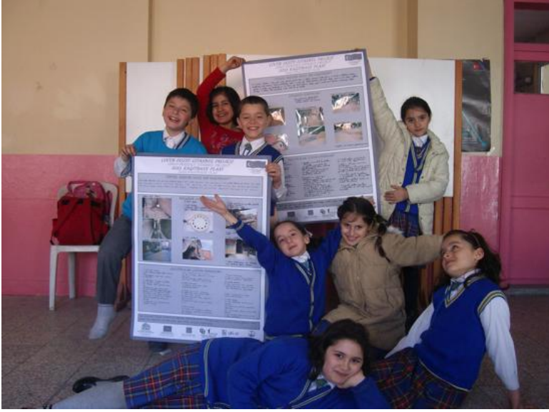
Resim 3: Mahalle planlama atölyesi etkinliğinden bir fotoğraf

Mahalle planlama atölyelerinin son buluşmasında çocukların ilk buluşmada ifade ettikleri vizyon cümleleri, belirlenen mekânsal sorun tanımları ve üretilen çözüm önerileri çocukların çekmiş oldukları fotoğraflarla birlikte gruplara geri dağıtılmıştır. Daha sonra her gruba hazırlanmış olan altlık afişlerden biri dağıtılmış ve grupların bu altlık afişi sahip oldukları fotoğraflarla ve yazılarla doldurmaları istenmiştir (bkz. Resim 3). Çalışma sonunda yazar elde edilen verileri içerik analizi yapmak üzere Excel ortamına dökmüştür.