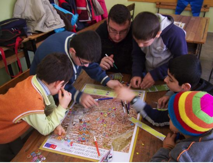
Resim 1: Haritalama etkinliğinden bir fotoğraf

varsa nereler? (2) Niçin oraya gitmeye korkuyorsun veya orayı sevmiyorsun veya hoşlanmıyorsun? Çocuklar cevaplarını bir önceki süreçte olduğu gibi konuşarak ve kendilerini çıkartmalarıyla afiş üzerinde ifade ederek vermişlerdir. Oturum yöneticileri, bir önceki afiş sürecinde olduğu gibi çocuklar takıldıkça çocukları konuşurmak için çeşitli ilave sorular sormuşlardır: 'Okula nereden gidiyorsun?' 'Niçin örneğin bu kestirme yolu almıyorsun? Yoksa o yolda hoşlanmadığın bir şey mi var?' 'Dışarda top oynarken canını sıkkan şeyler oluyor mu?' 'Mezarlığa gitmeyi sevmediğini söylemiştin, peki ama neden?' (bkz. Resim 1).