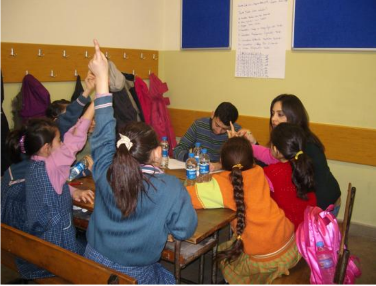
Resim 2: Grup söyleşisi etkinliğinden bir fotoğraf

Grup söyleşisi çalışmasına toplam 205 çocuk katılmıştır. Çalışmaya katılan çocuk sayısı seçilen her alan için şu şekildedir: Merkez, Kağıthane: 30; Talatpaşa, Kağıthane: 43; Çeliktepe, Kağıthane: 32; Cibali, Fatih: 34; Ayazma, Üsküdar: 20; Galata, Beyoğlu: 46. Çocuk katılımcı sayısının bazı okullarda 40'ın çok altına düşmesinin nedenlerini yazar ayrıntılı olarak başka bir yazısında açıklamıştır (lütfen, bkz. Severcan, 2015a). Çalışma sonunda yazar elde edilen verileri içerik analizi yapmak üzere Excel ortamına dökmüştür. Yazar, bu makalenin amacı doğrultusunda sadece 3. Soru olan çocukların 'çocuk dostu şehir' kavramına verdikleri tanımlar ile 4. Soru olan çocukların mahallelerini çocuk dostu olarak görüp görmedikleri (ve bunun nedenleri üzerine odaklanmıştır).