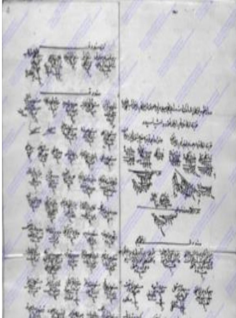
Ek-1: Arabacı Ali Paşa'nın Edirne Sarayı'nda Tahrir Edilen Muhallefatı (BOA. TS.MA.d, 2632)