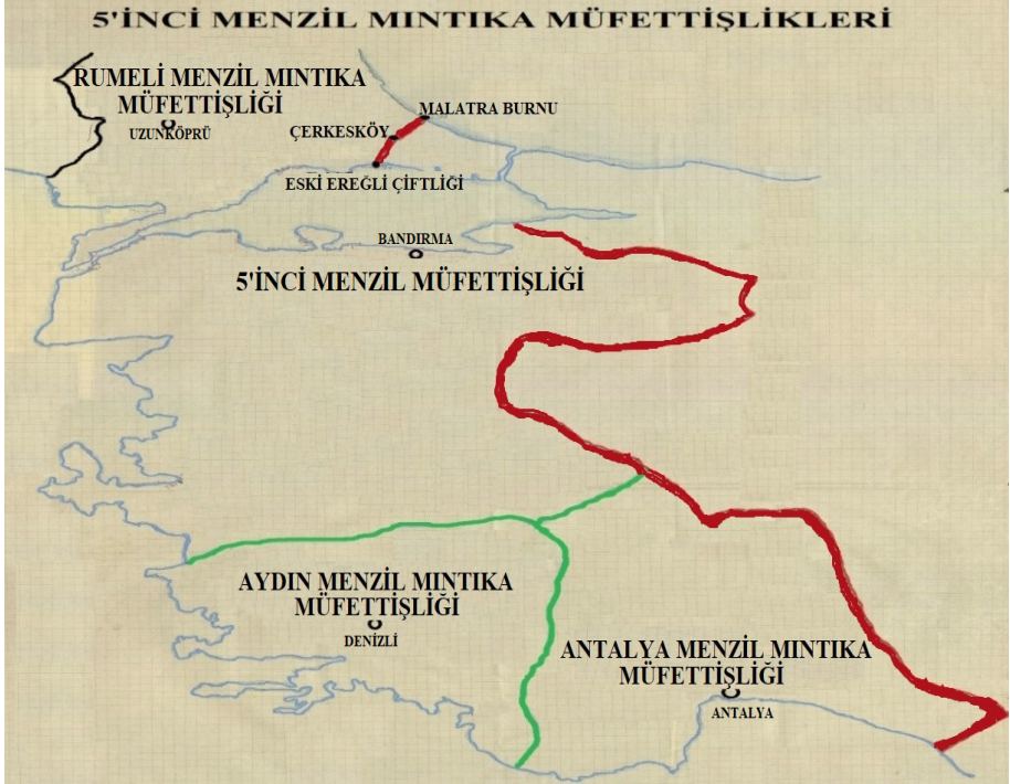
Harita 3. 5'inci Menzil Mıntika Müfettişliklerinin Sınırları

Anadolu yakasında bulunan müesseselerin büyük bir kısmı doğrudan 5'inci Menzil Müfettişliğinin emrine verildi. Bu müfettişliğin karargâh merkezi ise Bandırma kazasıydı. 5'inci Menzil Müfettişliğinin bünyesinde şu müesseseler yer alırdı 81 .