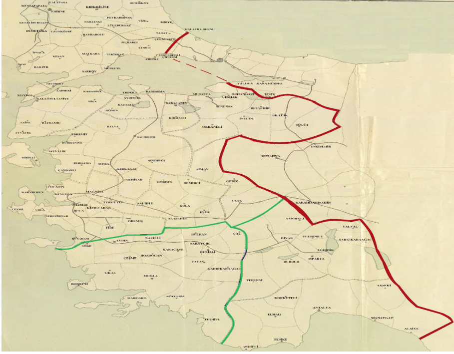
Harita 2. 5'inci Ordu Menzil Hududunun Sınırları

Görüldüğü üzere Trakya, Marmara ve Ege bölgesi gibi ülkenin tarım bakımından en verimli, toprakları 5'inci Menzil bölgesi içinde yer aldığı gibi ulaşırma, ticaret, sanayi ve iktisadi bakımdan ülkenin en gelişmiş bölgeleri yine 5'inci Ordu Menzil Müfettişliğinin sınırları içerisinde yer alırdı 35 . Ayrıca Çanakkale boğazı ve Marmara Denizinin bu müfettişliğin sınırları içerisinde olması, muharip ordunun lojistik ihtiyaçlarının temini kadar bu ihtiyaçların orduya ulaştırılmasında büyük kolaylık sağladı 36 .