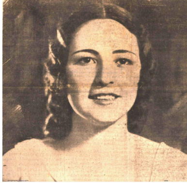
Türkiye ve Dünya Güzeli Keriman Halis, Cumhuriyet, 1 Ağustos 1932, s.1

berler yapmaya başlamış ve bu konuda bir kamuoyu oluşturmaya çalışmıştı. Örneğin, 5 Şubat'taki haberinde dünya güzellik yarışmalarından söz eden gazete "Türk kadınları en güzel kadınlardan mabuttur" ifadesiyle Türk kadınlarının bu yarışmalarda boy göstermesi gerektiğini yazmıştı 72 . Ertesi gün ise "Türkiye'nin en güzel kadını kimdir: Türkiye'nin güzellik kraliçesini bulmaya karar verdik" haberine yer veren gazete Türkiye'nin güzellik Kraliçesinin Amerika'da yapılacak beynelmilel yarışmaya iştirakini temin edecektir sözleriyle yarışmaya katılımı teşvik etmeye çalışıyordu 73 . Nihayet gazete Ağustos ayından itibaren kesin olarak bir güzellik yarışması düzenleyeceğini duyurmuş ve bu amaçla ilanlar yayınlarak kadınları bu yarışmaya katılmaya davet etmişti. Örneğin, 15 Ağustos'ta "Güzellik Müsabakamız: Filmin alınması 22 Ağustos Perşembe günü bitiyor, güzeller istical ediniz" başlıklı yazısında Cumhuriyet, Türk kadınlarını yarışmaya katılmaya davet ediyor ve halihazırda fotoğraf çektirerek yarışmaya dahil olan kadınların fotoğraflarını manşetten yayınlıyordu 74 . Ayrıca gazete "onlar mı güzel bizimkiler mi?" türünden manşetlerle Türk kadınlarının Avrupalı kadınlardan daha güzel olduğuna yönelik yazılar yazıyor ve yarışmaya katılımı teşvik etmeye çalışıyordu 75 . 2 Eylül 1929 yılında gerçekleştirilen yarışmaya çok sayıda Türk kadını katılmış 76 yarışmanın birincisi Feriha Tevfik Hanım, ikincisi Semine Hanım, üçüncüsü Araksi Çetiniyan olmuştu 77 .