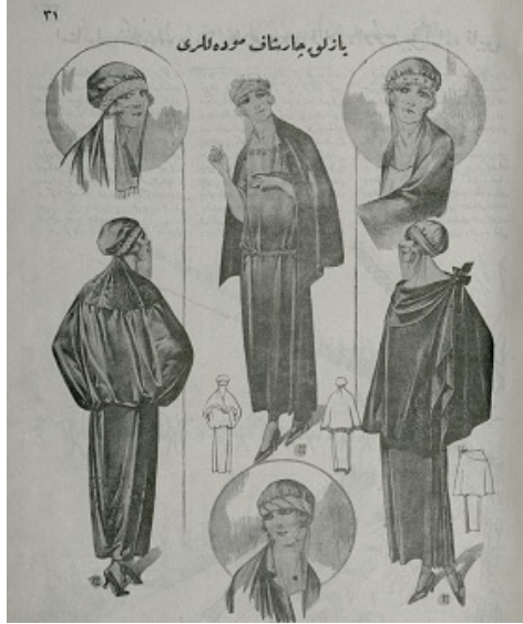
Resimli Ay dergisinde Mayıs 1924'te yayınlanan bir görsel, s.31 “yazlık çarşaf modelleri”. Peçenin değişime uğramış hali, “Yazlık çarşaf modelleri”, Resimli Ay , Mayıs 1340, s.31.

Kadının özellikle basında görsellik üzerinden fazlasıyla ön plana çıkmaya başladığı bu sürece ilişkin Cumhuriyet yönetimi bazı uyarılar yapmaktan da geri durmamıştır. Mustafa Kemal bu süreçte sıklıkla kadınların sadece görsel olarak değil aynı zamanda zihinsel olarak da ön plana çıkması gerektiğini vurgulamıştır. Atatürk'e göre kadın sadece görsel olarak değil aynı zamanda zihinsel olarak da donanımlı ve güzel olmalıydı. Bu konuda 1923 yılında şunu dile getirmişti. “Kadınlık meselesinde şekil ve dış görünüşü ikinci derecedir. Asıl mücadele sahası, kadınlarımız için şekilde ve kıyafette başarıdan çok, asıl başarılı olunması gereken saha (kadınların) nur ile irfan ile gerçek fazilet ile donatılmasıdır.” 69