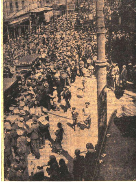
Keriman Halis 'i taşıyan otomobil Sirkeci'den geçerken, Cumhuriyet , 1 Eylül 1929.