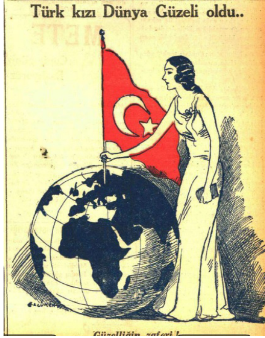
Cumhuriyet, 3 Ağustos 1932, s.1.

Kadının erkekle eşit seviyeye getirilme girişimlerinin cumhuriyetin her alanda çağdaşlaşmayı hedeflediği ve Batı'dan geri olunmadığının ispatlanmaya çalışıldığı bir atmosferde gerçekleştirilmeye çalışıldığını unutulmamalıdır. Dolayısıyla dünya güzellik yarışmasında elde edilen birinciliğe yönelik sözünü ettiğimiz “kutlamaları” ayrıca bu açıdan değerlendirmek de gerekmektedir. Nitekim üstte yer alan ve Cumhuriyet gazetesinde yayınlanan resim, güzellik yarışmasında kazanılan birinciliğin aynı zamanda milli özgüvene de ciddi katkı sağladığını ya da bunun amaçlandığını gösteriyor.