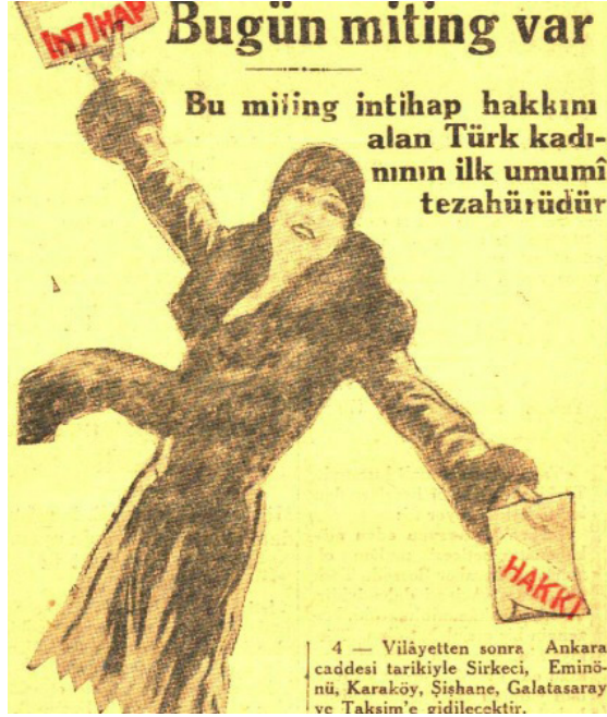
“Kadınlar bugün miting yapıyor”, Cumhuriyet , 11 Nisan 1930.

seçim meselesinde, başlıca münakaşa zeminini teşkil etmektedir. Bu prensibe göre en büyük kuvvet, en büyük cebir kuvvetinden başka bir mana ifade etmiyor, diyenler ve bu manada eşitsizlik görenler vardır. Seçimde adalet ve eşitliği sağlamak için düşünülen ve bazı memleketlerde tatbik olunan çare, nispi temsil usulüdür” 106