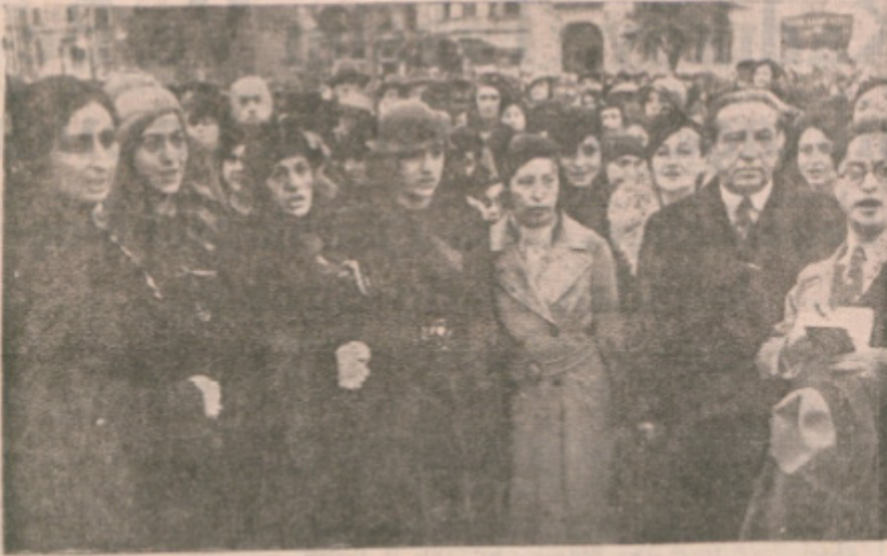
Dünkü bayramdan bir görünüş

Binlerce Kadın, Yüce Önder Atatürke Şükran Hislerini Sundular