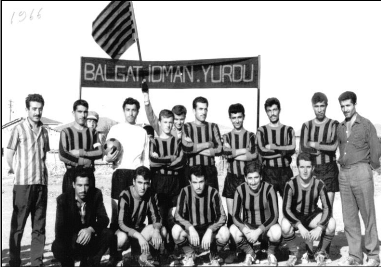
Balgat İdman Yurdu oyuncuları ve yöneticiler (1966)