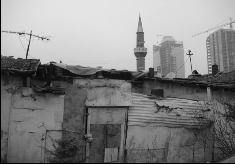
Yıkık evler ve ticarî dönüşüm

ğü, duvarları kilimlerle süslü Çağlar Oyun Salonu arasındaki uzaklık, herhalde Lerner'ın kafasını hayli karıştırdı.