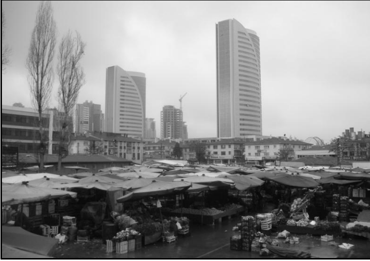
Balgat Pazar yeri ve fonda yükselen gökdelen silueti

içinde görece daha bütünleşik bir yapı sergileyen bu yerlerden farkı, kent merkezine fiziksel yakınlığın verdiği olanakla, konut alanı olmaktan çok giderek bir iş merkezine dönüşüyor olmasıdır.