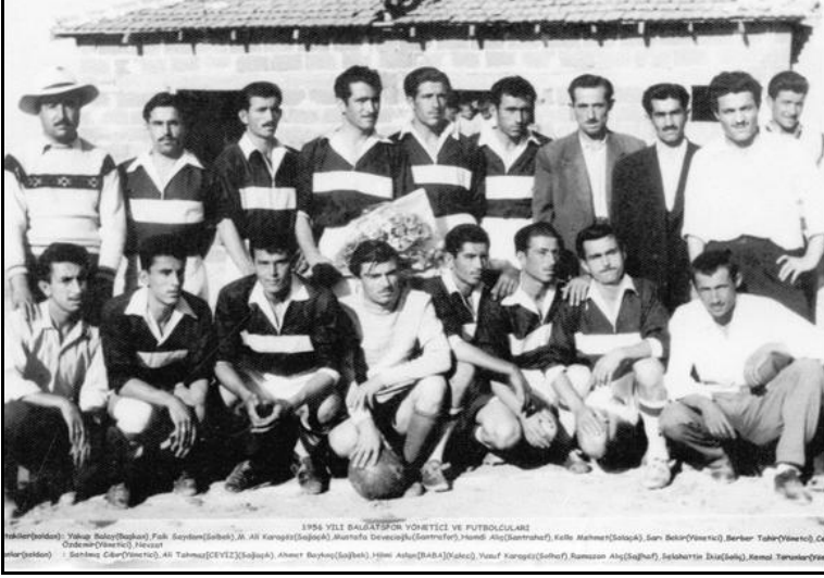
Balgatspor yöneticileri ve oyuncular (1956)

amacıyla 1947 yılında ABD ile imzalanan askerî yardım anlaşması uyarınca oluşturulan ABD askeri misyonu 9 Balgat'a taşınır (Bernath, tarihsiz: 6).