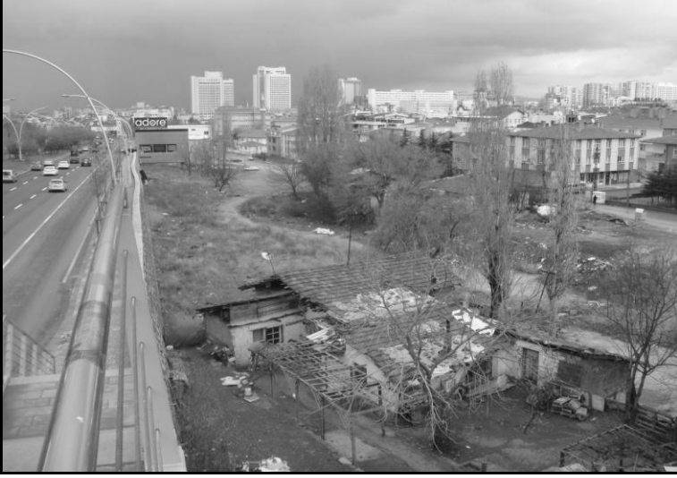
Gecekondu ve arkada yükselen kamu binaları