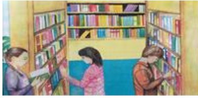
Görsel 15. Kütüphane metninde yer alan görseller

Kütüphane metni iki sayfaya bölünmüş birinci sayfada görsel bulunmamaktadır. İkinci sayfada metnin üstünde bir görsel yer almaktadır (Görsel 15). Görselde kitaplarla dolu raflar ve kitapları inceleyen üç kişi bulunmaktadır. Raflardaki kitaplar rengârenk düzenlenmiştir.