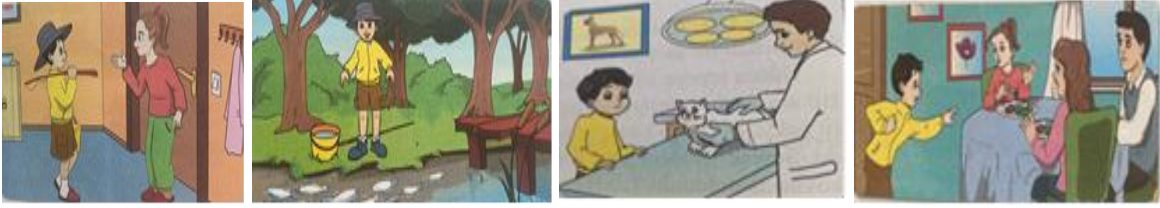
Görsel 2. Yalancının Mumu metninde yer alan görseller

2. sınıf BKY kitabında “Erdemler” temasında yer alan metin “Yalancının Mumu” isimli hikâye edici metindir. Metin üç sayfaya bölünmüş; ilk iki sayfada birer görsel, son sayfada iki görsel yer almıştır (Görsel 2). Birinci sayfada metnin altında yer alırken, ikinci sayfada metnin ortasında, son sayfada ise görselin biri sağ üst köşede, diğeri yine metnin ortasında yer almaktadır.