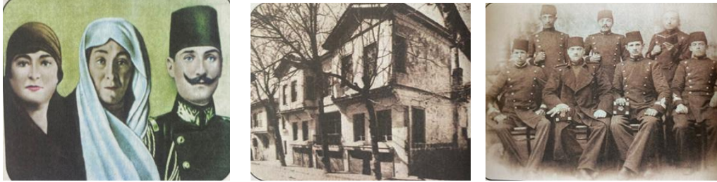
Görsel 3. Ata'nın Yaşamı metninde yer alan görseller

Millî Mücadele ve Atatürk metni iki sayfaya bölünmüştür. İlk sayfada sağ üst köşede Atatürk’ün annesi, babası ve kız kardeşinin olduğu bir fotoğraf yer almaktadır (Görsel 3). İkinci sayfada ise yine sayfanın sağ üst köşesinde siyah beyaz Atatürk’ün doğduğu ev olabileceği düşünülen bir ev fotoğrafı yer almaktadır. Sayfanın sağ alt köşesine ise askeri üniformalı Atatürk ve arkadaşlarına ait siyah-beyaz bir fotoğraf yerleştirilmiştir.