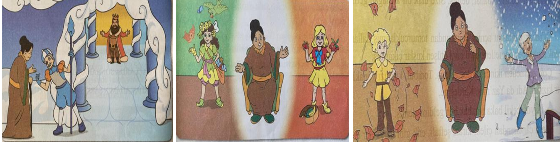
Görsel 8. Dört Mevsim metninde yer alan görseller

Metin üç sayfaya bölünmüş ve her bir sayfada birer görsel yer almaktadır (Görsel 8). Birinci sayfada görsel metnin üstüne, ikincide altına ve son sayfada ise metnin ortasına yerleştirilmiştir. Birinci görselde kahverengi elbiseli bir kadının Buzlar Kralı'nın evine gittiği düşünülüyor. İkinci görselde ise aynı kadının yanında iki tane kız çocuğu var. Bu çocuklardan birinin sepeti çiçeklerle dolu, diğerinin ise sepetinde ve elinde meyveler var. Üçüncü görselde iki erkek çocuğu: birinin etrafında yapraklar, diğer çocuğun etrafında kar taneleri uçuşuyor.