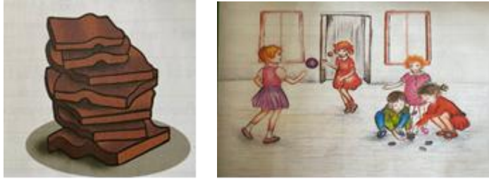
Görsel 13. Tombik metninde yer alan görseller

Tombik metni iki sayfaya bölünmüştür ve her sayfada metnin altında birer görsel yer almaktadır (Görsel 13). Birinci görselde üst üste dizilmiş yedi adet taş bulunmaktadır. İkinci görselde oyun oynayan beş çocuk, bunlardan üç tanesi taşla oynarken diğer ikisi top ile oynamaktadır. Görsellere bakıldığında, metnin çocuk oyunlarını anlattığı düşünülmektedir. Metinde ise tombik oyunu ve nasıl oynandığı anlatılmaktadır. İkinci görselde çocuklar aynı oyunu değil de iki farklı oyunu oynuyormuş gibi görünmektedir.