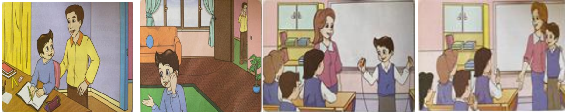
Görsel 12. Bir Telefon Yaptık metninde yer alan görseller

Bir Telefon Yaptık metni dört sayfaya bölünmüş ve her sayfada bir görsele yer verilmiştir (Görsel 12). İlk sayfada görsel metnin üstünde, ikinci ve üçüncü sayfada görsel metnin altında, son sayfada ise metnin ortasında yer almaktadır. Birinci görselde masasında ders çalışan bir çocuk ve yanında ayakta duran babası olabileceğini tahmin ettiğimiz bir adam resmedilmiştir. İkinci görselde baba ve çocuğun biri odanın içinde, diğeri kapının dışında, ip ile birbirine bağlı birer kutuyu kulaklarına tuttuğu görülmektedir. Üçüncü görselde çocuk ip ile birbiriyle bağlı iki kutuyu sınıfa getirmiş, öğretmenine ve arkadaşlarına bir şeyler anlatmaktadır. Son görselde ise çocuğun sınıf arkadaşlarının onu alkışladığı görülmektedir.