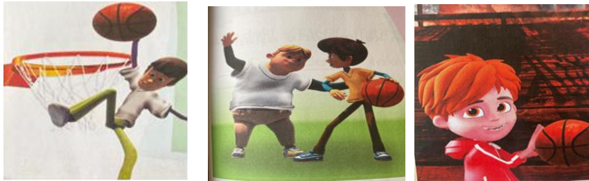
Görsel 9. Ve Basket metninde yer alan görseller

Basket metni iki sayfaya bölünmüştür ve ilk sayfada sayfanın sol alt köşesinde bir görsel, ikinci sayfada ise sol üst köşede bir görsel, sağ alt köşede bir görsel konumlandırılarak metinler görsellerin yanlarına farklı renk zeminli kutular içine siyah yazılarla yerleştirilmiştir (Görsel 9). Birinci görselde çocuklar tarafından izlenen ve sevilen Rafadan Tayfa çizgi filminin kahramanı olan uzun boyu ile tanınan Kamil karakterini bir basket potasından basketbol topu ile basket atarken görmekteyiz. İkinci görselde ise yine aynı çizgi film karakterlerinden olan kısa ve kilolu olan Hayri ve kısa boylu olan Akın karakterlerini basketbol oynarken görmekteyiz. Son görselde ise elinde basketbol topu olan bir erkek çocuğunun görseli yer almaktadır.