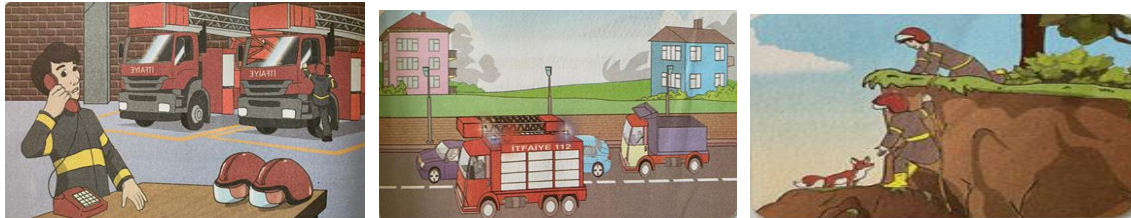
Görsel 14. İtfaiyeciler Göreve Gidiyor metninde yer alan görseller

İtfaiyeciler Göreve Gidiyor metni iki sayfaya bölünmüştür. Birinci sayfada resmin altında bir görsel, ikinci sayfada metnin üzerinde ve sağ tarafında bir görsele yer verilmiştir (Görsel 14). Birinci görselde iki itfaiye aracı vardır. Telefonda konuşan yüzünde şaşkın bir ifade olan bir itfaiyeci ile itfaiye aracına binmeye çalışan bir itfaiyeci resmedilmiştir. İkinci görselde yolda giden bir itfaiye aracı ve ona yol veren üç araç vardır. Üçüncü görselde itfaiyeciler uçuruma düşmüş bir tilkiyi kurtarmaya çalışıyorlar. İtfaiyecilerden birisi yukarıda, diğeri aşağıda ve uçurumdan bir ip sarkıtılmış olarak görünmektedir.