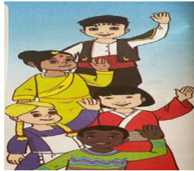
Görsel 6. 23 Nisan Günü metninde yer alan görseller

23 Nisan Günü Şiiri bir sayfada konumlandırılmıştır. Gökyüzü görüntüsü veren mavi bir zemin üzerine sol tarafa beyaz zeminli çerçeve içinde şiir yerleştirilmiş, hemen şiirin sağ tarafında ise beş tane farklı ırklardan olduğu görülen çocuk resmi yer almaktadır (Görsel 6). Görselde el sallayan mutlu çocuklar resmedilmiştir.