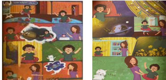
Görsel 7. Uzay Kaşifi Gökay metninde yer alan görseller

Uzay Kaşifi Gökay metni iki sayfaya bölünmüştür. Her iki sayfada da sayfayı kaplayan görseller yer almaktadır (Görsel 7). Metin bu görsellerin üzerine yerleştirilmiştir. Ve kahramanlarımız olan anne ve çocuğun karşılıklı konuşmaları konuşma balonları şeklinde düzenlenerek metin sunulmuştur. Birinci sayfada yedi tane, ikinci sayfada altı tane görsel birbiri ardına sıralanarak sunulmuştur. Metindeki konuşmanın görsellerde yer alan yerdeki oyuncaklar ve kitaplıktan yola çıkarak çocuk odasında geçtiği anlaşılmaktadır. Birinci görselde beline deniz simidi takmış bir çocuk, ikinci görselde kapıda annenin belirmesi ve çocuğun suratındaki şaşkın ifade dikkatimizi çekmektedir. Üçüncü görselde çocuğun hayalinde halkalı bir gezegen beliriyor. Dördüncü, beşinci ve altıncı görselde çocuğun anneye bir şeyler anlattığı görünüyor. Sayfanın son görselinde ise annenin de zihninde halkalı bir dünya görseli canlanıyor. İkinci sayfanın ilk görselinde yine çocuk bir şeyler anlatıyor ve yanında üzerinde küçük dinazorların ve taş parçalarının olduğu halkalar var. Diğer görselde, güneş, ay ve halkalı bir dünya resmedilmiş; güneşten gelen ışıklar halkalara çarparak dünyaya ulaşıyor. Konuşmaya devam eden anne ve çocuğun yanında bu defa solmuş bitkiler görseli mevcut. Sayfanın sonunda ise mutlu anne, çocuk ve kedi görseli yer almaktadır.