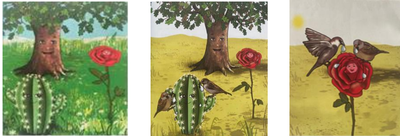
Görsel 1. Gururlu Gül metninde yer alan görseller

Gururlu Gül metni dört sayfaya bölünmüş; ilk sayfada görsel kullanılmamış, diğer sayfalarda birer görsel kullanılmıştır (Görsel 1). Görseller metnin altında yer almıştır.