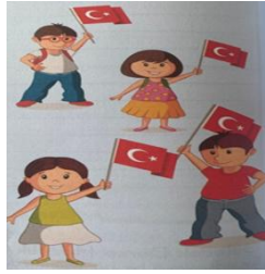
Görsel 5. Dünya ve Çocuk metninde yer alan görseller

Dünya ve Çocuk Şiiri bir sayfada düzenlenmiştir. Açık mavi bir zemin üzerine sol tarafa şiir yerleştirilirken, sağ tarafa ellerinde Türk bayrağı olan mutlu iki kız ve iki erkek çocuk görseli yerleştirilmiştir (Görsel 5). Görselde yer alan Türk bayrağı, milli bir bayram havası verdiği için metnin içeriğini karşılamaktadır ve metnin içeriğiyle uyumludur. Yine görseller metnin konusunu tahmin etme konusunda uygundur.