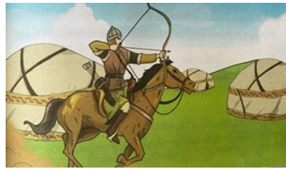
Görsel 10. Okçuluk metninde yer alan görseller

Görsellere baktığımızda, ilk görselden günümüzde, ikinci görselde ise geçmiş zamanlarda yapılan okçuluğu ifade ettiğini düşünmekteyiz. Metnin içeriğinde de okçuluk sporunun geçmişte ve günümüzdeki durumu ve okçuluğun tanıtımının yapıldığını görmekteyiz. Bu nedenle görseller metnin içeriğine uygundur diyebiliriz. Aynı zamanda görseller ile metnin konusu da tahmin edilebilmektedir. Yine öğrencilerin bilişsel ve duyuşsal özelliklerine uygundur. Görseller şiddet içermemektedir, toplumsal değerler açısından olumsuz öge içermemektedir. Görsellerde kullanılan mavi, yeşil, kırmızı renkleri canlı, dikkat çekici ve nettir. Renkler gerçeğe uygundur. Görseller metnin bulunduğu sayfada yer almaktadır ve boyutlar gerçeğe uygun olarak düzenlenmiştir. Metin ve görsellerin yerleştirilmesinde şekil-zemin ilişkisi gözetilmiştir. Görseller kısmen bütünlüğü sağlayıcı şekilde sunulmuştur. Metnin içeriğinde okçuluğun çok eski zamanlardan günümüze geldiği ifadesi ilk bölümde yer alırken, ilk görselde günümüzdeki, ikinci görselde eski zamanlardaki okçuluk resmedilmiştir. Birinci ve ikinci görsel yer değiştirilip sunulmuş olsaydı, bütünlüğü daha çok sağlamış olurdu. Görselle tasarımda denge ve oran-orantı ilkelerine uygun düzenlenmiştir. Görsellerde kullanılan ışık, gölge ve çizgiler öğrencilere estetik zevk ve duyarlılık kazandırmaktadır.