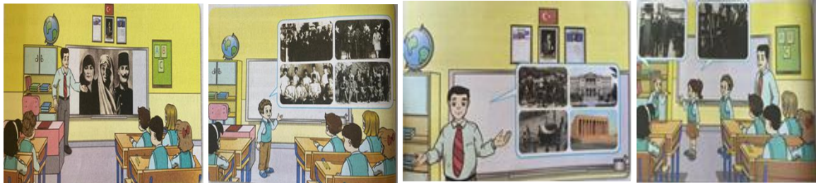
Görsel 4. Atatürk'ün Hayatı metninde yer alan görseller

Atatürk’ün Hayatı Metni dört sayfaya bölünmüştür. İlk sayfada ve üçüncü sayfada görsel metnin üstünde, ikinci sayfada metnin altında yer almaktadır (Görsel 4). Son sayfada ise görsel metnin ortasına yerleştirilmiştir. Birinci görselde bir sınıf ortamı, öğrenciler ve öğretmen yer almaktadır. Tahtada Atatürk’ün ailesine ait bir görsel açılmış, öğretmen ders anlatmaktadır. İkinci görselde bir öğrenci tahtaya çıkmış, konuşma bölümünün içerisine Atatürk ile ilgili dört tane fotoğraf yerleştirilmiştir. Üçüncü görselde ise bu defa anlatan öğretmendir; onun konuşma balonunda ise Atatürk’ün ölümü ile ilgili fotoğraflara yer verilmiştir. Son görselimizde de yine öğrenciler tahtaya çıkmışlar ve bir şeyler anlatıyorlar. Onların konuşma balonunda da Atatürk ile ilgili iki fotoğraf yer almaktadır.