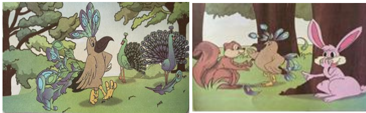
Görsel 16. Tavus Kuşuna Özenen Alakarga metninde yer alan görseller

Tavus Kuşuna Özenen Alakarga metni üç sayfaya bölünmüştür. Birinci sayfada metnin altında bir görsel, ikinci ve üçüncü sayfada metnin üstünde bir görsel yer almaktadır (Görsel 16). Birinci görselde bir kuş, tavus kuşlarından, düşen tüylerini kuyruğuna ve başına takmış görünüyor. İkinci görselde bu kuşu gören sincap ona bir şeyler söylüyor; tavşan ise bu duruma gülüyor. Üçüncü görselde ise tavus kuşunun tüylerini kendine takan kuşu üç tane tavus kuşu arasına almış ve onlara kızıyor.